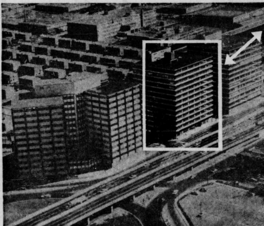
BOULEVARDS ST-LAURENT ET METROPOLITAIN • Téléphone: 389-1373

Il y a peut-être encore beaucoup d'espace à bureaux à louer dans la ville, mais pas à la