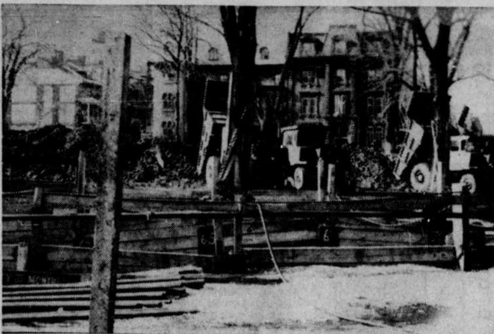
En dépit de l'hiver qui hésite, mais se prolonge, les travaux continuent 'dans' les chantiers du métro de Montréal. Le square Viger, cher aux clochards et aux rentiers du quartier, a dû être sacrifié aux ouvriers troglodytes. Dans quelques mois, pourtant, il renaîtra, percé seulement, de ci de là, par quelques bouches d'aération.

Au sujet des contrats forfaitaires la Ville accepte de faire exécuter par ses employés tous les travaux qui sont aujourd'hui exécutés en partie par ses employés à l'exception de l'enlèvement des déchets et 50 p. de l'enlèvement de la neige. En plus, les entrepreneurs seront tenus de payer à leurs employés les mêmes salaires que la Ville paie aux employés manuels.