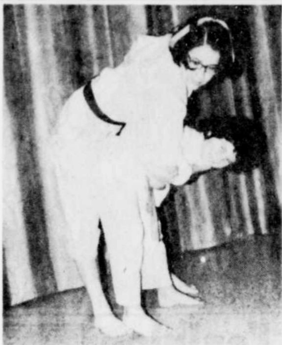
JUDO — Un championnat junior de judo sera disputé le 17 mai à Victoriaville. Une centaine de concurrents sont en lice.