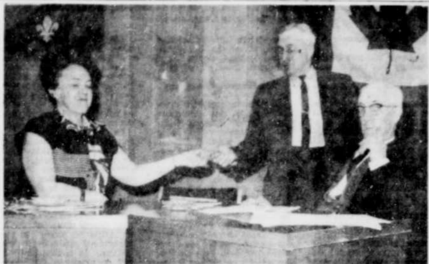
REFERENDUM — Le référendum sur le projet de permis de taverne à Arthabaska a commencé hier et déjà de nombreux citoyens se sont prévalus de leur droit de vote.