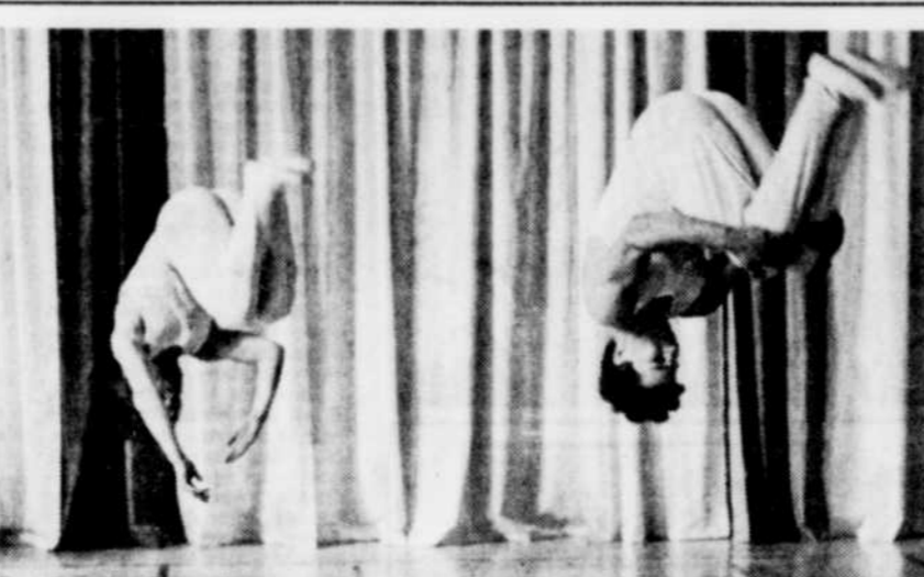
LE POPULAIRE GROUPE de gymnastes magogois, les Intrépides, après avoir connu un grand succès au centre Paul Sauvé à Montréal, en fin de semaine dernière, participent au spectacle présenté dans les cadres du Salon du Printemps de Sherbrooke, au Palais des Sports. Ils ont présenté un spectacle hier soir, et les prochains spectacles sont prévus pour aujourd'hui à 9 h 30 p.m., demain et dimanche à 4 h 30 p.m. et 9 h 30 p.m. Sur la photo, deux membres de l'roupe exécutant des sauts périlleux avant.

Plusieurs raisons militent en faveur de l'achat de cette école, soit les facilités de huit classes, un gymnase, une cafeteria, une bibliothèque et des bureaux pour les professeurs. Ceci dit, les gens de Beebe auraient avec l'achat de cette école, tout ce qu'il faut pour garder leurs enfants. Avec l'achat de cette école, il faudrait éventuellement vendre l'école Notre-Dame-de-la-Merci de Rock Island qui ne sert que pour deux ou trois classes. Ces points ont cependant été refusés car il en coûterait plusieurs milliers de dollars pour préparer pour septembre 1969 cette école. De plus, l'idée d'avoir une cafeteria ne serait selon un commissaire pas plausible car actuellement la majorité des catéchetes en usage dans les différentes écoles des commissions scolaires sont déficientes. Ces déficits ne sont pas admissibles et c'est le contribuable qui paie le déficit. D'un autre côté, s'il y avait achat, les deux écoles de la commission scolaire St-Joseph, soit l'école Ste-Thérèse et le couvent l'Espérance, seraient vendues.