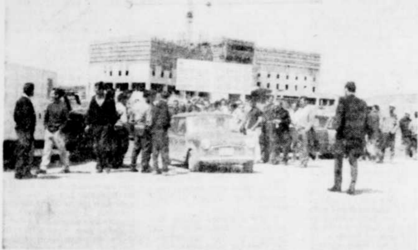
DEBRAYAGE CHEZ LES EMPLOYÉS DU BATIMENT — Une cinquantaine de grévistes de la construction de Québec ont fait leur entrée à Thetford Mines hier midi pour inviter leurs confrères à déclencher le débrayage. La photo ci-haut a été prise à la sortie du chantier de l'hôpital général de Thetford, lequel s'est vidé en l'espace d'une quinzaine de minutes.