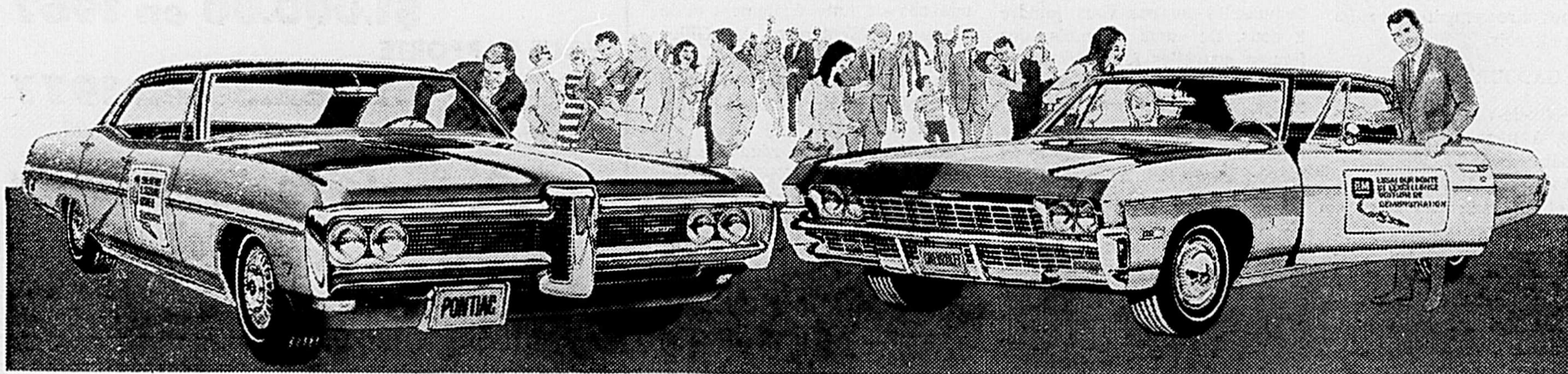
A gauche: le sedan sport Pontiac Parisienne. A droite: le coupé Chevrolet Impala Custom.

à essayer les seules voitures portant le Symbole d'Excellence. Regardez bien, écoutez bien et vous constaterez la supériorité évidente des voitures GM sur les autres voitures 1968. Les conduire, c'est se convaincre. Venez donc aujourd'hui même. Votre voiture d'essai vous attend.