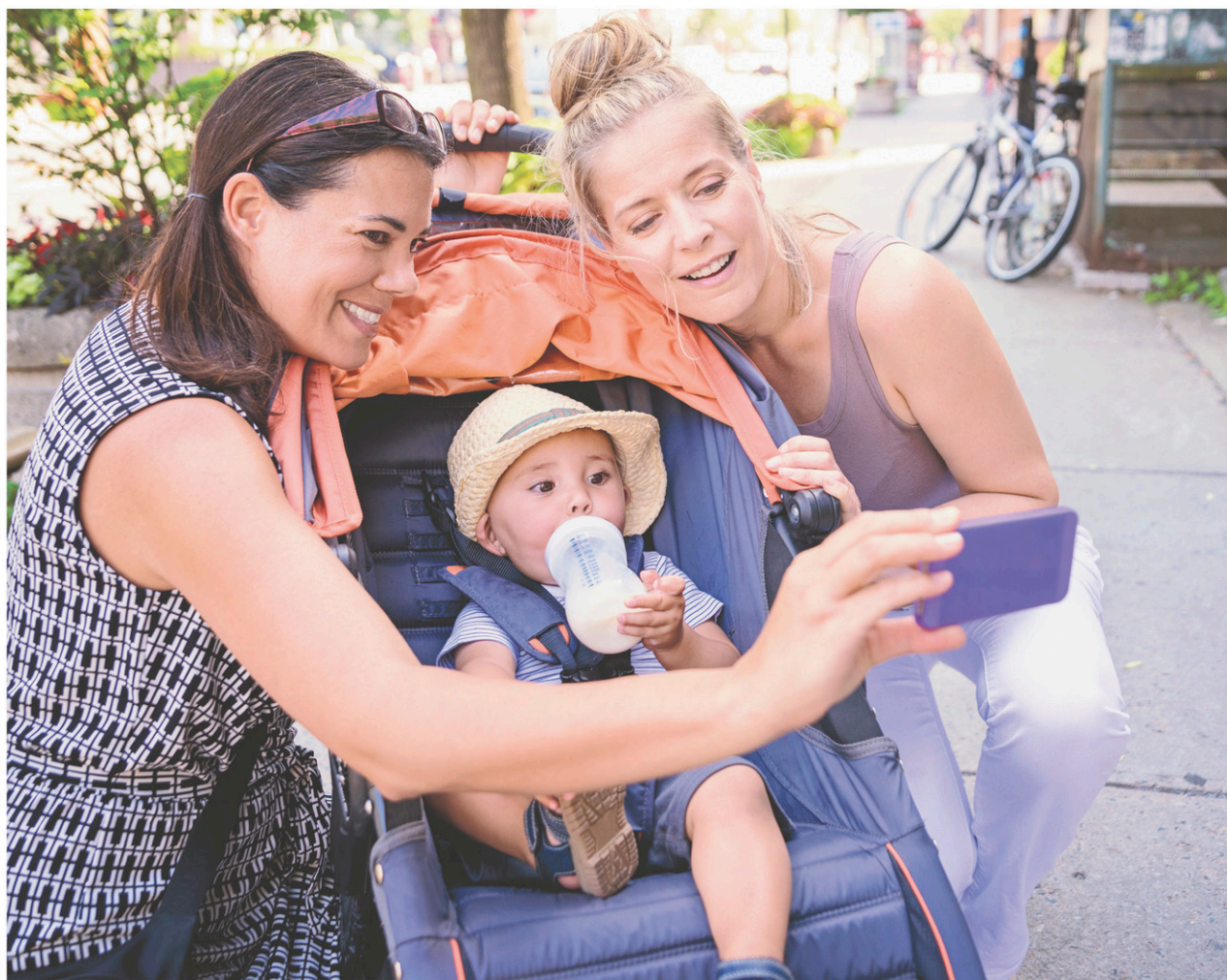
MARTINE DOUCET GETTY IMAGES

Prétendant produire une programmation qui répond aux besoins et aux désirs des mères, ces espaces font bien plus que briser l'isolement des femmes à la maison, ils créent les mères d'aujourd'hui. Elles deviennent non pas des mamans, mais des expertes de la maternité. Grâce aux cours de RCR, au soutien à l'allaitement exclusif et aux ateliers sur le sommeil, elles se retrouvent donc responsables non seulement des besoins primaires du bébé — santé, alimentation et sommeil —, mais aussi de (sur)veiller à son bon développement moteur, social et psychosocial. Et pour assurer