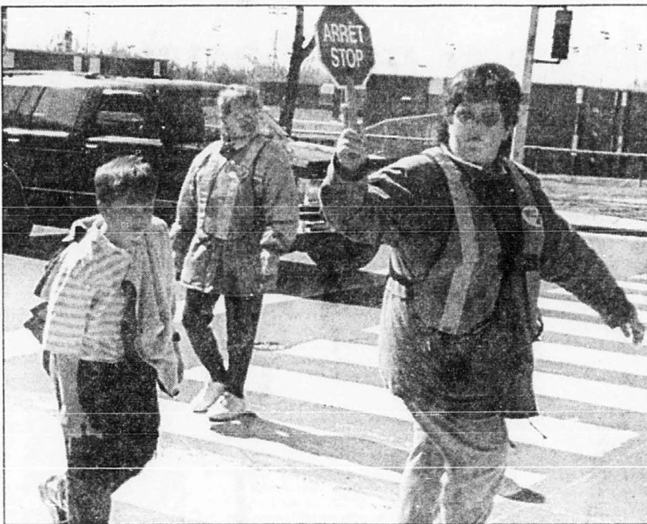
La sécurité des enfants devra, quoi qu'il advienne, demeurer la première priorité.

Dans votre réponse du 28 mars 1995, après nous avoir dit que vous suspendiez votre décision d'abolir les 49 traverses d'éco-