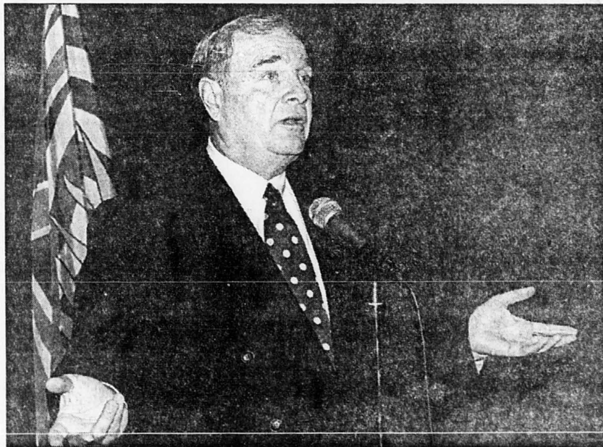
Comme il l'avait fait la veille, le ministre fédéral des Finances, Paul Martin, a indiqué hier que l'éducation serait « le focus » de son gouvernement maintenant que la bataille contre le déficit est presque gagnée.