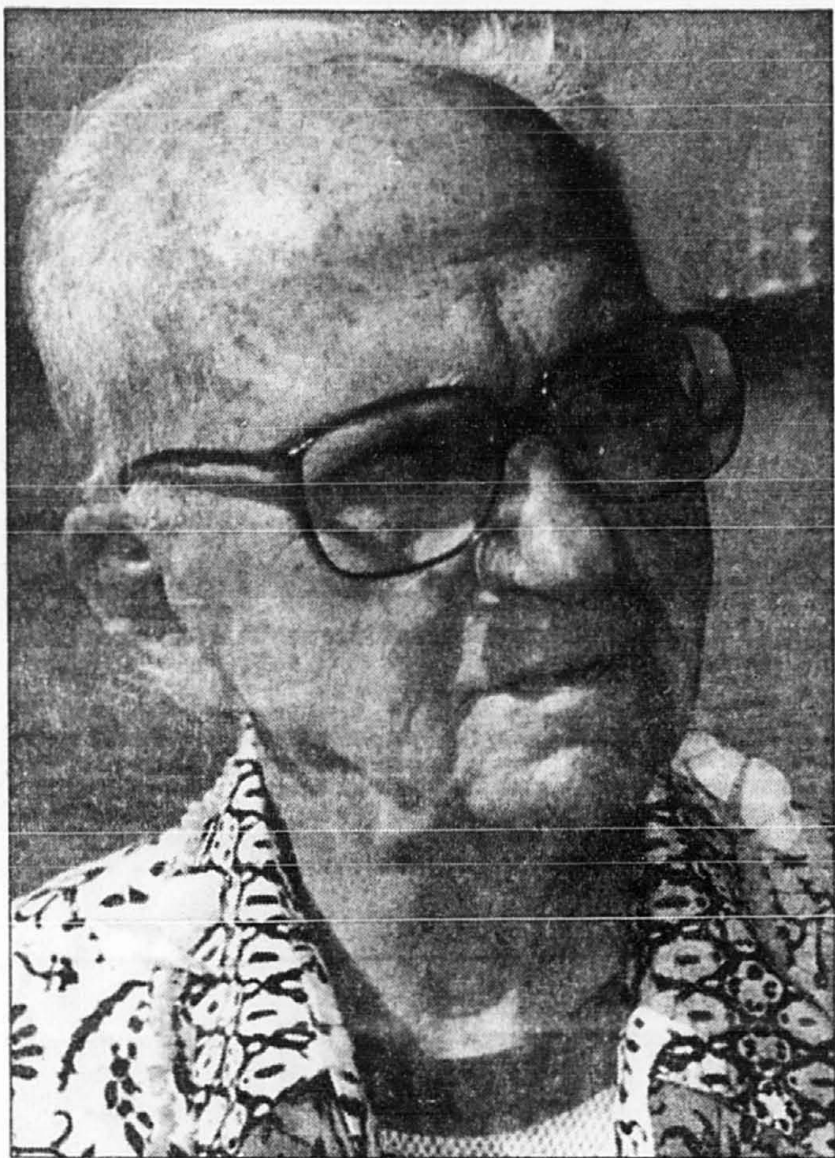
James Michener avait récemment décidé d'interrompre sa dialyse, un traitement permettant de purifier le sang en cas d'insuffisance rénale.