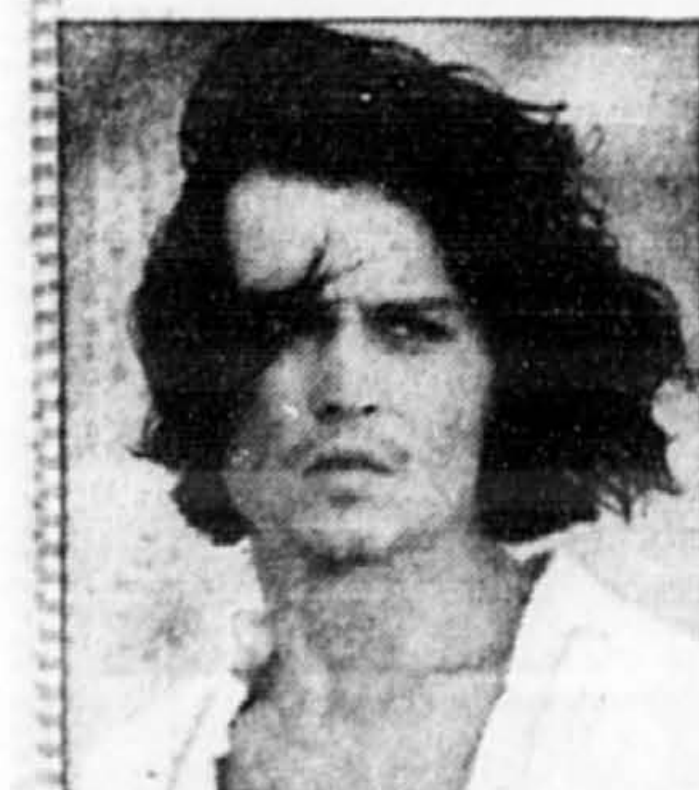
Johnny Depp dans Don Juan de Marco