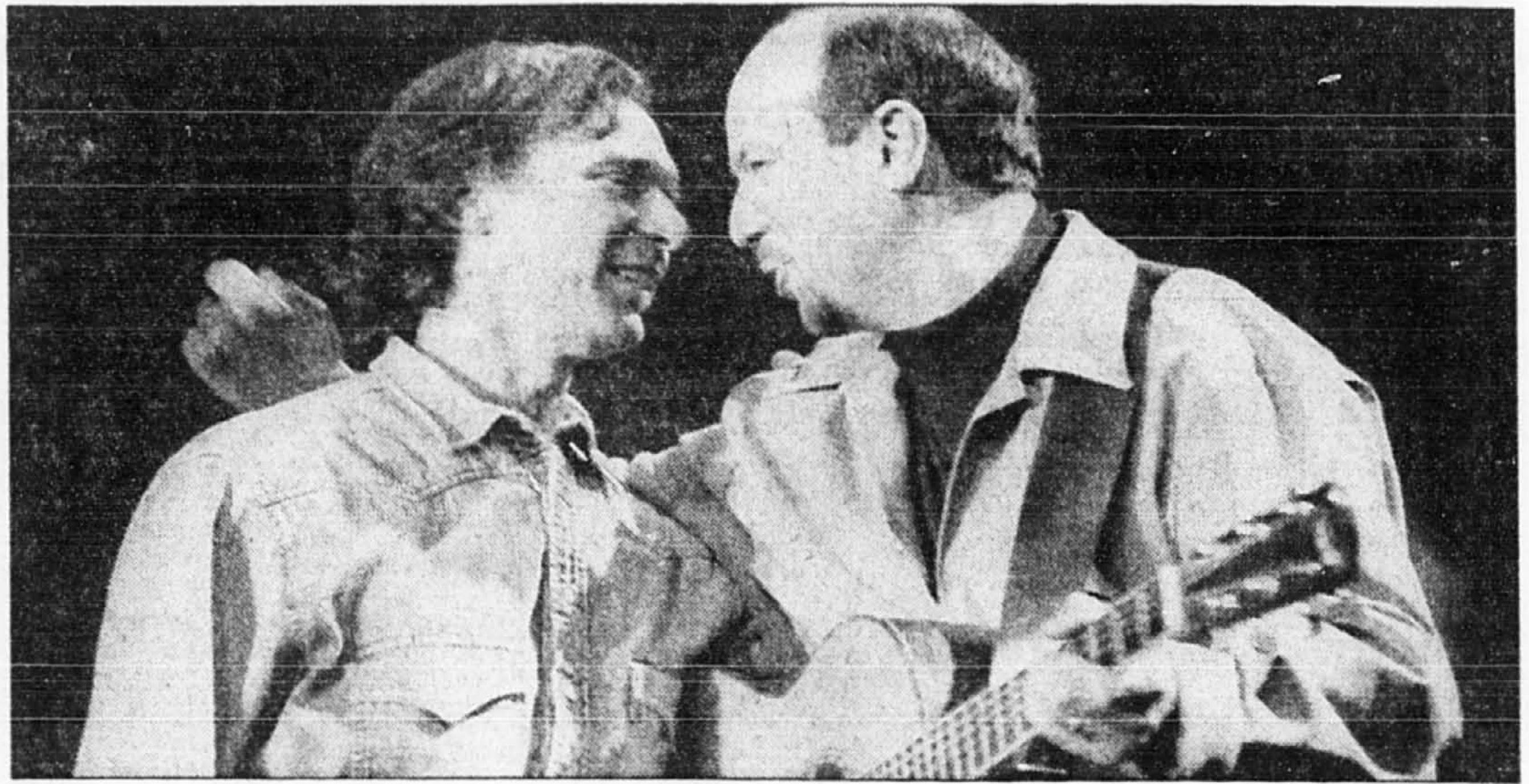
Zachary Richard et Michel Rivard, en duo pendant Marjolaine , ont offert hier soir l'un des rares bons moments du spectacle.

Les bons moments ? Marie-Lise Pilote, qui lance tout bonnement que « ça fait 15 ans que les artistes viennent se produire sur cette scène... et se reproduisent dans les loges », Zachary Richard et Michel Rivard en duo pendant Marjolaine , le spleen savoureux de Lhasa, le