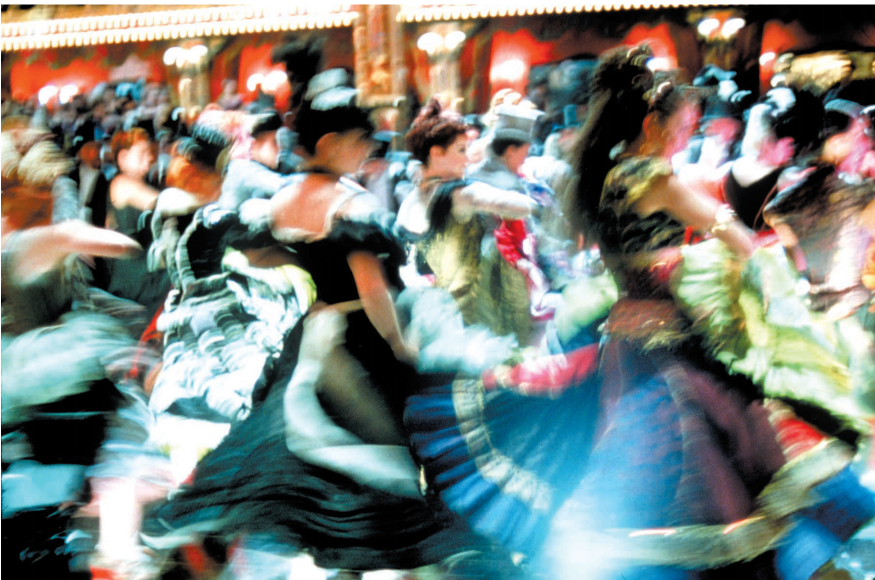
Une scène tirée du film Moulin Rouge .