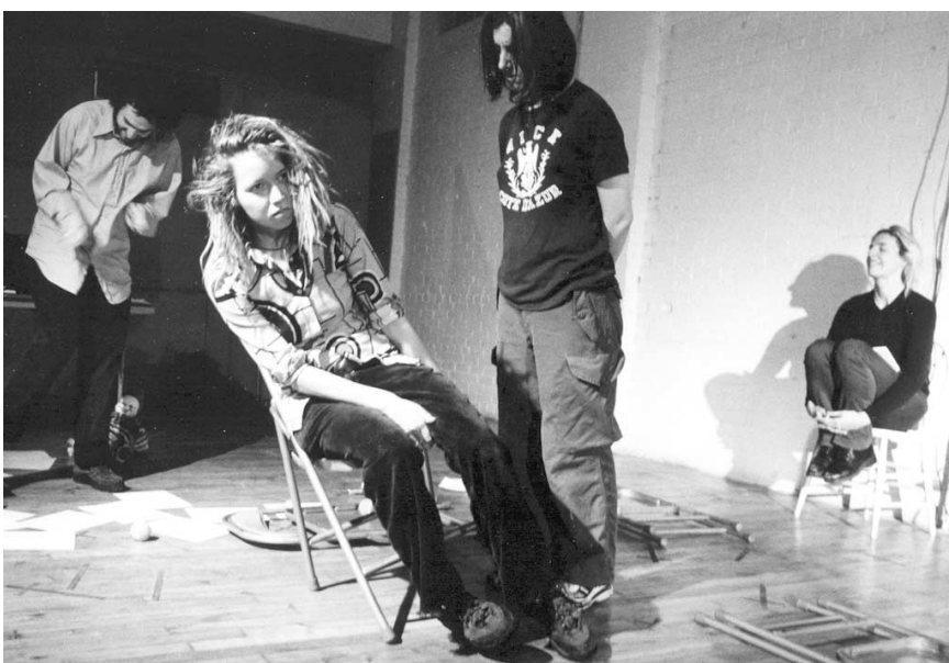
Les comédiens d' En français comme en anglais, it's easy to criticize nous jettent en plein visage la vacuité de nos vies bien rangées.

Mais ces changements se révèlent secondaires, puisqu'ils ne sont prétextes qu'à une critique des médias ou plutôt, à la critique d'une critique des médias. Sait-on vrai-