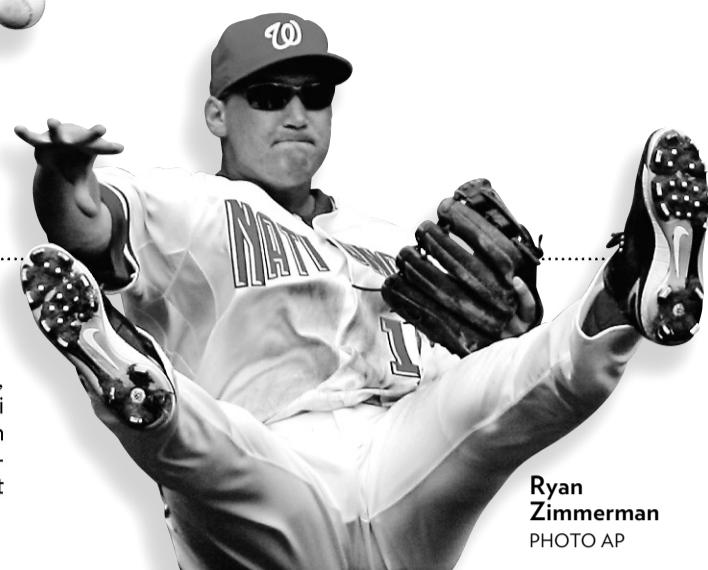
Ryan Zimmerman

Les Nationals de Washington sont mieux de savourer la défaite d'hier, qui marquait le début de leur saison. Se retrouver à une partie de la tête, ce sera leur meilleur classement de l'année.