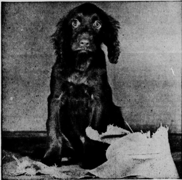
Croqué sur le vif! Un instantané pris juste au bon moment.