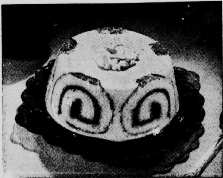
Un dessert ravissant! De la crème espagnole couronnée de gâteau roulé - D'une texture veloutée et d'une saveur délicieuse.