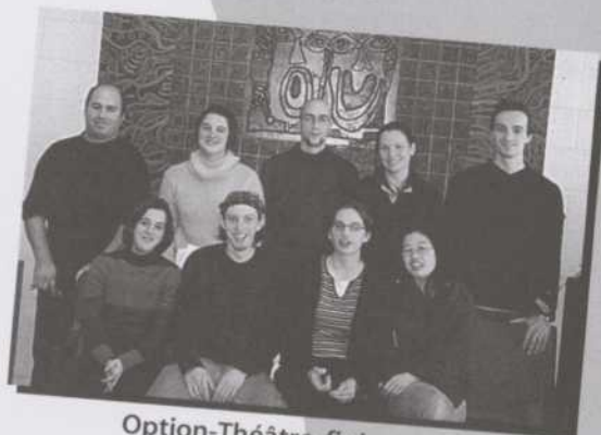
Option-Théâtre, finissants gestion et techniques de scène 2002