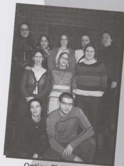
Option-Théâtre, finissants décors et costumes 2002