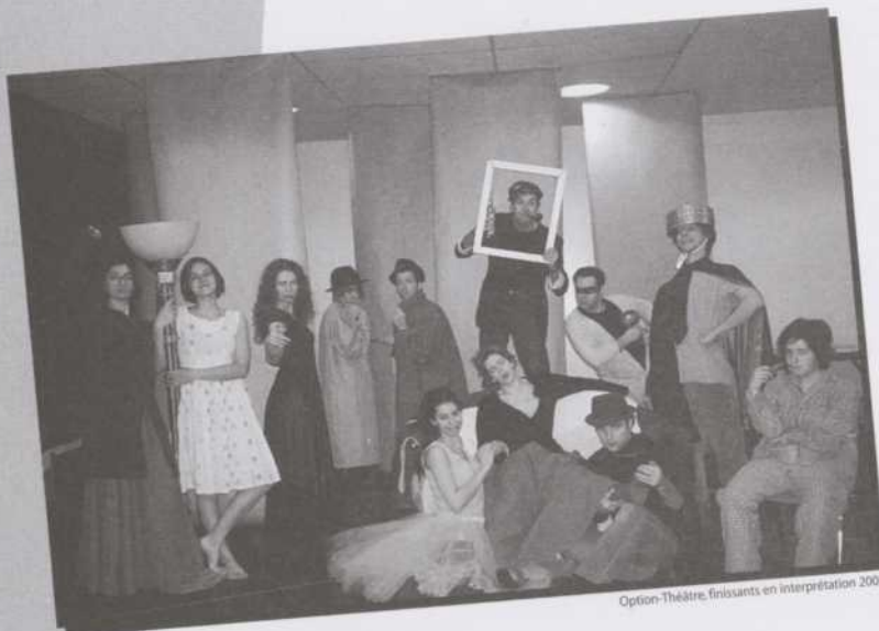
Option-Théâtre, finissants en interprétation 2002