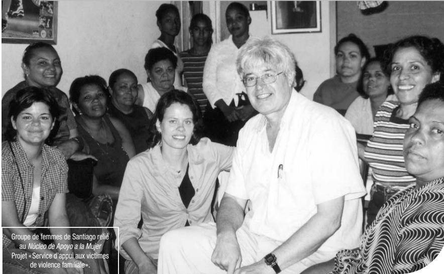
Groupe de Femmes de Santiago relié au Nucleo de Apoyo a la Mujer. Projet « Service d'appui aux victimes de violence familiale ».