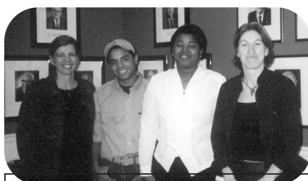
stagiaires RD, volet réciprocité 2002-2003

Parmi les activités menées par Plan Nagua , le programme de formation permet de renforcer les capacités des individus et des organisations tant au Nord qu'au Sud, afin qu'ils deviennent des agents de changements toujours plus efficaces et plus efficients. Les axes d'intervention ciblés sont le développement durable, la communication interculturelle, les habiletés de travail en groupe, la capacité de gestion organisationnelle et l'engagement des individus et des groupes communautaires.