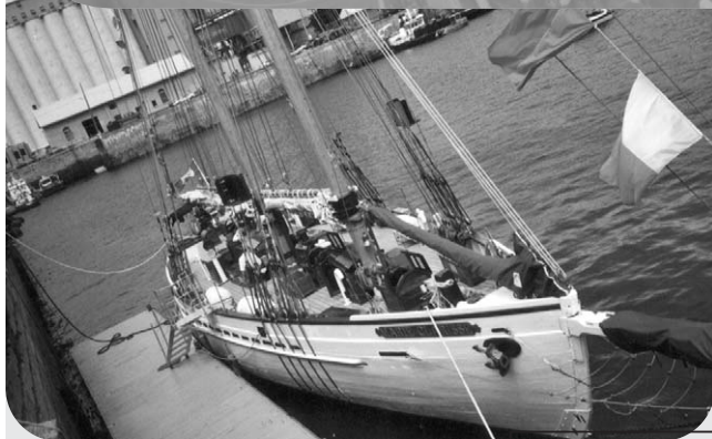
Croisière sur Marie-Clarisse de Loto Québec (campagne de financement)