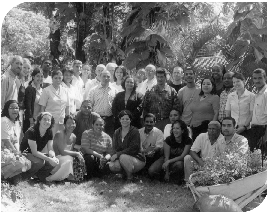
Participants au Séminaire du Collectif dominicain, partenaire de Plan Nagua incluant les volontaires et les stagiaires