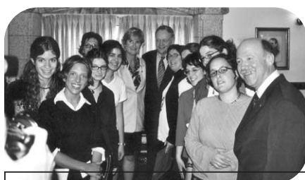
Déclaration jeunesse Ottawa, mai 2002 rencontre avec le Premier Ministre