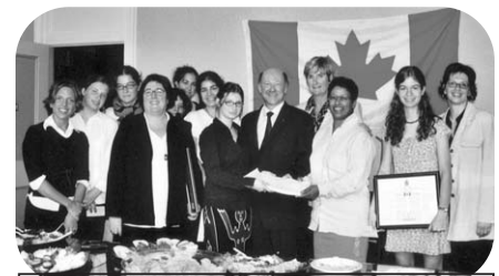
Déclaration Jeunesse remise à Denis Paradis (secrétaire d'État pour l'Amérique latine, l'Afrique et la Francophonie) et Marlène Jennings (secrétaire parlementaire représentant Susan Whelan, ministre de la coopération internationale)

Ce projet est né dans la foulée des activités entourant la tenue du Sommet des peuples et il s'est déroulé tout au long de l'année 2002. Son intérêt réside dans le fait qu'il a permis à 40 jeunes de s'engager à vivre une expérience concrète de participation communautaire, dans une perspective de développement et de responsabilisation de la société civile. Les thèmes de l'environnement, du leadership, de l'action communautaire et de la coopération internationale ont fait partie des nombreux sujets abordés. Une journée complète a été consacrée au thème Les jeunes et le développement durable , au cours de laquelle les participants ont pu se familiariser avec les enjeux soulevés par cette question et avec la réalisation de projets de coopération internationale. Cette activité incluait la participation des deux représentants du collectif dominicain et visait à assurer un échange Nord-Sud. Le projet Solid'Action jeunesse s'est conclu par une kermesse dans les rues du quartier Saint-Roch en août 2002, ce qui a ainsi permis aux jeunes participants de partager avec le public leur expérience d'engagement communautaire.