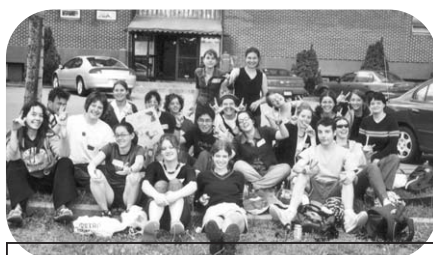
Participants au projet Solid'Action Jeunesse 2002

L'année qui vient de se terminer n'a guère été facile pour les organisations membres et partenaires du collectif haïtien. Plus que jamais, la situation dramatique en Haïti a forcé la mise en œuvre de toute une série de moyens pour venir en aide à ce pays, dont la sollicitation expresse des partenaires canadiens de Plan Nagua , soit la FTQ et ses syndicats affiliés, TCA, SCEP, STTP, SCEP. Ces efforts se sont soldés, entre autres, par le choix et par l'envoi de deux volontaires du Québec qui ont accepté de mettre leurs connaissances et leur expérience au profit de la tenue d'ateliers de formation en Haïti. Six mois d'accompagnement sur le terrain ont ainsi permis d'offrir un programme de formation axé sur le mouvement syndical et le développement organisationnel, d'identifier les leaders, de former des agents multiplicateurs et de concevoir un plan d'action pour la prochaine année.