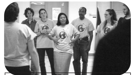
Visite des partenaires dominicains (NAM+FECCOIPCEN) juin 2002, Québec