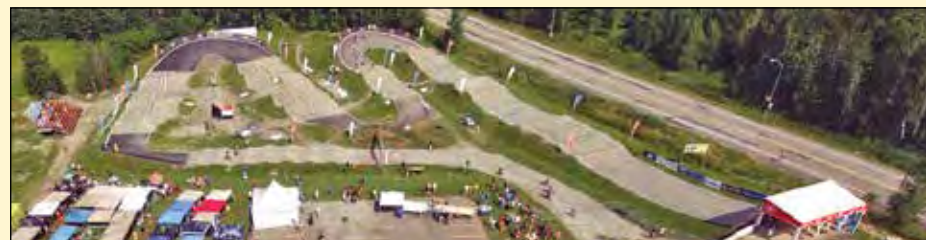
Ceux qui deviennent membres du Club peuvent profiter de belles installations situées au Campus Notre-Dame-de-Foy.