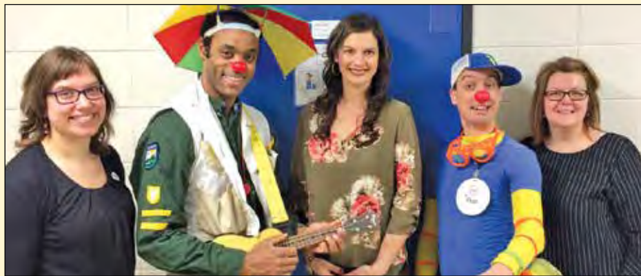
La députée de Louis-Hébert et des professionnels de la Fondation D' Clown.

(MS) Geneviève Guilbault a rencontré plusieurs représentants de Louis-Hébert dans le cadre de ses visites durant les dernières semaines. En plus des Hivernales de Cap-Rouge, la députée s'est rendue au Centre de prévention du suicide de Québec (CPSQ) et auprès de la Fondation D' Clown.