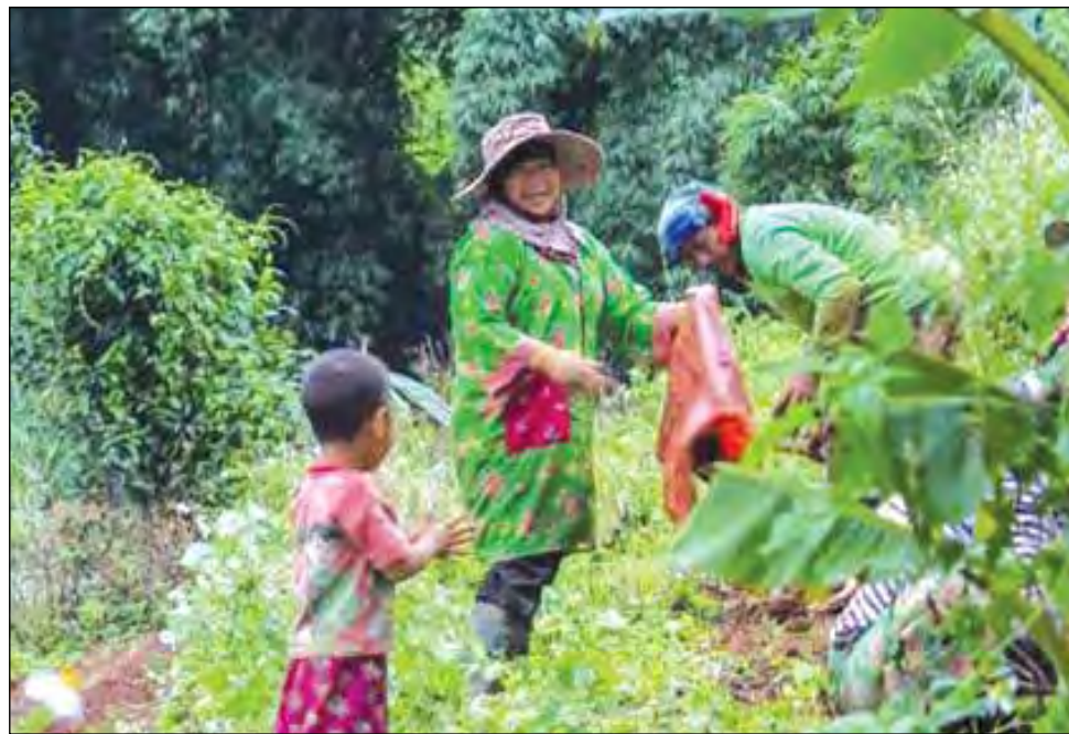
À compter du 9 mars prochain, les étudiants en provenance des universités et des cégeps québécois sont invités à s'inscrire à cette nouvelle campagne afin de vivre une expérience hors du commun.

L'organisation développe une plateforme et un réseau de tourisme villageois pour connecter les communautés d'accueil avec les voyageurs. Village Monde développe plusieurs choses pour vivre les voyages différemment, notamment en offrant des programmes d'assistance pour la structuration et le suivi des projets de développement ou l'amélioration d'offres existantes. De plus, Village Monde offre son support grâce à de l'aide financière combinant dons, microcrédit, financement participatif ( crowdfunding ) en partenariat avec d'autres organismes. De plus, l'organisation philanthropique a mis en place un réseau et une plateforme technologique