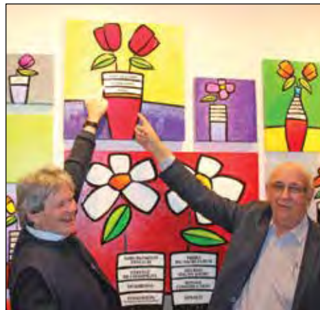
Depuis de nombreuses années, le Club Lions Cap-Rouge/Saint-Augustin soutient la Maison Jean Lafrance.

désir et parce qu'ils croient en ces jeunes, ces partenaires mettent tous leurs efforts dans cette cause.