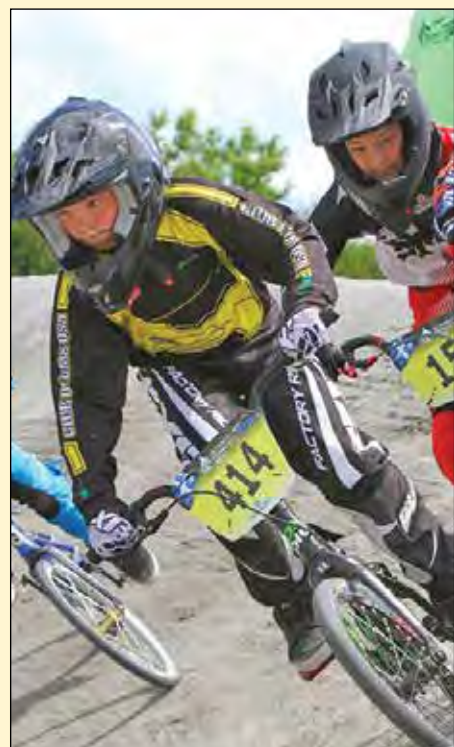
Deux programmes existent pour les personnes qui intègrent le Club de BMX QSA.

Le Club de BMX de Québec-Saint-Augustin (QSA) est un jeune club dynamique qui a pour objectif principal de promouvoir l'enseignement et la pratique du BMX de façon encadrée et sécuritaire. Basé au Campus Notre-Dame-De-Foy, le Club offre aux jeunes de tous les niveaux la possibilité de vivre des expériences uniques. Membre de la Fédération québécoise des sports cyclistes (FQSC), le Club de BMX de Québec participe au circuit de la Coupe du Québec. Il est entièrement administré et opéré par des bénévoles. ■