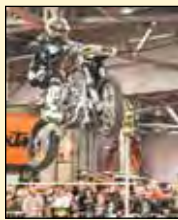
Le Salon de la Moto et du VTT 2018

Le Salon de la Moto et du VTT de Québec, présenté par La Capitale Assurances Générales, a rassemblé une dense foule à Exposité du 4 au 4 février dernier, malgré les caprices de Dame Nature qui a fait se déferler sur Québec une importante bordée de neige le dimanche. Ce sont plus de 18 000 visiteurs qui ont franchi les portes du Salon, prouvant ainsi leur amour indéfectible pour les bolides à deux roues! Cette année, bonne nouvelle, la majorité des visiteurs ont passé plus de temps sur le site du Salon que par les années passées, profitant ainsi amplement de la présentation des nouveaux modèles comme des activités et spectacles sur place.