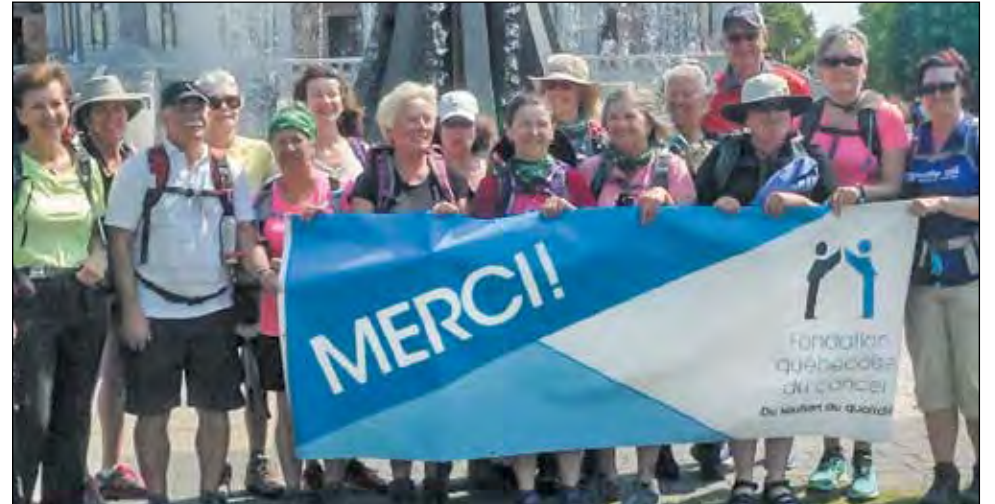
Le groupe de marcheurs lors de la deuxième édition du défi du Chemin des Sanctuaires à leur arrivée au Sanctuaire Sainte-Anne-de-Beaupré.