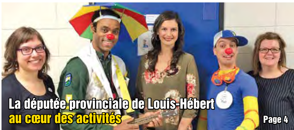
La députée provinciale de Louis-Hébert au cœur des activités