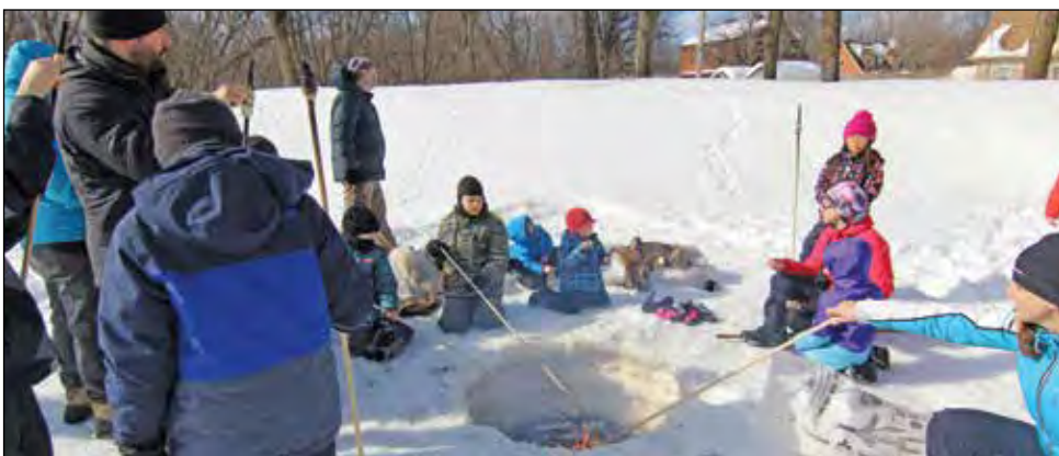
Une représentante de la Maison Léon-Provancher a permis à ceux qui le souhaitaient de manger du pain-bannique sur un feu de bois.