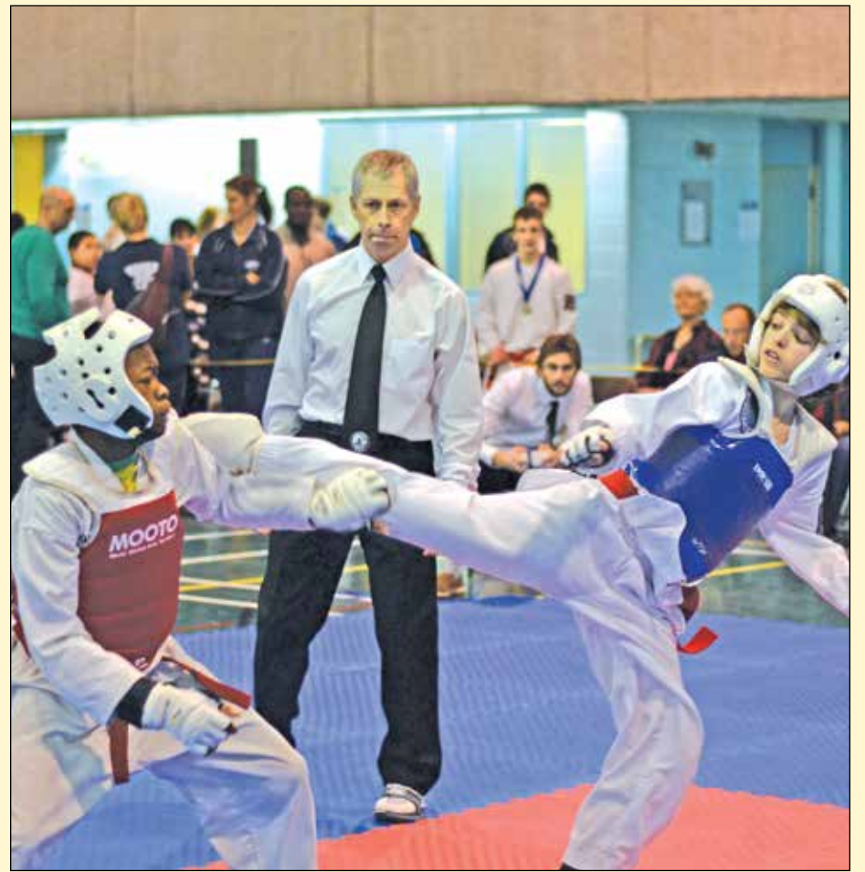
Un souper spaghetti aura lieu le 10 mars prochain pour le Club de Taekwondo Cap-Rouge/Saint-Augustin.

(MS) Le Club de taekwondo Cap-Rouge/Saint-Augustin organise un souper spaghetti qui aura lieu le 10 mars prochain à compter de 17 h au centre communautaire Champigny. Le tarif s'élève à 20 $ pour les adultes et à 10 $ pour les enfants de moins de 12 ans. Pour tout achat, il est nécessaire d'en faire la demande au info@tkd-crsa.ca . Lors de cette occasion, de la bonne nourriture et une démonstration de taekwondo seront au rendez-vous. ■