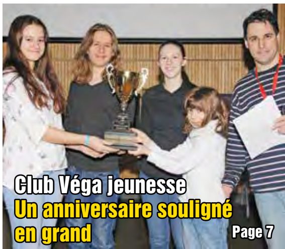
Club Véga jeunesse Un anniversaire souligné en grand