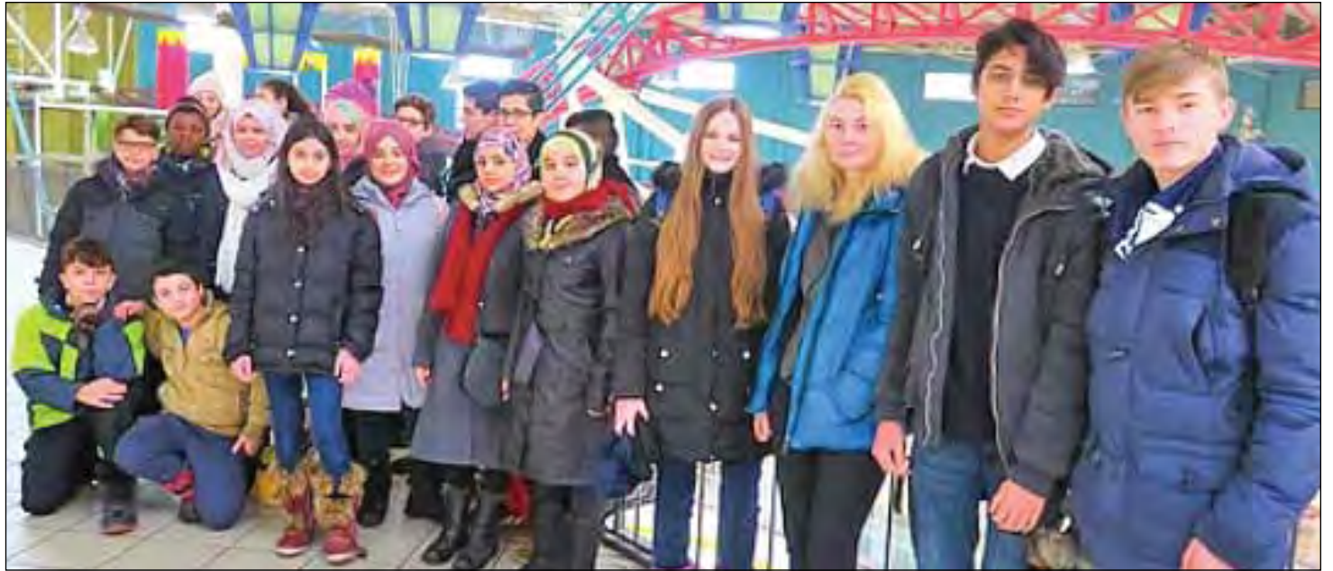
Plusieurs jeunes originaires d'un peu partout se côtoient dans le cadre des différentes activités proposées.

Grâce à cette initiative, les citoyens sont invités à venir rencontrer de nouvelles personnes de plusieurs nationalités à travers diverses activités sportives. Ce mois-ci, les personnes intéressées sont invitées à jouer au soccer le 10 mars et au basketball le 24 mars prochain. Gratuitement, ces rassemblements sportifs offriront l'opportunité à ceux qui le souhaitent d'ouvrir leur horizon. Au cours de la prochaine année, diverses activités seront ainsi offertes en lien avec ce projet afin de créer des liens avec d'autres jeunes et de leur faire vivre une expérience positive. Plus d'informations sont disponibles directement auprès de la Maison des jeunes de Cap-Rouge. ■