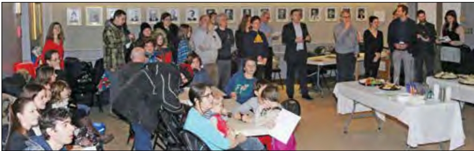
De nombreuses personnes étaient présentes durant les festivités entourant la célébration du Club Véga jeunesse.