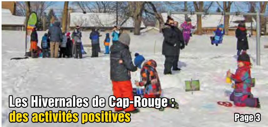
Les Hivernales de Cap-Rouge : des activités positives