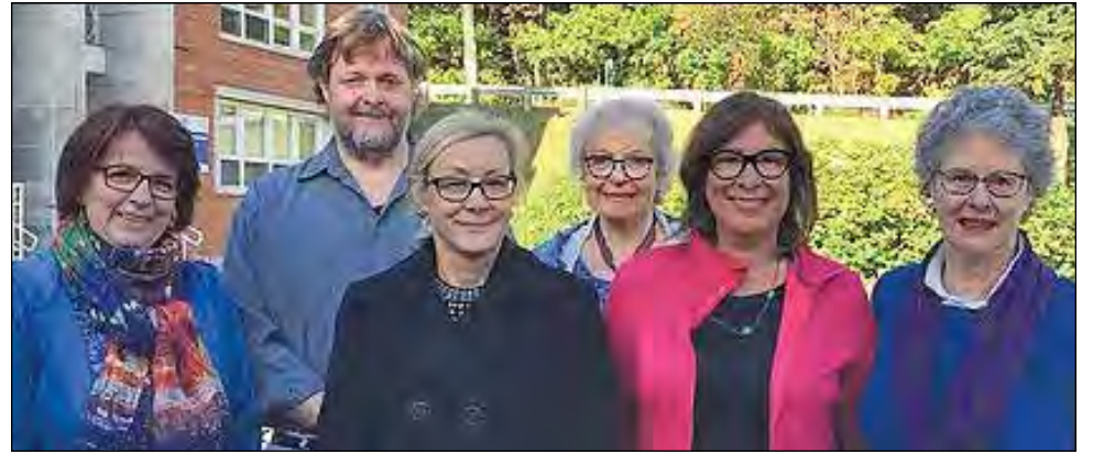
À l'occasion de cet anniversaire du MAACR, le conseil d'administration souhaite créer un événement rendant hommage aux fondateurs du Mouvement et à tous ceux qui l'ont fait vivre au fil des ans.

Dans cette optique, toute personne intéressée à faire partie du comité est invitée à communiquer par courriel avec le secrétariat du MAACR à l'adresse courriel suivante : maacr@outlook.com. ■