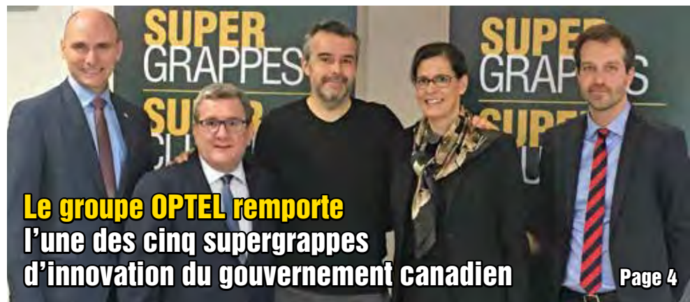
Le groupe OPTEL remporte l'une des cinq supergrappes d'innovation du gouvernement canadien