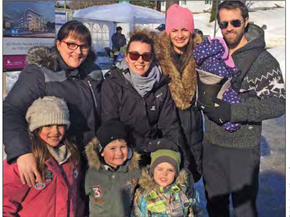
La députée provinciale, Geneviève Guilbault est venue rencontrer les citoyens en compagnie de son conjoint et sa fille.