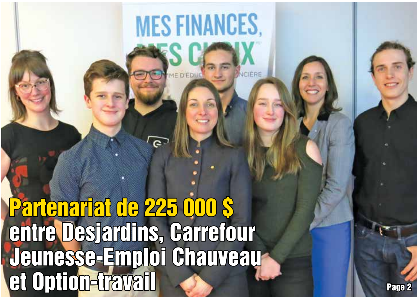
Partenariat de 225 000 $ entre Desjardins, Carrefour Jeunesse-Emploi Chauveau et Option-travail