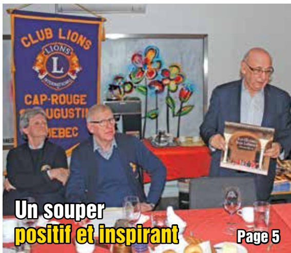
Un souper positif et inspirant

Le Journal d'information | www.journal-local.ca