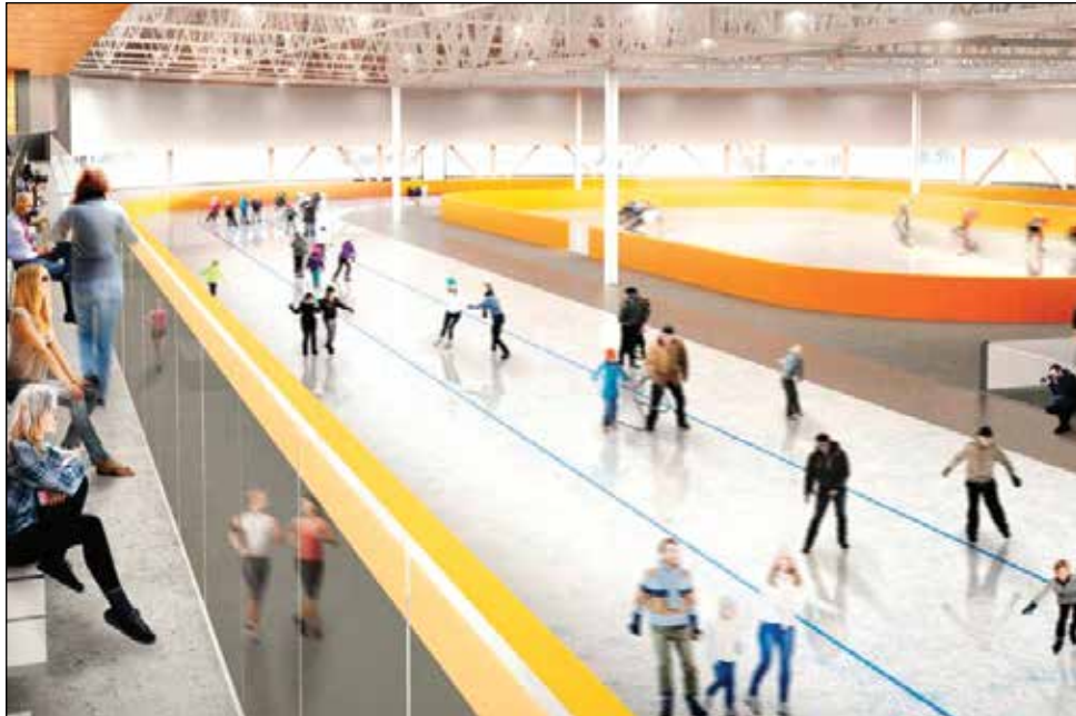
Centre de glaces, avec un anneau de glace couvert de 400 mètres et deux patinoires.

Le Centre de glaces concentrera les sports de glace dans un site central et facile d'accès, en complémentarité avec le Centre sportif de Sainte-Foy. Il comprendra un anneau de 400 mètres pour accueillir des compétitions d'envergure nationale et internationale en plus d'héberger le centre d'entraînement national Gaétan-Boucher. L'anneau comprendra au centre deux surfaces glacées, une pour le patinage de vitesse courte piste et le patinage artistique, et l'autre pour un usage polyvalent pour le hockey ou le patinage libre. Le budget total du projet est de 68,7 M$, assumé à parts égales par le gouvernement du Canada, le gouvernement du Québec et la Ville de Québec. ■