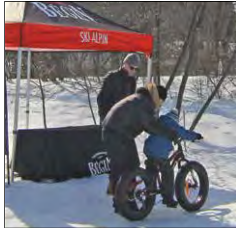
Plusieurs citoyens se sont initiés à la pratique du Fat-Bike grâce à Performance Bégin.