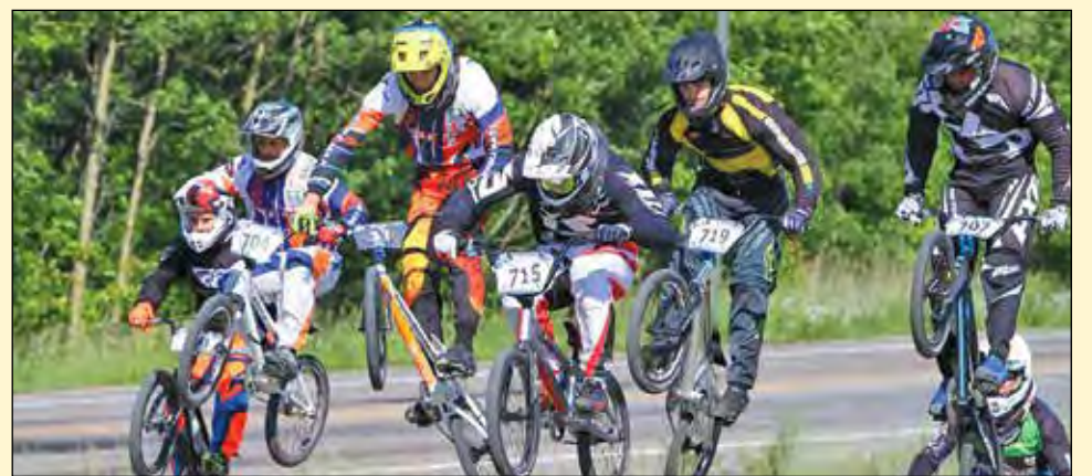
Chaque année, plusieurs athlètes intègrent le Club BMX QSA pour se surpasser.