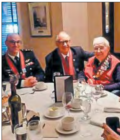
Le copropriétaire du Tuscanos en compagnie de quelques membres de l'Ordre de Bonhomme Carnaval.