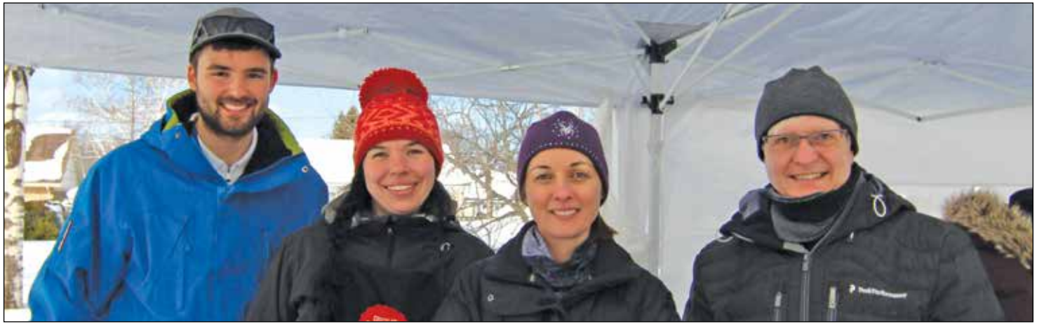
La Caisse populaire Desjardins de Cap-Rouge, en collaboration avec l'entreprise gourmande Chocolats Favoris offrait du bouillon de poulet et du chocolat chaud aux citoyens qui souhaitaient se réchauffer.

Grâce à la Maison Léon-Provancher, les citoyens ont pu cuire un pain-bannique sur un feu de bois. Cette activité a eu incontestablement un succès fou. La Caisse populaire Desjardins de Cap-Rouge était également présente afin d'offrir du bouillon de poulet et du chocolat chaud, grâce à la collaboration de Chocolats Favoris. Celles et ceux qui sont membres Desjardins ont pu accéder au bar à guimauves installé pour l'occasion afin de personnaliser leur chocolat chaud.