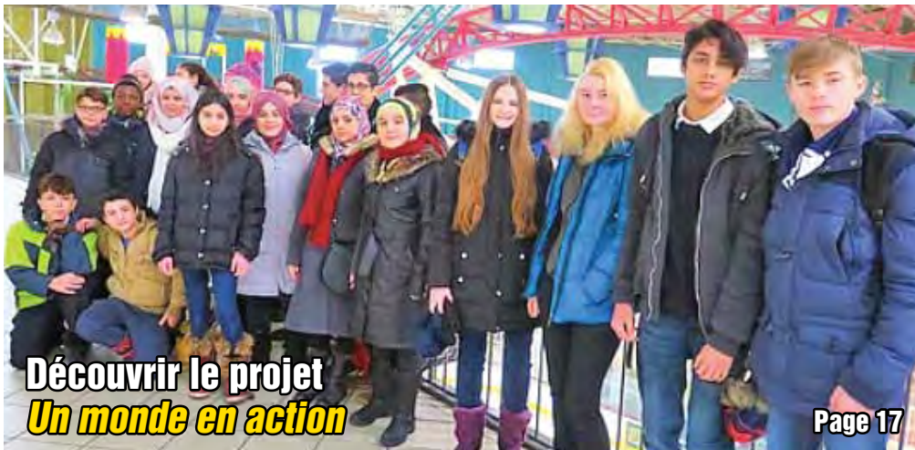
Découvrir le projet Un monde en action