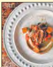
Les calmars confits du menu spécial 4 e anniversaire

Au cours des prochains mois, le meilleur, mais surtout l'unique, restaurant corse de la province, Petits Creux & Grands Crus, procédera, dans la foulée de son 4 e anniversaire, à un réaménagement de sa salle à manger afin de proposer à sa fidèle clientèle une expérience encore plus sensationnelle! Et autre bonne nouvelle : le bistrot de quartier, qui ouvre déjà sept soirs sur sept, sera dès avril également ouvert cinq midis par semaine, pour le plus grand plaisir des habitués du secteur qui s'y sentent comme chez eux! Également, Petits Creux & Grands Crus a le plaisir d'offrir depuis quelque temps à sa clientèle de rapporter à la maison les saveurs authentiques de la Corse grâce à la production et à la vente de tartinades sucrées et salées directement au restaurant.