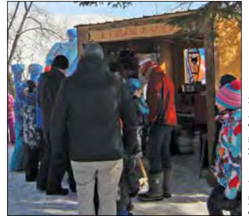
Ceux qui avaient une envie sucrée ont pu profiter d'un stand qui mettait en vedette les produits de l'érable.