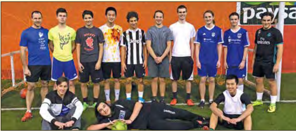
L'équipe U18M, qui a obtenu la première place à l'issue de la saison régulière de l'hiver 2018.