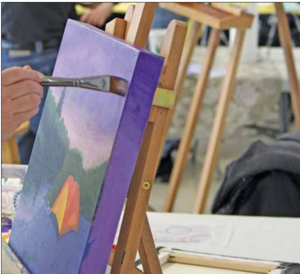
Le Mouvement d'animation artistique de Cap-Rouge (MAACR) souligne ses 40 années d'existence en 2018.