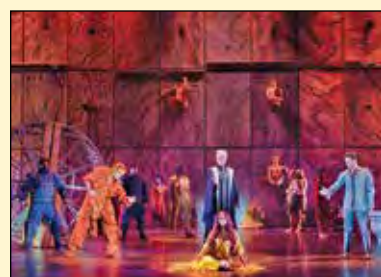
Le spectacle Notre Dame de Paris