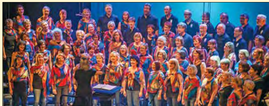
Le Groupe vocal La-Mi-Sol de Saint-Augustin-de-Desmaures offrira un nouveau spectacle le 15 avril prochain.