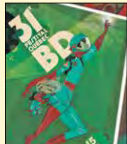
L'affiche du 31 e Festival Québec BD réalisée par l'auteur et illustrateur Paul Bordeleau