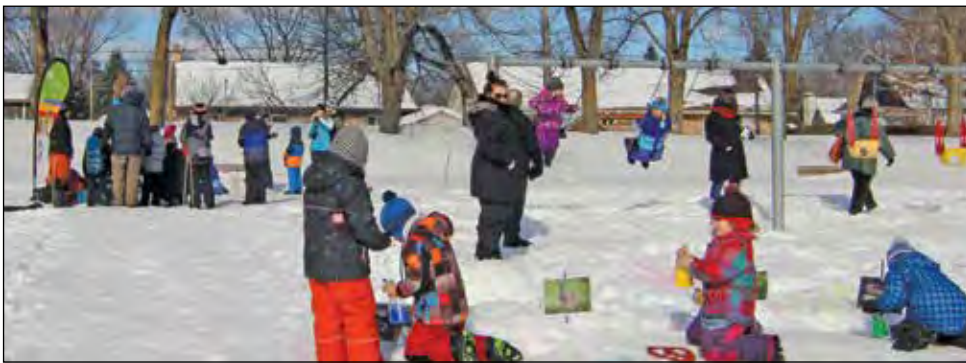
Les familles étaient au rendez-vous lors de cette nouvelle édition des Hivernales de Cap-Rouge.