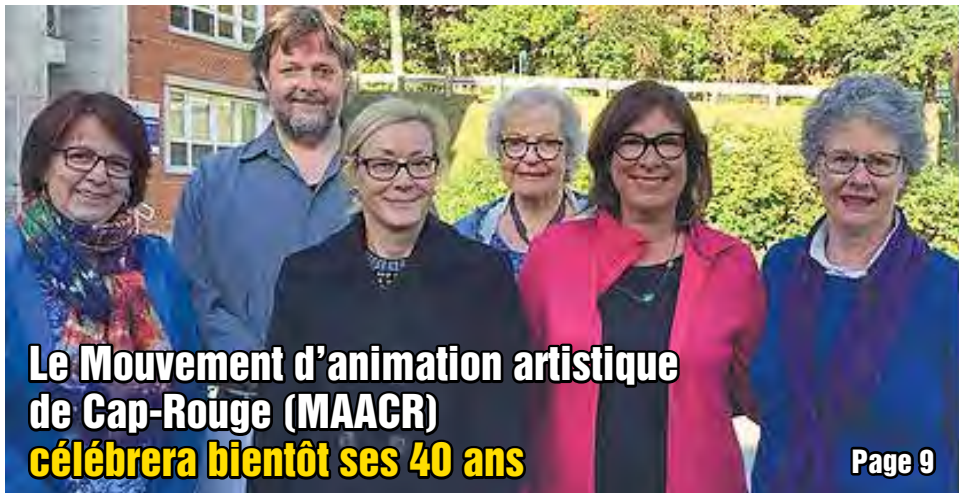
Le Mouvement d'animation artistique de Cap-Rouge (MAACR) célébrera bientôt ses 40 ans