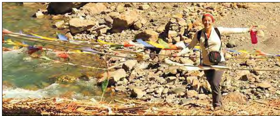
De nombreuses personnes vivent des expériences uniques grâce à l'organisation Village Monde.

participative pour la promotion des destinations et hébergements villageois, pour connecter les communautés d'accueil avec les voyageurs, et ce, à travers le monde.