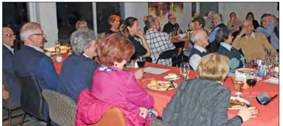
Une trentaine de personnes ont participé au souper de la Saint-Valentin du Club Lions de Cap-Rouge/Saint-Augustin.