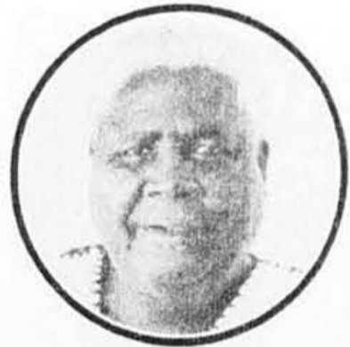
Joshua Nkomo, chef de la ZAPU et député à Harare

Vu d'ici, par le prisme des agences de presse notamment, le régime de l'apartheid apparaît tout puissant et les Etats « de première ligne » font figure de friable magma politique ou regnent le chaos, le totalitarisme et le tribalisme. C'est l'apartheid qui le veut ainsi, et qui se présente d'ailleurs lui-même comme un « gouvernement démocratique », garant de « la loi et l'ordre » et des « valeurs civilisées » en Afrique du Sud, en Namibie occupée et dans toute la région.