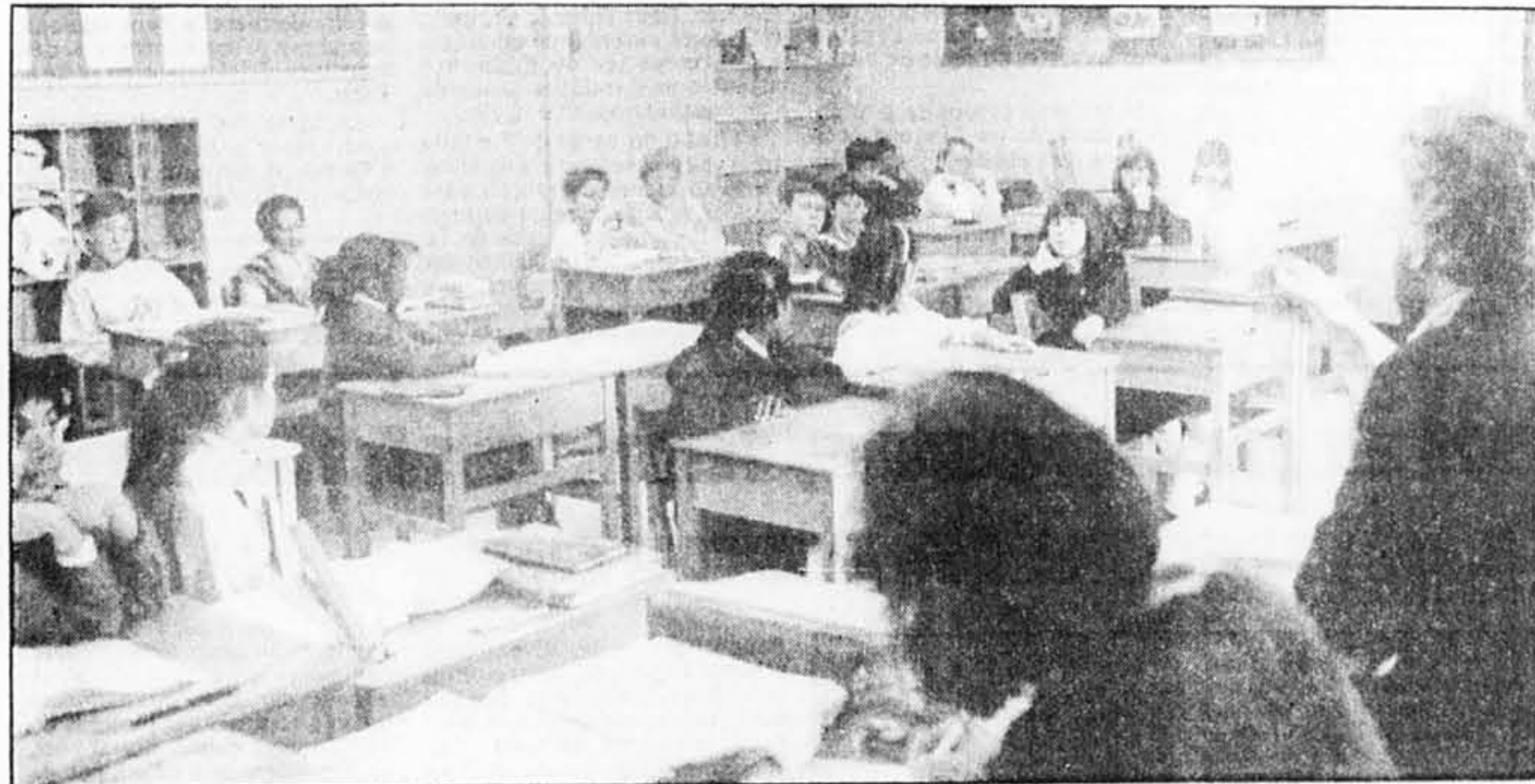
Une classe d'éèves anglophones de l'école française primaire de Pointe-Claire. Les anglophones pensent massivement que le français est essentiel pour leurs enfants.

En somme, les anglophones reconnaissent clairement la nécessité de l'apprentissage du français tant pour eux-mêmes que pour leurs enfants ou les immigrants.