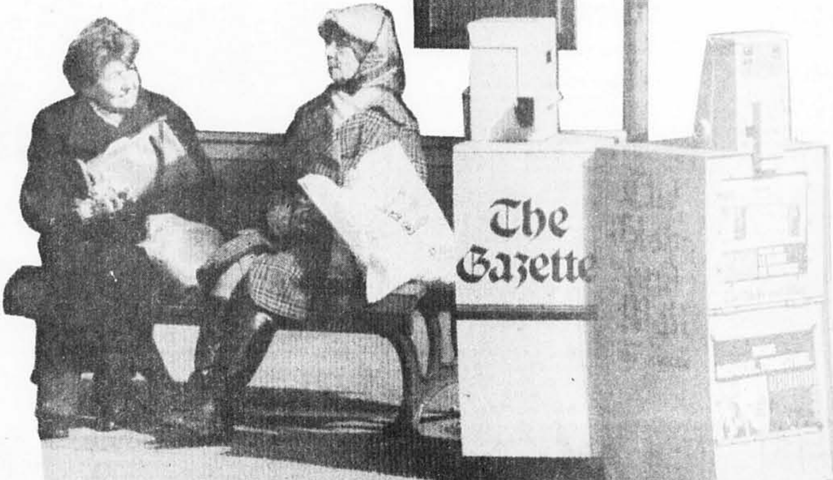
Le caractère francophone de Montréal n'est pas encore tellement évident à l'angle des rues Victoria et Sherbrooke.

Une espèce a pratiquement disparu, constate-t-elle: celle qui