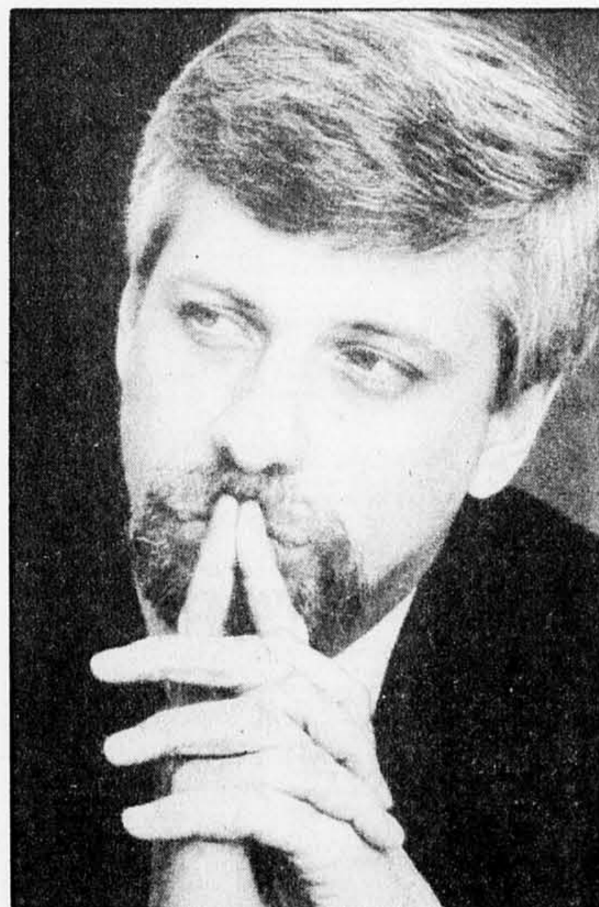
Pierre Marc Johnson

De tels exemples illustrent ce à quoi l'on est en droit de s'attendre de la part d'une opposition qui constituait le « gouvernement précédent ». Pour d'ex-ministres, la barre est placée plus haut que pour une op-