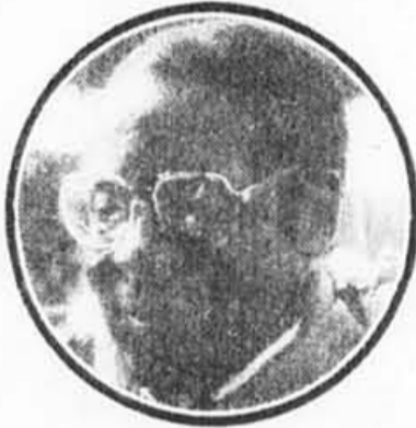
Robert Mugabe, le jour de ses 63 ans

Vulnérable, le Zimbabwe l'est face à l'apartheid, et la Zambie l'est davantage encore, comme le