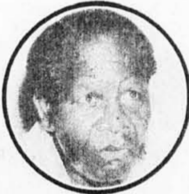
Oliver Tambo, président du Congrès national africain (ANC)