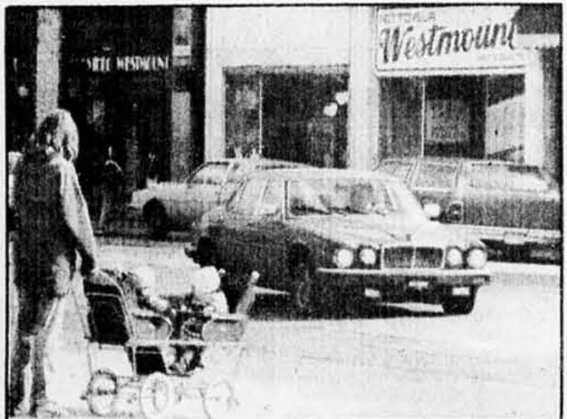
Un bout de rue de Westmount: un landau qui fait très britannique, une Jaguar qui ne cache pas ses origines et le nom Westmount bien en évidence.