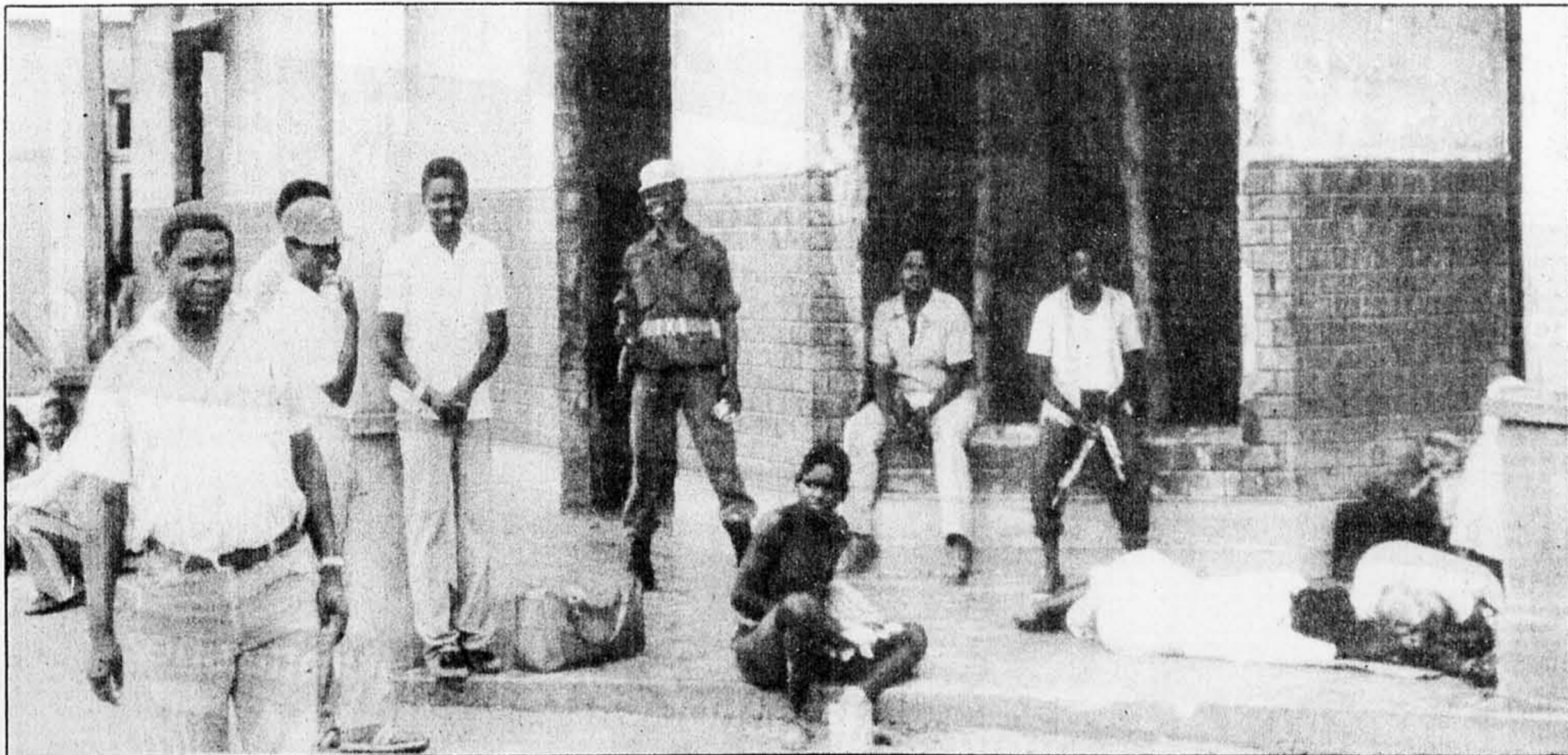
Dans le centre-ville de Zavala, province d'Inhambane, au Mozambique, pillé et incendié en 1983 par les « bandits armés ».

Botswana. Quant au Mozambique, sa survie tient au miracle face à la campagne de massacres, de destruction et de terreur entretenue par Pretoria. Et pourtant, ces pays résistent et ils en paient le prix: ils soutiennent le combat majoritaire des Sud-africains, ignorant les bantoustans, réduisant leur dépendance envers Pretoria et poursuivant un développement axé sur l'essor de la