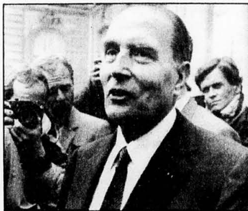
Le président François Mitterrand

Du coup, les divergences idéologiques et les débats théoriques pourtant dramatiques à une autre époque s'étaient volatilisés. Il y eut un temps où l'« orthodoxe » Laurent Fabius excommunait