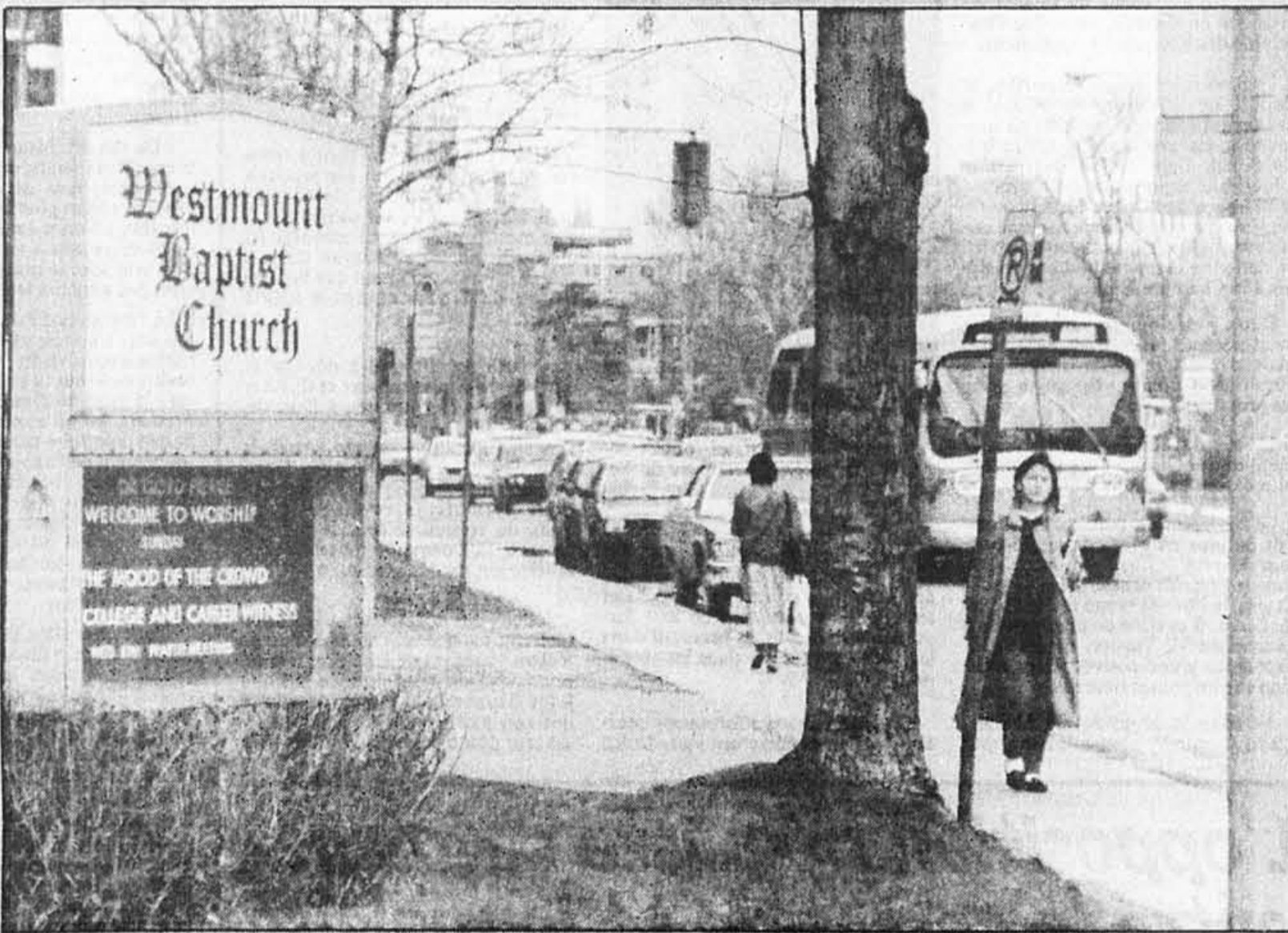
Dans leur majorité les Anglo-Québécois trouvent qu'il leur est possible de vivre complètement en anglais dans leur ville. En voici une preuve.

Quant au climat pour les affaires, on enregistre la même satisfaction générale. Soixante-et-dix-neuf p. cent des répondants le trouvent positif. On retrouve 27 p. cent des répondants pour considérer que le Québec est « très bon » pour faire des affaires actuellement. La majorité, 52 p. cent, le trouvent « assez bon ». Les pessimistes ne sont que 17 p. cent, soit 15 p. cent qui répondent « pas tellement bon » et 2 p. cent de pessimistes qui ne le trouvent « pas bon du tout ».