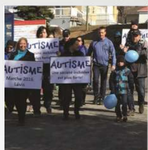
Marche de l'autisme Lévis, 24 avril