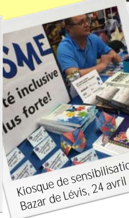
Kiosque de sensibilisation Bazar de Lévis, 24 avril