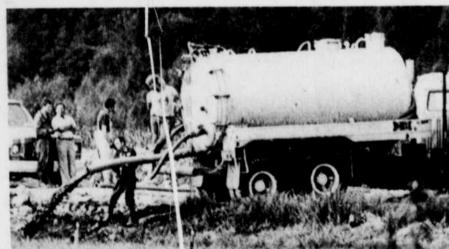
Des employés s'affairent à vider un étang pour vérifier s'il n'y aurait pas un autre corps