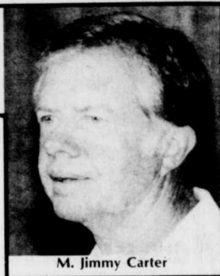
M. Jimmy Carter

"Je reconnais que la Chine est placée devant une menace possible venant du nord et du sud et nous ne tenons pas à créer une nouvelle menace venant de l'est, a-t-il dit. Il a toutefois ajouté que son administration avait clairement fait savoir, lors de l'établissement de relations diplomatiques entre les deux pays, que les Etats-