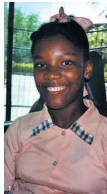
1 Jeune étudiante de l'IMD