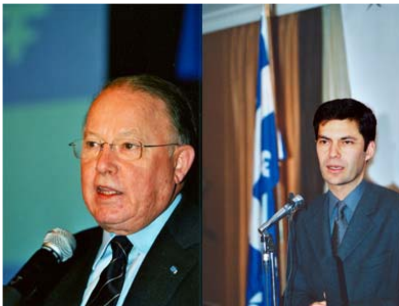
Bernard Landry et Mario Dumont

Les membres du Parti québécois choisiront un nouveau chef le 15 novembre. Le vote s'effectue par téléphone de dimanche à mardi à partir d'un système opéré par Quebecor. Environ 140,000 membres ont droit de vote. Assez étrangement le candidat favori au départ de la course, André Boisclair se retrouve presque perdant. La situation rappelle celle qu'avait vécue Mario Dumont, le chef du Parti de l'ADQ, qui était vu par les observateurs, quelques mois avant les dernières élections, comme