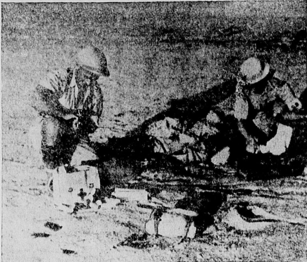
LES BLESSES BIEN SOIGNES SUR LE CHAMP DE BATAILLE. — Cette photo d'un blessé sur le front tunisien fut prise si près de la ligne de feu, que le photographe qui l'a saisie a été tué. Elle représente un blessé, à qui un médecin et son ordonnance sont à donner les soins requis. Le communiqué qui accompagnait l'original de la photo ajoute qu'une opération fut pratiquée à cet endroit même.