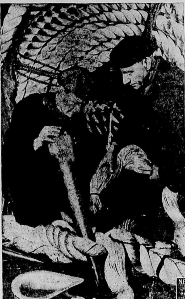
Des hommes de la Marine marchande sont à réparer une amarre.

SUFFISAMMENT DE CORDE POUR LES MOISSONS, MAIS PAS PLUS, LE SURPLUS EST CONSERVE POUR L'USAGE DE LA MARINE