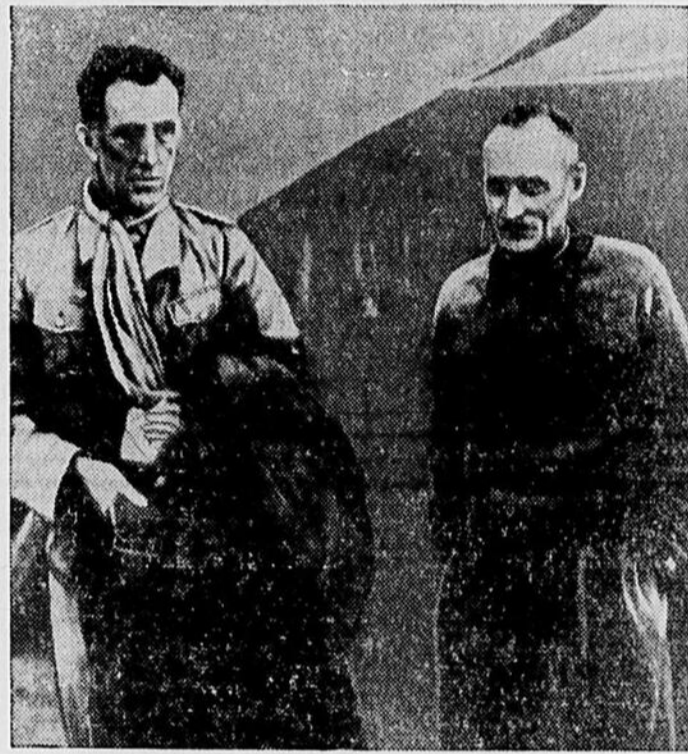
LE GENERAL MONTGOMERY ET SON PRISONNIER, LE GENERAL ALLEMAND VON THOMAS.—Pendant que l'armée de Rommel, en déroute, fuyait en désordre à travers l'Egypte et la Libye, cette photo fut prise aux quartiers-généraux du général Montgomery, commandant en chef de la 8e armée britannique. On voit à gauche le général allemand Von Thomas, qui fut capturé au cours de la débâcle et, à droite, le général Montgomery.

Pas besoin d'être prophète pour savoir que certains aspirants députés n'auront, dans cette élection complémentaire, qu'un succès partiel.