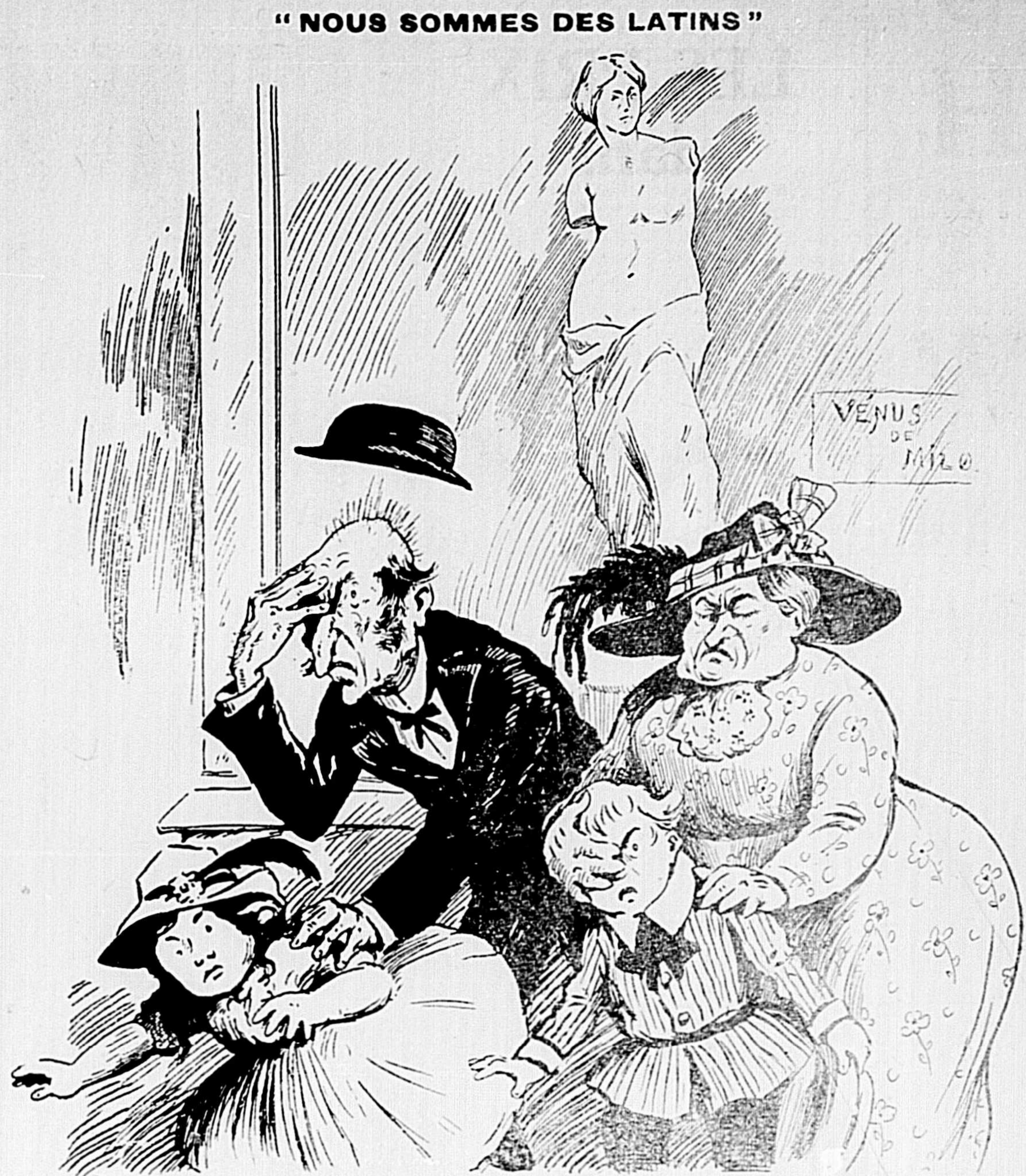
Comptes-tu, Parpétue, qu'ça prend du monde possédé pour mettre des écoeuranties comme ça dans leurs vitraux !