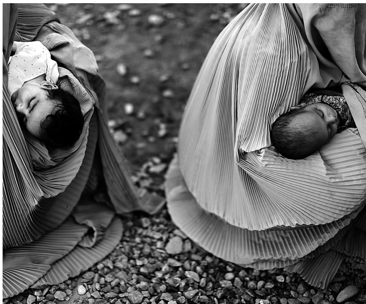
Des femmes pakistanaises, couvertes d'une burqa, fuient le nord-ouest du Pakistan avec leurs enfants. L'armée pakistanaise y mène depuis mercredi une offensive militaire contre les talibans pakistanais. Ces derniers ont violé les termes d'un pacte de paix signé avec le gouvernement central. Les tensions entre le groupe islamiste et l'armée ont entraîné le déplacement de près d'un million de personnes.

R La société civile est très inquiète de la perte de contrôle très rapide des autorités pakistanaises dans le nord-ouest du pays. Le Pakistan a la septième armée du monde. Comment peut-on expliquer que l'État ait dû signer un pacte avec un groupe de militants armés pour amener la paix dans le nord du pays ? Depuis deux ou trois jours, on voit qu'ils essaient de reprendre le contrôle grâce à des opérations militaires. Malheureusement, ça se fait dans la violence plutôt que la négociation. Les civils sont les premiers à payer le prix.