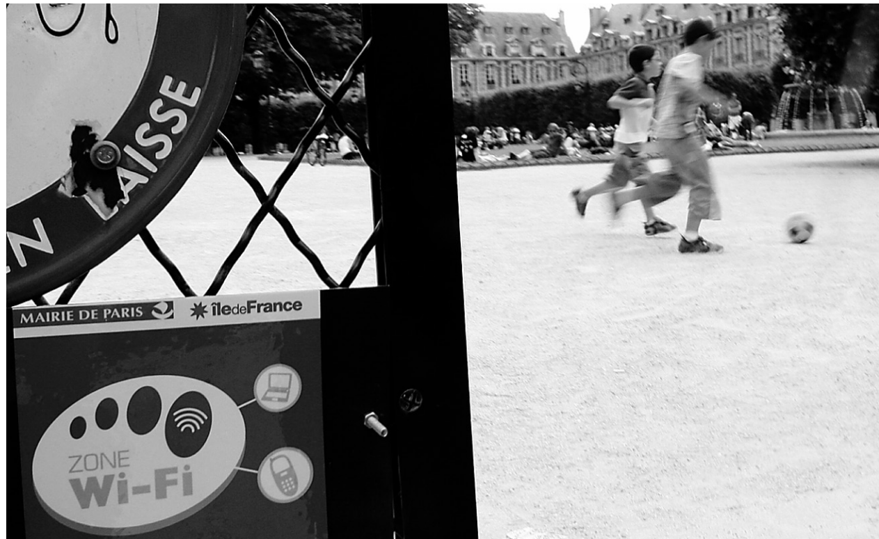
Des enfants jouent sur la place des Vosges à Paris. Au premier plan, une affiche indique que le parc est une zone d'internet sans fil. Une première ville dans le nord de Paris a interdit la diffusion Wi-Fi aux abords des écoles pour éviter d'éventuels ennuis de santé chez les enfants.

La Ville entend « cartographier » les antennes réparties sur son territoire de manière à mesurer le niveau d'exposition aux ondes électromagnétiques provenant des systèmes de télé-