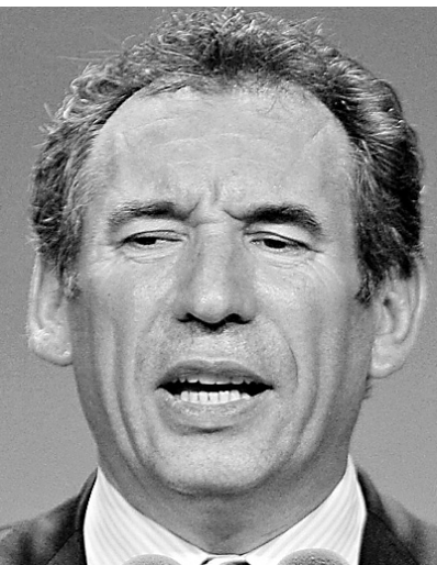
François Bayrou met la table pour la prochaine présidentielle.

M me Le Calvez pense que les opérateurs rechignent à réviser l'organisation de leur réseau pour éviter des coûts importants. « Ils font de gros bénéfices... La santé publique mérite bien quelques efforts », ironise-t-elle.