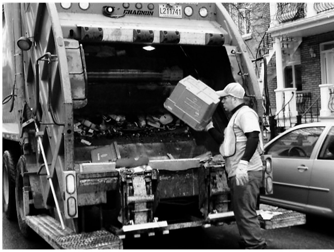
Plusieurs citoyens ont composé le 311, début avril, après avoir vu l'équipe de collecte lancer dans son camion, sans ménagement, l'ensemble de leurs matières recyclables ainsi que le bac qui les contenait.

L'équipe en cause ignorait-elle que les bacs sont réutilisables? Voyait-elle ces drôles de contenants