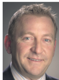
Homme d'affaires, l'auteur habite le Mexique depuis 2002.

C'est réussi, je ne fermerai pas l'œil de la nuit tellement je suis excédé par l'hystérie collective propagée par les médias de masse canadiens et américains relativement à la grippe porcine.