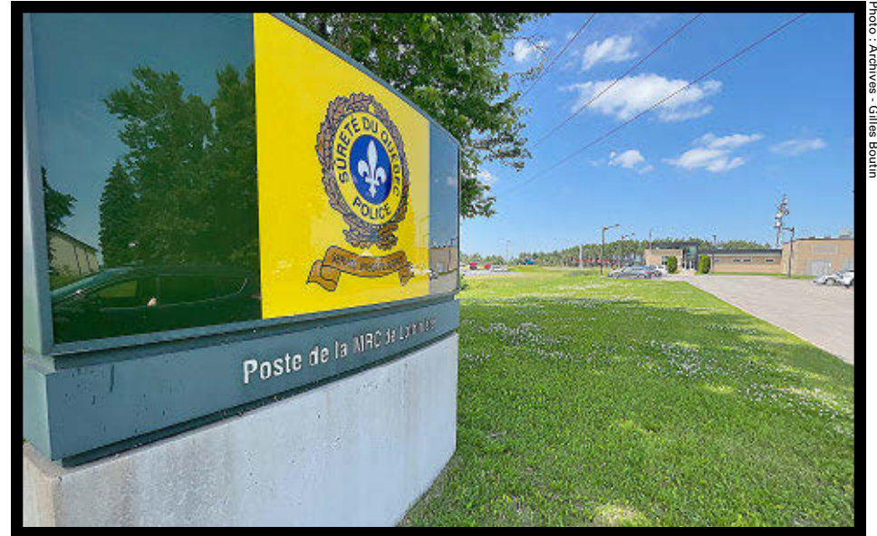
La Sûreté du Québec a tracé un sombre bilan routier des dernières vacances de la construction.

La Sûreté du Québec rappelle que les distractions au volant, le non-respect des limites de vitesse, la capacité de conduire affaiblie par la drogue, l'alcool ou la combinaison des deux ainsi que le non-port des équipements de sécurité expliquent la grande majorité des collisions graves et mortelles de cette année.