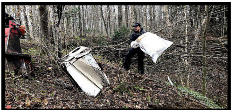
Des électroménagers ont été trouvés pendant ces opérations de nettoyage.

Électroménagers, métaux, plastiques, pneus, les objets hétéroclites que les bénévoles qui participent à la Caravane des berges ont récupérés sont nombreux. Cette initiative chapeauté par l'Organisme de bassins versants de la zone du Chêne (OVB du Chêne) vise à recueillir les déchets qui se trouvent dans ou à proximité des cours d'eau.