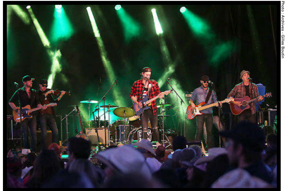
La production d'un festival et de ses spectacles engendre d'importants coûts.

Ce questionnaire, le maire, Yves Gingras, confirme l'avoir reçu de la part de certains citoyens. «Il y a beaucoup de monde qui va au Festival Western de Saint-Tite. Là-bas, il y a des crédits de taxes parce qu'il génère beaucoup de retombées. Nous ne sommes pas rendus là. C'est sûr qu'il faut donner de l'argent. C'est une jeune entreprise et un organisme à but non lucratif. Même la MRC