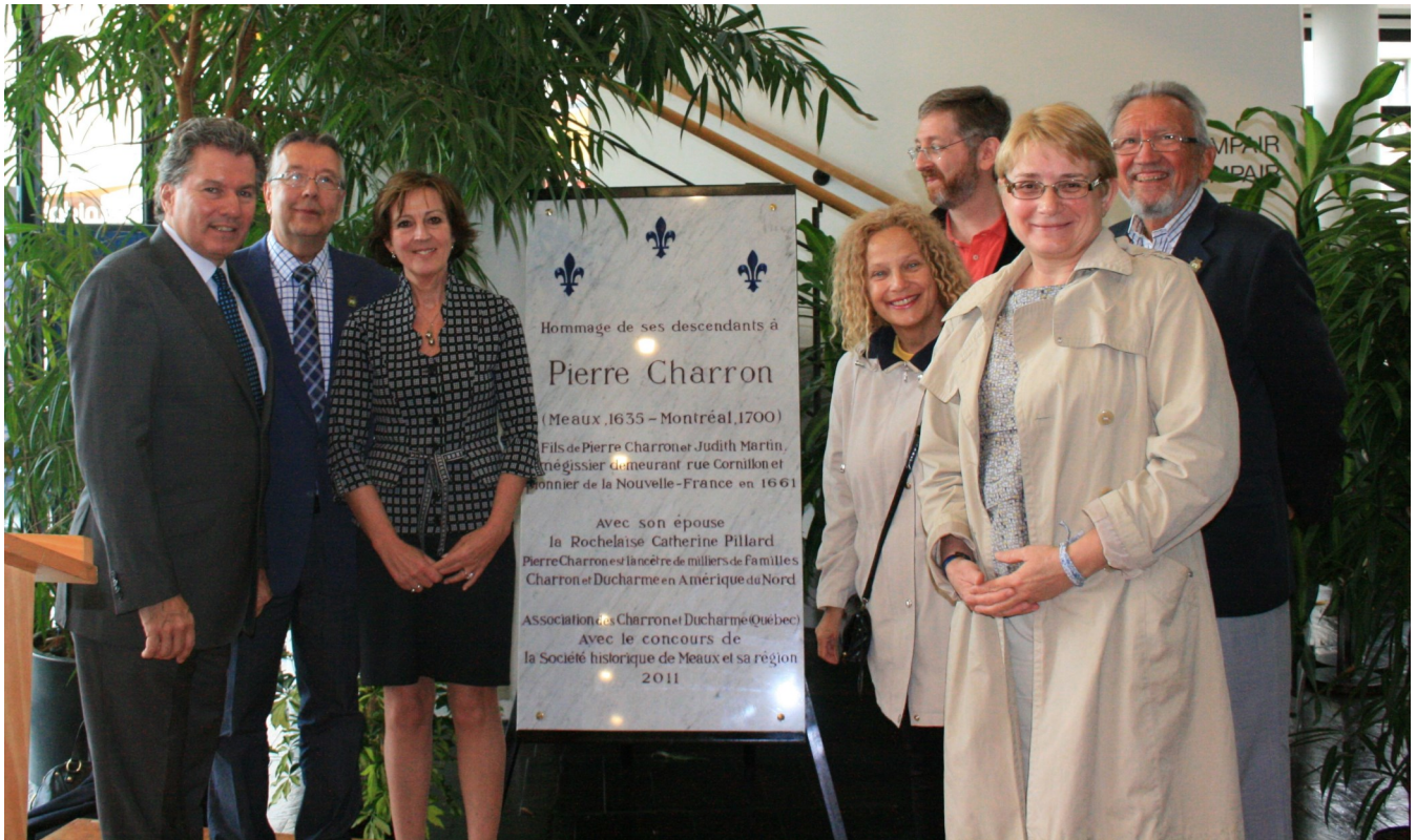
Photo prise le 17 septembre 2011 à Meaux lors du dévoilement de la plaque commémorative rendant hommage à notre ancêtre Pierre Charron.

Photo taken September 17, 2011 in Meaux (France) at the unveiling of the plaque paying tribute to our ancestor Pierre Charron.