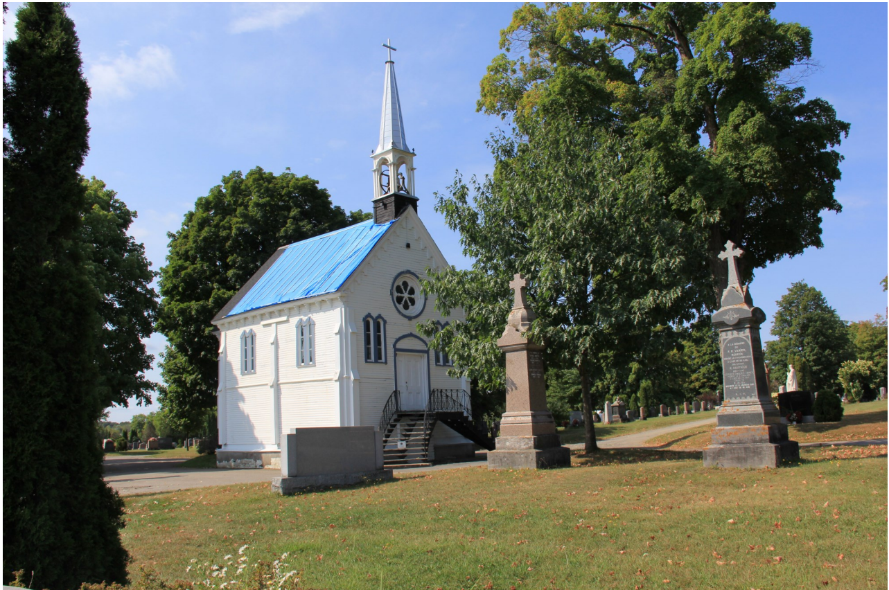
Chapelle du cimetière de Saint-Jérôme.