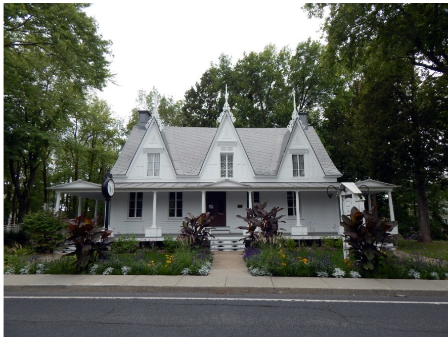
Maison Lenoblet-Du Plessis. Vue de l'autre côté de la rue devant le bâtiment