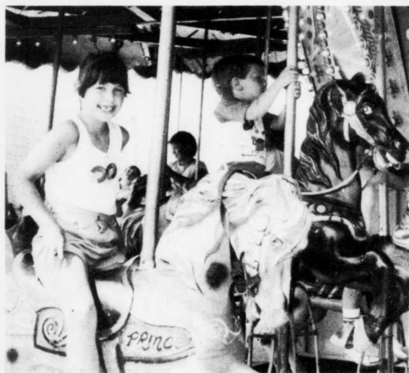
Les manèges étaient gratuits pendant une heure, hier matin, et les enfants n'ont pas laissé filer pareille occasion.

Selon certaines informations, les deux jeunes gens faisaient partie jusqu'à tout récemment de la force de réserve de l'Armée canadienne, à Sydney, en Nouvelle-Ecosse.