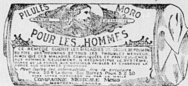
L'Étiquette est de papier blanc imprimé en bleu.

COMPAGNIE MEDICALE MORO, 1724, rue Ste-Catherine, Montréal.