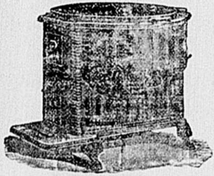
Bouilloires pour les Cultivateurs. Avec un rebord au Chaudron—Clef pour régler le feu—Retour pour la fumée—Fini avec de la peinture d'asphalte. Ces Bouilloires servent aussi pour les Bouchers et les Boulangers. Demandez nos catalogues et prix.

Un grand nombre de personnes sont sous l'impression que les coupons dans le "Rose Quesnel" et le "Champlain" ainsi que tous les coupons et tags des produits de la ROCK CITY TOBACCO Co. devront disparaître, à cause de la législation contre les timbres. Nous devons prévenir les fumeurs que cette loi n'affecte pas les coupons et les tags de la ROCK CITY TOBACCO Co. Nous allons continuer à donner des présents. Conservez les coupons ainsi que les tags sur les tabacs et torquettes.