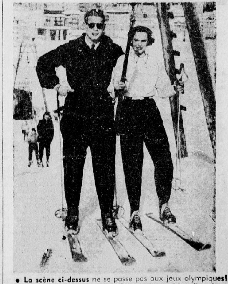
La scène ci-dessus ne se passe pas aux jeux olympiques! Il s'agit de l'ex-roi Michel de Roumanie, et de sa fiancée la princesse Anne de Bourbon-Parme, faisant du ski à Davos, Suisse.

Le Canada saura, le 15 avril, s'il lui faudra modifier ses plans de canalisation du St-Laurent.