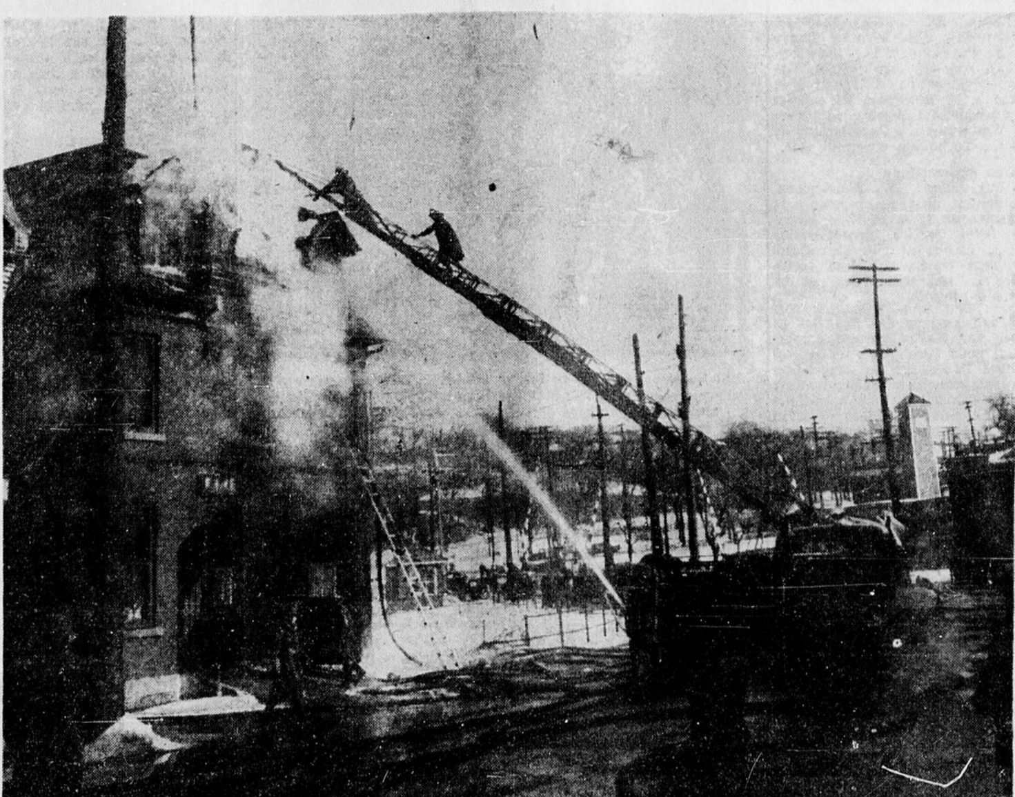
Un incendie a complètement détruit la caserne historique no 1 des pompiers d'Ottawa, située sur la rue Duke, à midi, aujourd'hui. La caserne qui fut construite en 1853 était évaluée à près de $4,000 et devait être démolie sous peu.

Ce désastre suivait un incendie qui a rasé six édifices, le jour précédent.