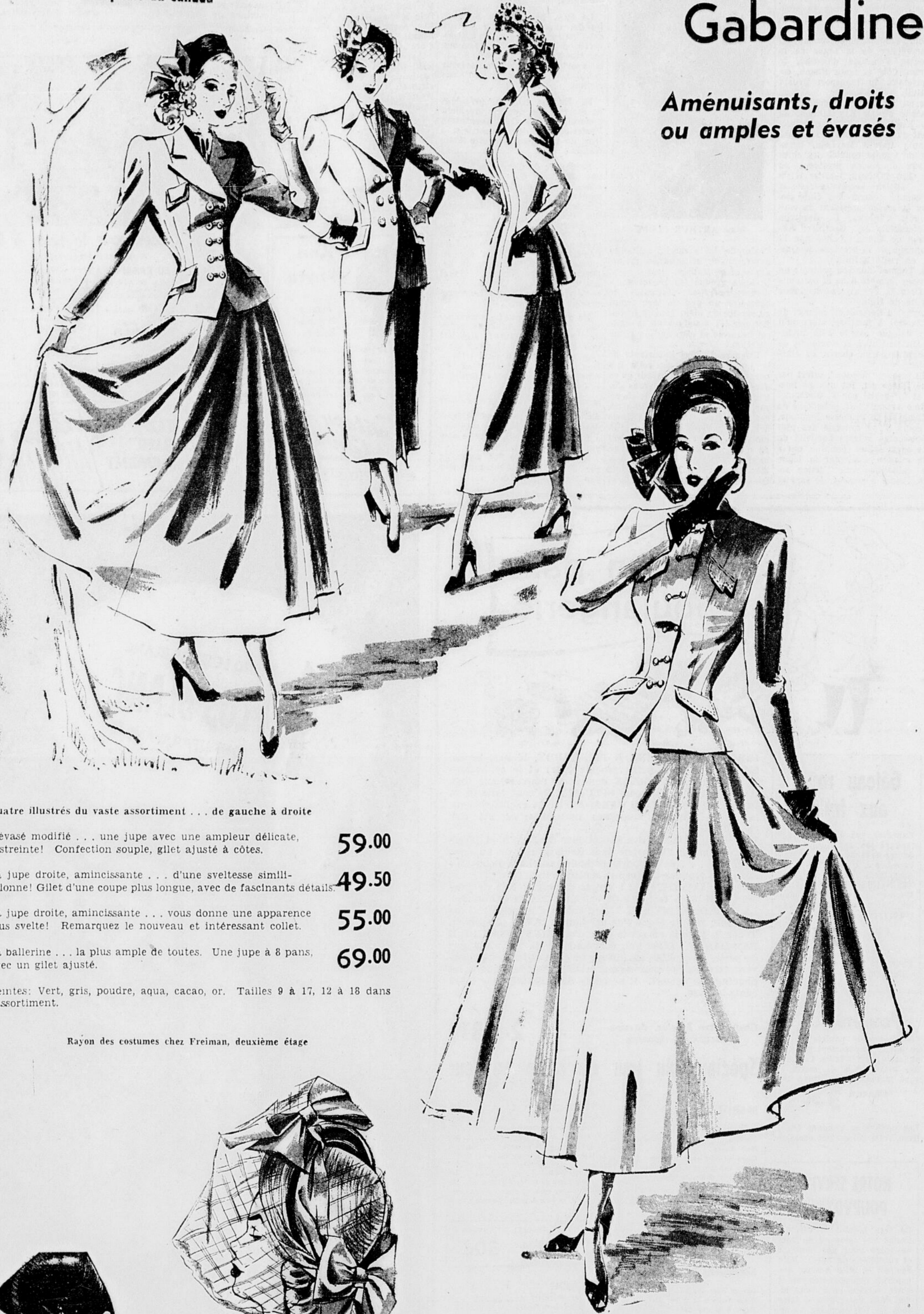
Quatre illustrés du vaste assortiment... de gauche à droite