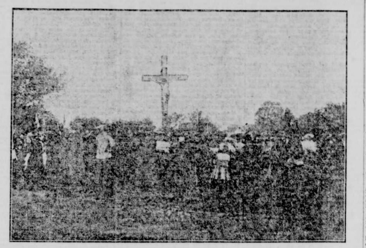
BENEDICTION DE LA CROIX SUR LE SITE QU'OCCUPERA L'ÉGLISE SAINT-VIAEUR D'OUTREMONT.

On marque l'emplacement de l'église catholique dont la construction commencera cet automne.