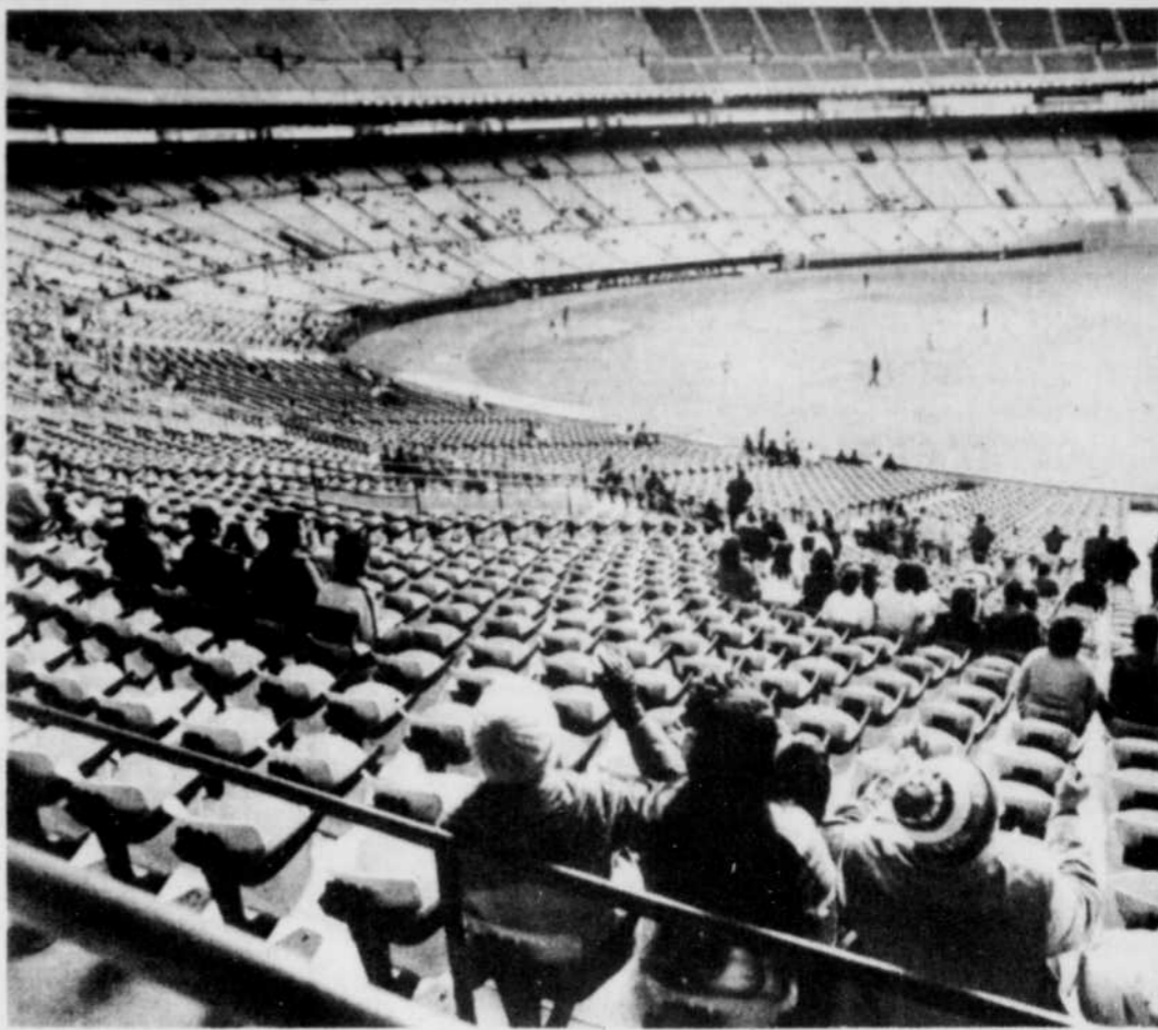
Faisait pas chaud dans le Stade hier, compensés, car ils ont pu voir une des Seulement 2,803 fans courageux s'y rares victoires des "Amours". étaient "entassés". Ils ont été bien ré-