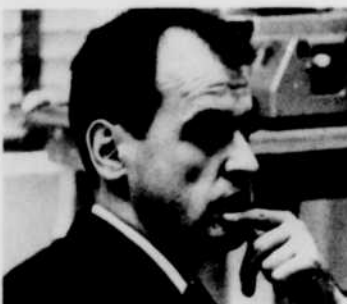
Le Frère Untel

Gérard Pelletier constatait avec tristesse «une rupture» de la population canadienne-française, «inscrite dans les faits de notre unité religieuse» et du fait même de cette rupture que le Québec «marchait vers le vide spirituel et la religiosité sans vigueur d'un certain protestantisme nord-américain». L'unité de foi qui existait jusqu'alors «ne régnait plus». Il y avait deux groupes. Un groupe de croyants, un groupe d'incroyants. L'unanimité religieuse était morte. C'était Feu l'unanimité .