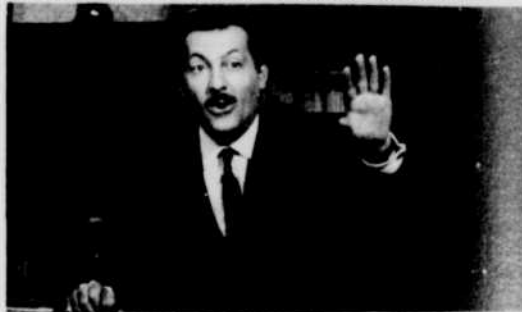
Serrault, flatteur comme le renard.