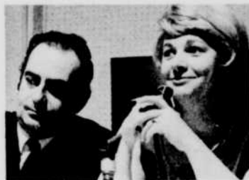
Guy Provost et Lise Payette