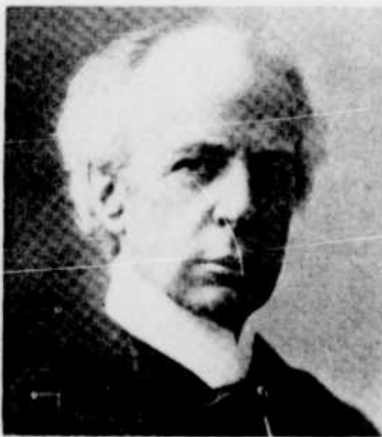
Sir Wilfrid Laurier

Nous nous permettons de rappeler brièvement ici la carrière du premier Québécois à devenir premier ministre du Canada. Né à Saint-Lin-des-Laurentides, en 1841, Wilfrid Laurier fit d'abord ses études de droit et devint avocat. Le début de sa vie politique remonte à 1871, lorsqu'il fut élu député de Drummond-Arthabaska à l'Assemblée législative du Québec. De 1874 à 1877, il représenta ce même comté à Ottawa. Puis, de 1877 à 1919 (année de sa mort), il fut député de Québec-Est à la Chambre des Communes du Canada. Sir Wilfrid fut ensuite ministre du Revenu dans le cabinet MacKenzie, leader de l'opposition aux Communes, chef du parti libéral canadien, président du Conseil et, enfin, premier ministre du Canada. Orateur de grande classe, Laurier a laissé le souvenir d'un éminent Canadien.