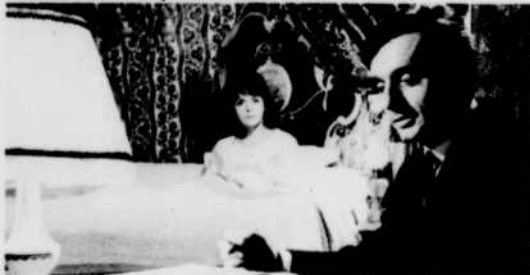
Les problèmes quotidiens.

La télévision de Radio-Canada présente, le samedi soir, deux séries filmées qui ont déjà fait notre joie il y a deux ans.