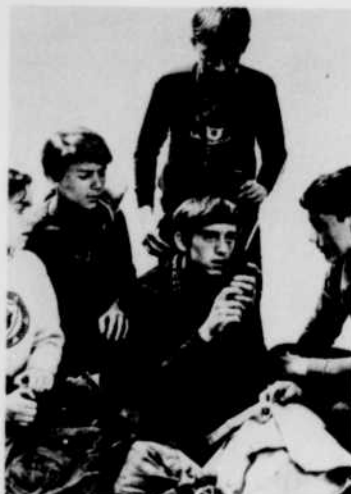
LES CADETS DE LA FORÊT vivent pour les jeunes de passionnantes aventures, télévisées en couleur chaque mardi après-midi à 5 heures.

* 5.00—LES CADETS DE LA FORÊT Une compagnie d'exploitation forestière veut raser le fort des cadets pour tracer une route vers la nouvelle église.