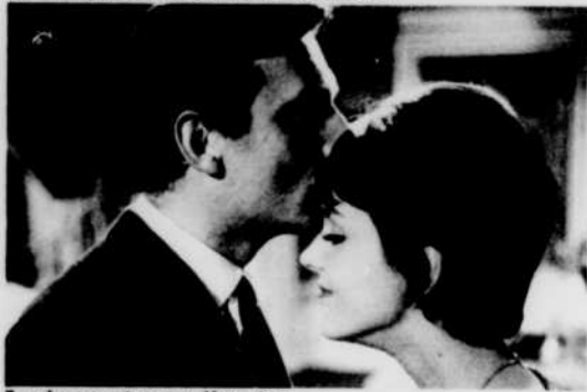
Tendresse et compréhension.