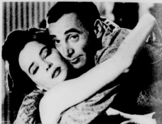
Les deux «pigeons»: Leslie Caron et Charles Aznavour.