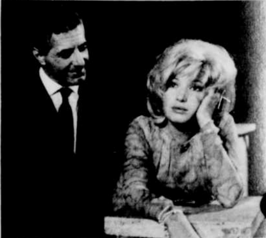
Monica Vitti ne semble pas pressée...