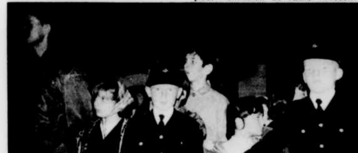
Deux jeunes brigadiers des Ambulanciers Saint-Jean protègent Bobino de la foule de ses admirateurs, accourus nombreux au Salon du sportsman.