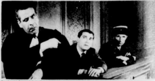
Poiret le crédule.