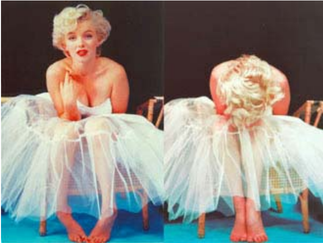
Marilyn Monroe

L'actrice de cinéma Marilyn Monroe était avant tout un modèle pour les photographes. Elle savait communiquer avec la caméra et certains photographes ont même dit que Marilyn semblait parler avec l'appareil photo. Un film magnifique, « The Photographers of Marilyn Monroe » réalisé en 2006 pour le réseau PBS , et présenté dans le cadre du Festival International des film sur l'art à Montréal a très clairement démontré les qualités photogéniques de Marilyn Monroe. On peut voir un résumé du film sur le site internet de PBS. Pour des photos exclusives, l'un des meilleurs sites demeure celui de Milton Greene un ami et associé de Marilyn.