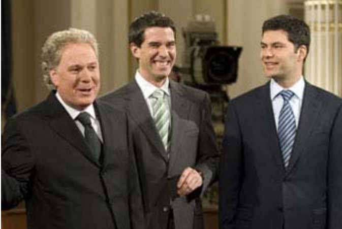
Jean Charest, André Boicclair et Mario Dumont