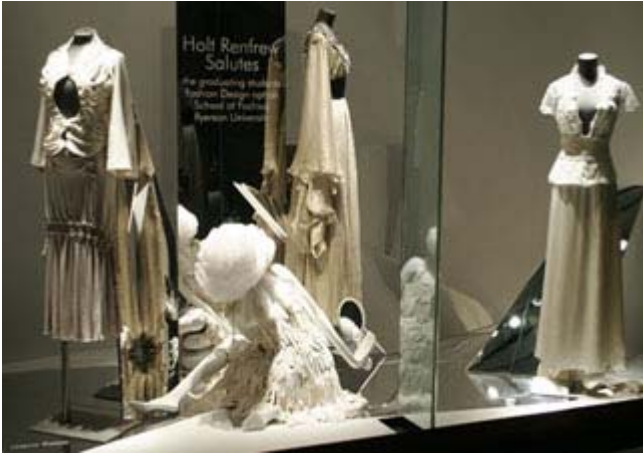
Vitrine Holt Renfrew

La Semaine de mode de Montréal se déroule jusqu'au 23 mars prochain et malgré les difficultés que connaît ce secteur sur le plan économique, l'édition 2007 est supporté par des commanditaires importants dont Holt Renfrew qui a accepté de se joindre officiellement à l'événement. En tout, on compte une vingtaine de créateurs qui présenteront leur collection au Théâtre Imperial de la rue Bleury. La Semaine de mode se veut un lien direct entre les acheteurs et les créateurs. Les représentants de plusieurs revendeurs de partout dans le monde viennent à Montréal spécialement pour l'occasion.