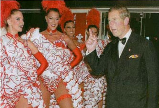
Le Prince Charles

Le Prince Charles croit qu'il faut cesser de manger « McDonalds »! Son peuple est cependant en complet désaccord et la récente suggestion du Prince que l'on devrait bannir McDonalds a été reçue par des critiques et des moqueries de la part du public. Selon les dirigeants de McDonalds, la réaction démontre clairement que la compagnie réussit à convaincre les consommateurs que son menu est de plus en plus santé! Vive Ronald! Pour les amateurs d'aliments santé de Montréal et Québec, mentionnons l'exposition Manger Santé 2007 qui se déroule présentement dans les centres de congrès de ces deux villes. www.expomangersante.com www.mcdonalds.ca