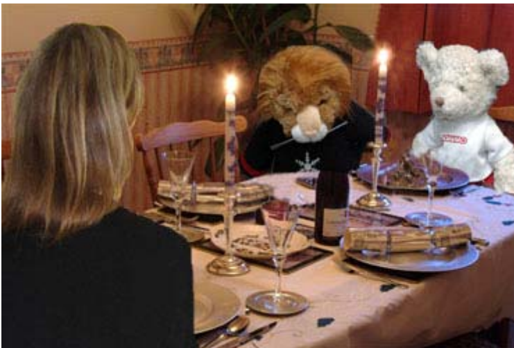
mademoiselle X et les deux mascottes, Monsieur X et sa soeur Miss Gym dans une petite auberge en banlieue de Paris.