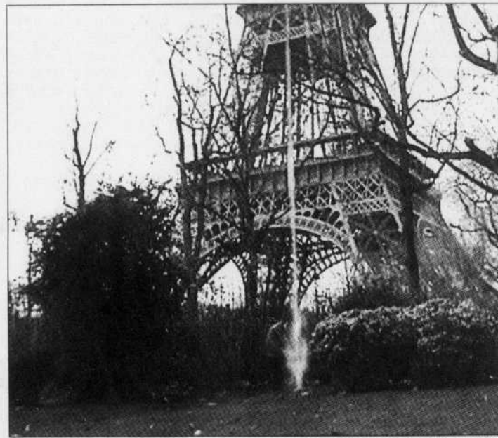
Arrêt sur l'image de la vidéo de Michel de Broin, Réparations: une participation volontaire à la propreté de la ville de Paris (2004)