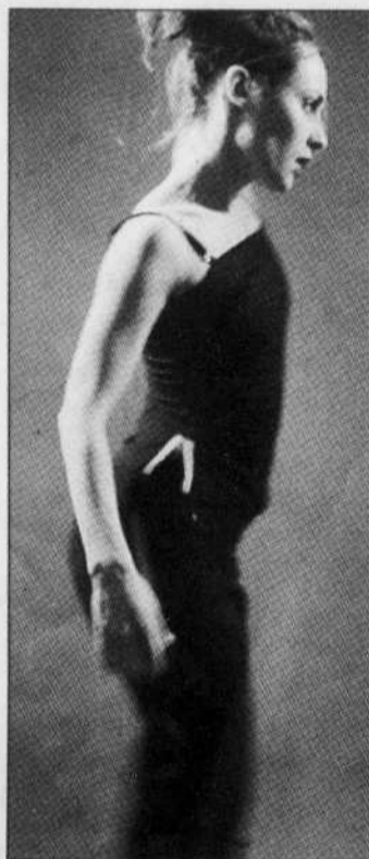
FESTIVAL DES ARTS DE SAINT-SAUVEUR Rubberbandance Group