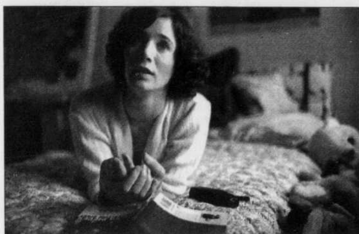
Me and You... met en scène une dizaine de personnages, la plupart seuls, la plupart désireux de ne plus l'être.

Si elle en est consciente, elle vient aussi, dans le bain de foule