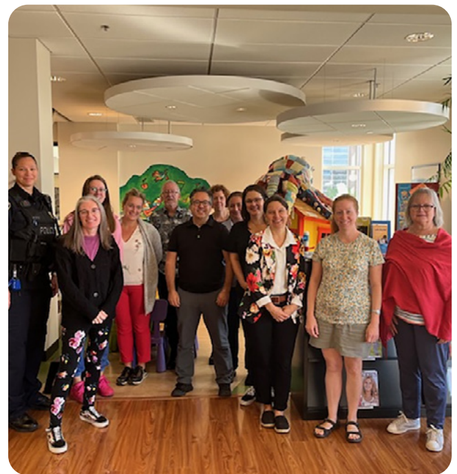
Quelques uns des membres du comité de pilotage.