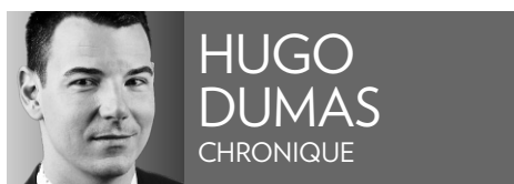
HUGO DUMAS CHRONIQUE

On ne gave plus les animaux, m'a écrit un lecteur courroucé ce week-end, alors pourquoi encourager les lecteurs à se bourrer de séries télé jusqu'à l'écoeurement?