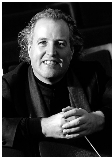
Le chef d'orchestre Manfred Honeck

À notre demande, Lanaudière nous communique les chiffres officiels d'assistance aux deux