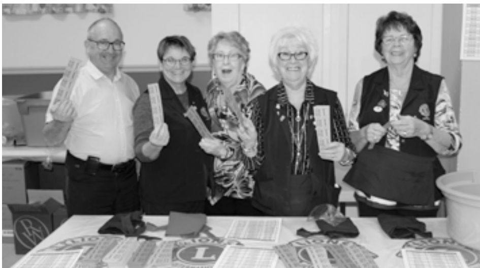
De dynamiques bénévoles en charge des billets.

LA SOCIÉTÉ D'HISTOIRE DE COMPTON PRÉSENTE LA CONFÉRENCE