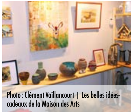
Les belles idées-cadeaux de la Maison des Arts

suggestions gourmets ou pratiques pour leurs cadeaux de Noël ou... leur propre plaisir. Les plus gourmands pouvaient ensuite traverser la rue et profiter des gourmandises à boire ou à manger au barbecue du Marché Tradition.