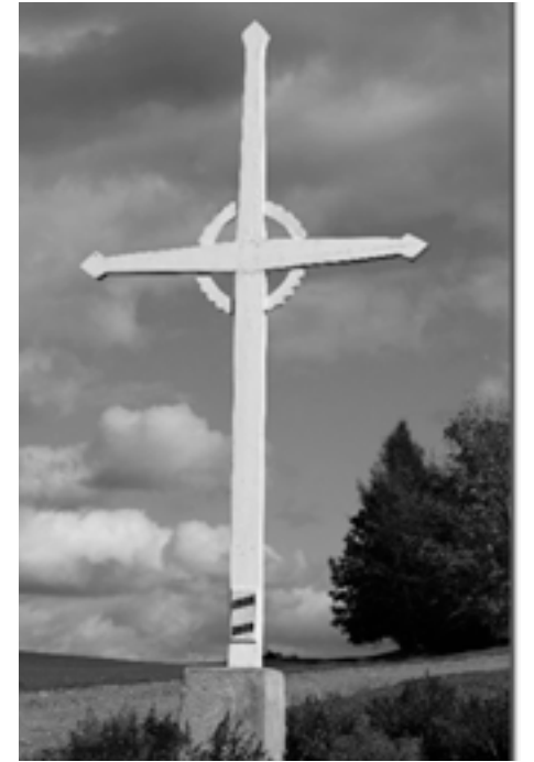
Croix de chemin Audet chemin Hyatt's Mills, Compton

Pour information : jmlachance1@videotron.ca