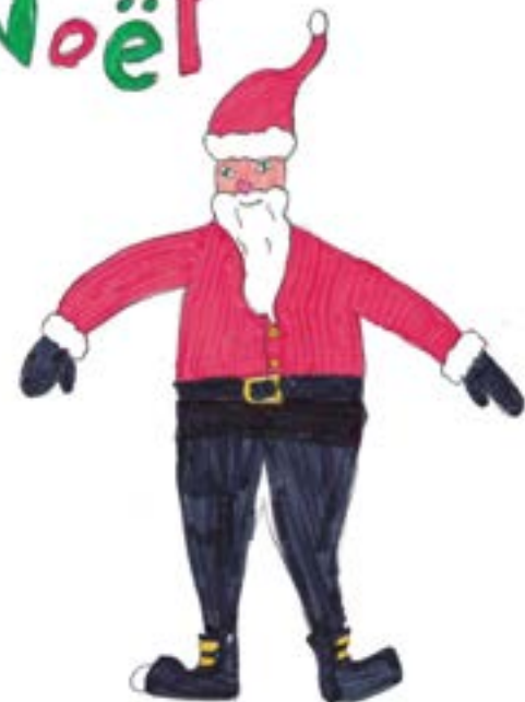
Zack Coulombe, 11 ans