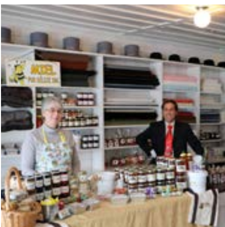
Le lieu historique St-Laurent est redevenu un magasin général le temps de ce week-end.

Le magasin général du lieu historique national Louis-S.-St-Laurent a aussi pu reprendre son ancienne vocation, le temps de ce week-end. Accueillant près d'une dizaine de commerçants, les passants avaient d'irrésistibles