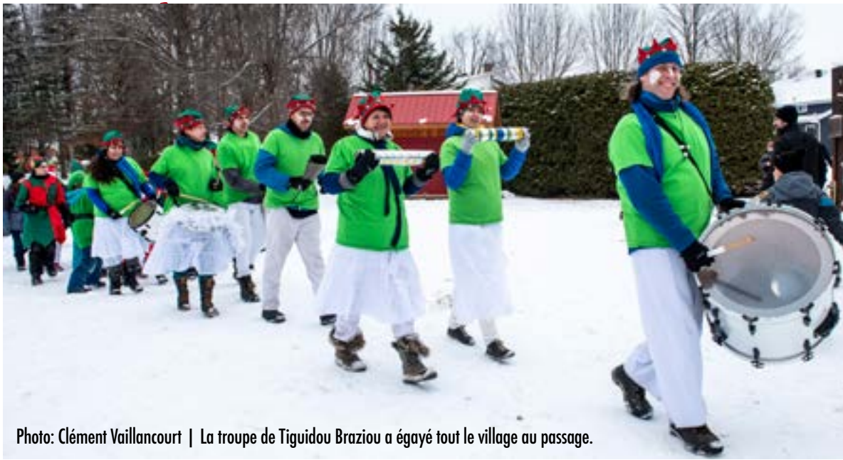
La troupe de Tigidou Braziou a égayé tout le village au passage.