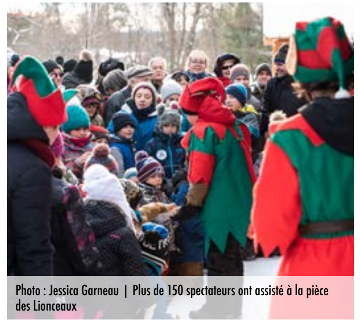
Plus de 150 spectateurs ont assisté à la pièce des Lionceaux