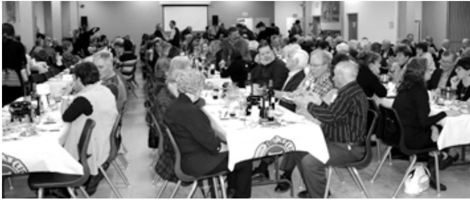
Ce sont plus de 300 invités qui se sont attablés au Souper Fondue .