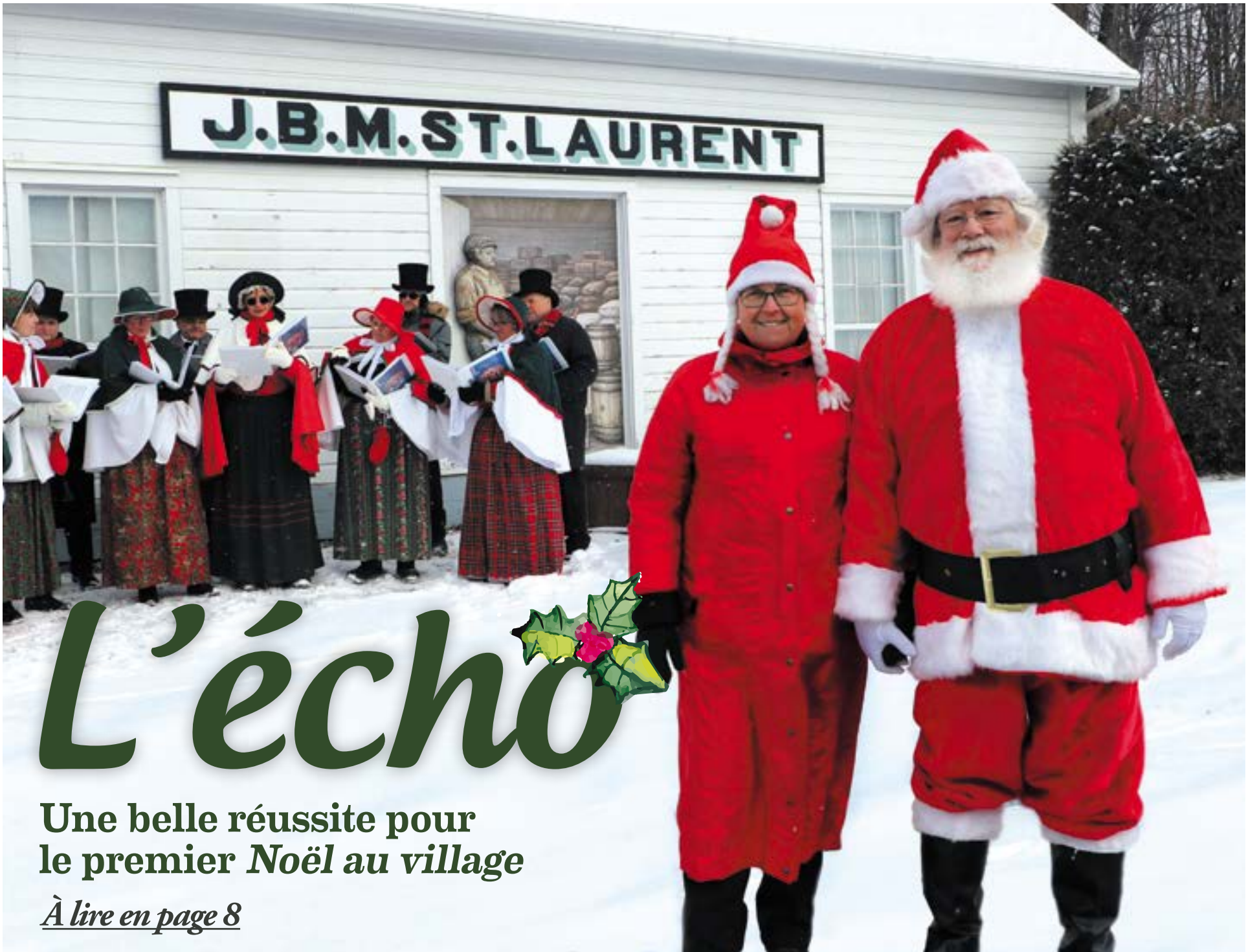
Père Noël et Mère Noël...