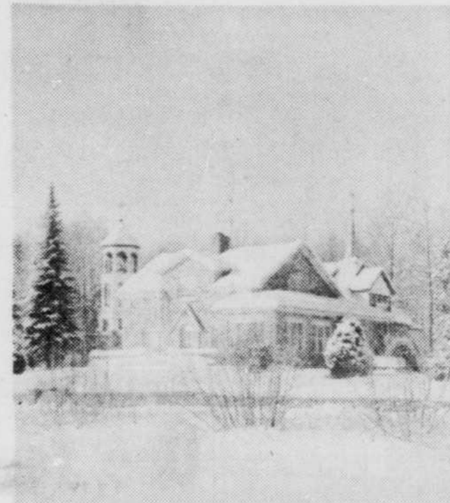
N'est-ce pas merveilleux: le camp Claret du lac Elgin, dirigé par les pères Claretains de Victoriaville, vu du lac