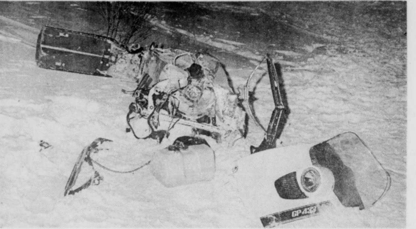
Une autre femme, la deuxième en autant de fins de semaines a perdu la vie dans un accident impliquant une motoneige et un train du CN, dans la région de Drum-