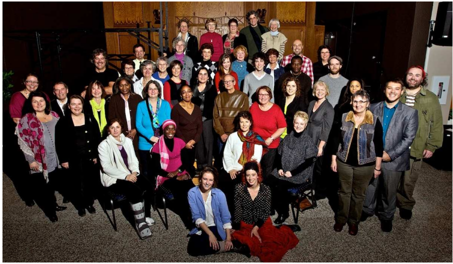
Le groupe des «Écrivains» ayant assisté à la représentation de La Grande Cueillette des mots le mardi 22 novembre 2011 à la salle du Parvis (en compagnie de l'équipe de la CDEC de Sherbrooke et de celle du Théâtre des Petites Lanternes).

Qu'en est-il de l'innovation sociale chez nous ?