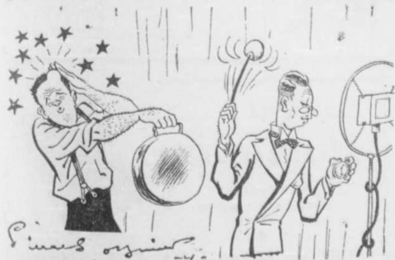
(Speaker distrait...) "... au coup de gong il était exactement..."