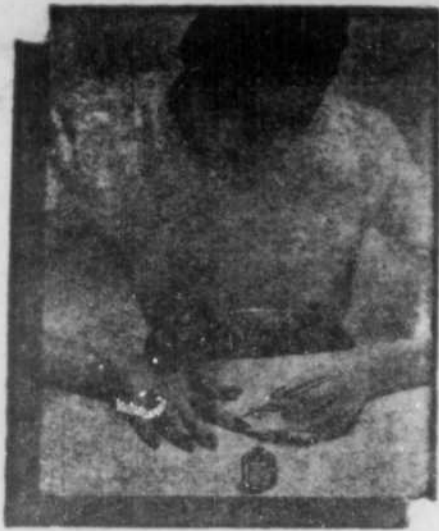
Votre main gauche devient aussi habile que la droite avec cette plume exclusive.