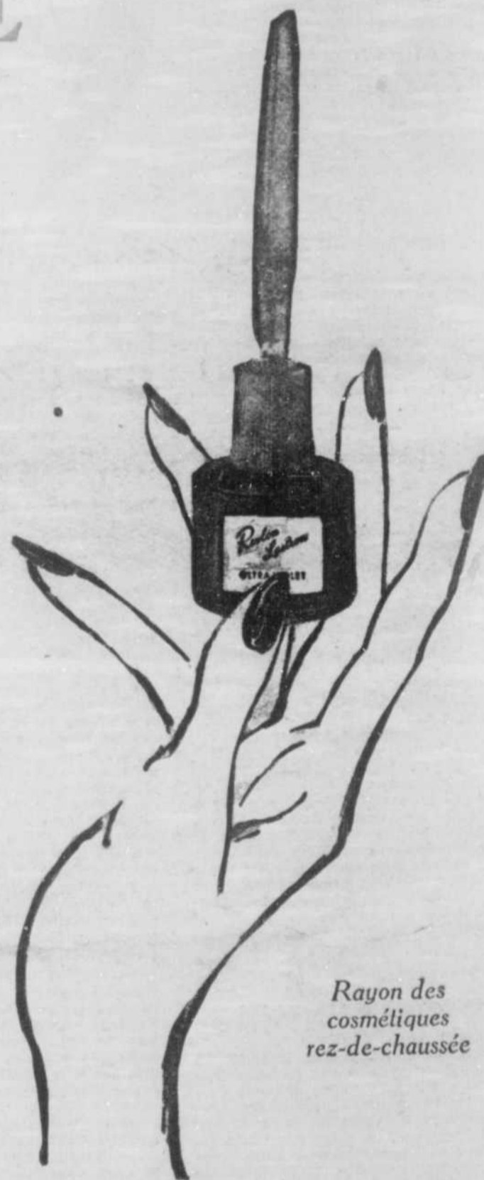
Rayon des cosmétiques rez-de-chaussée