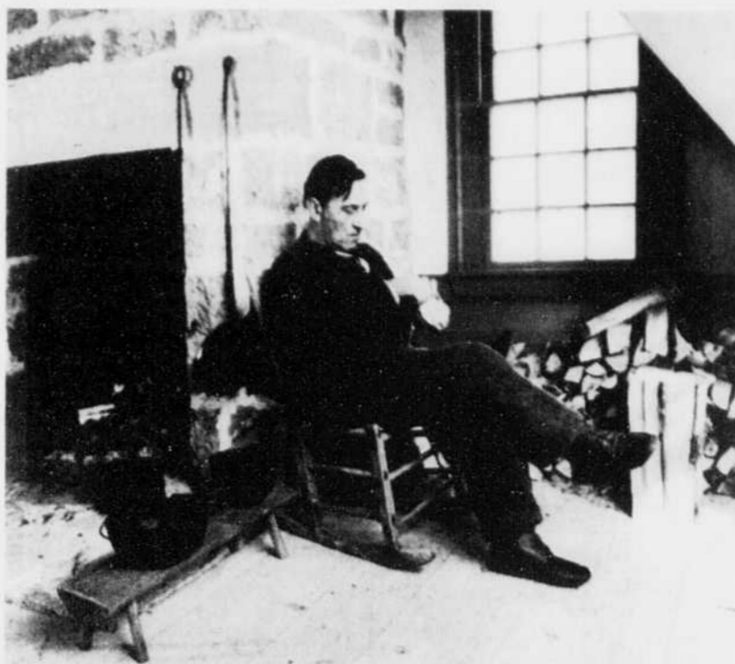
À environ 10 kilomètres de Caraquet se trouve le Village historique acadien, immense complexe qui recrée la vie quotidienne telle qu'on la connaissait de 1780 à 1890.

bureau de tourisme de la ville), mais les touristes sont également dirigés vers le Centre d'interprétation des mines et minerais du Nouveau-Brunswick, dans la municipalité voisine de Petit Rocher.