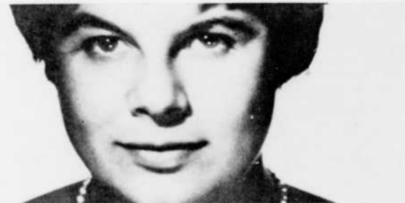
Irmgard Seefried, soprano, à l'émission "Concert"