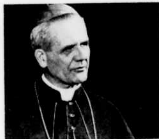
Son Eminence le cardinal Léger à l'émission "A l'heure du Concile".

5.00—A l'heure du Concile Invité: le cardinal Paul-Émile Léger. Sujet: la troisième session du Concile.