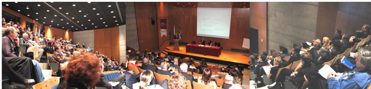
Colloque du 15 octobre 2008 à l'ENAP

Les participants ont exprimé une grande satisfaction à l'égard du thème de la présentation, de la qualité des panélistes et de l'animateur.