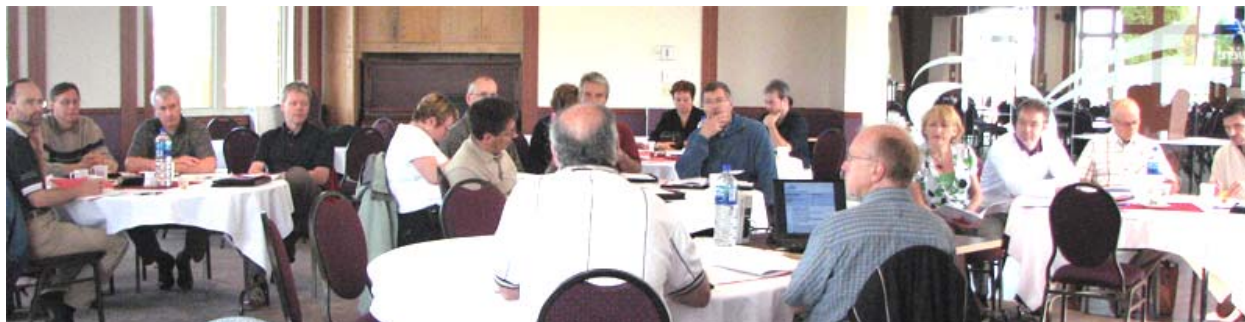
Assemblée annuelle des membres

Les membres ont eu aussi l'occasion de visionner, également en primeur, un document audiovisuel sur la relève produit par le comité sur la relève et un réalisateur professionnel.