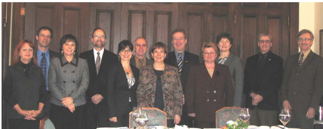
Commission de la gestion des ressources humaines en TI