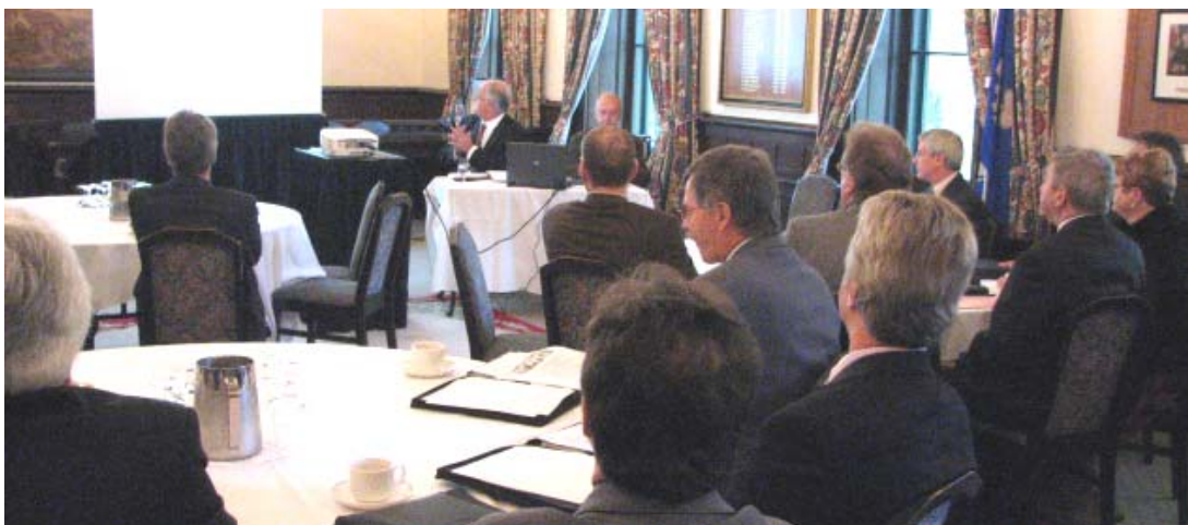
Membres en assemblée

Encore cette année, la majorité des assemblées ont été consacrées principalement aux dossiers liés à la mise en œuvre des services partagés et du Bureau de la dirigeante principale de l'information. La première partie des réunions a consisté à présenter un résumé des dossiers menés par le comité exécutif et les commissions, à faire état des réalisations du mois précédent en matière de diffusion de l'information et à exposer la situation concernant les relations avec les membres de Montréal. En deuxième partie, des invités ont entretenu les membres sur un sujet pertinent au moment opportun. Leurs présentations sont incluses sur le cédérom du présent rapport annuel.