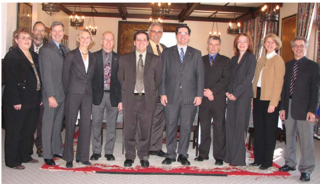
Commission de la gestion des ressources informationnelles I