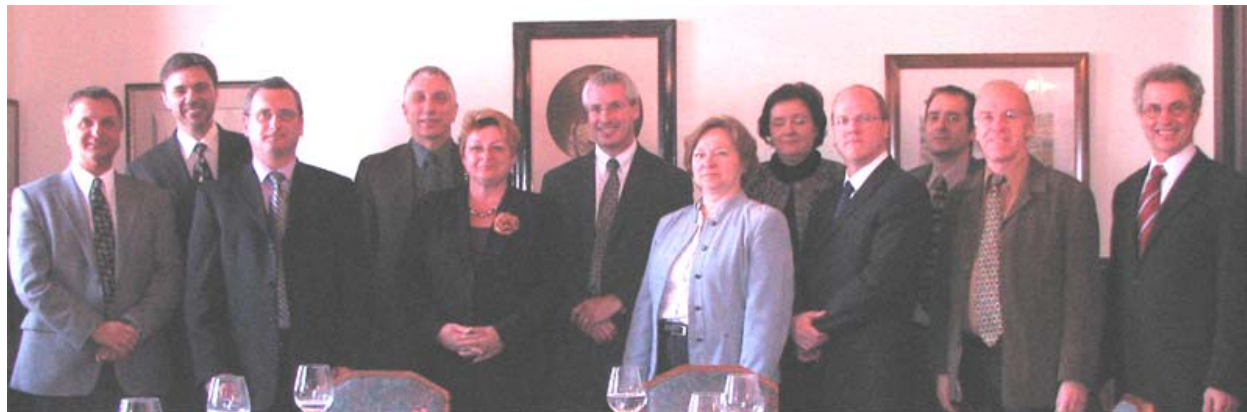
Commission de la gestion des ressources informationnelles II