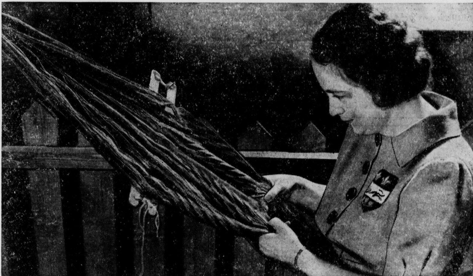
Le tissage de la ceinture fléchée traditionnelle