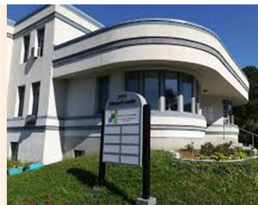
Façade du bâtiment de l'Église au 1775, boul. Édouard-Laurin, St-Laurent, H4L 2B9.

Ma prière est que Dieu nous assiste pour continuer à dialoguer dans le respect et la prise en considération de toutes les cultures s'influçant l'une l'autre en vue d'une intégration harmonieuse. Mon identité première est celle d'enfant de Dieu. Je suis d'abord et avant tout citoyen des cieux. Mais Dieu a aussi créé cette nation québécoise et aujourd'hui, je dis merci au Seigneur et je lui demande de m'aider à l'aimer davantage! ☐