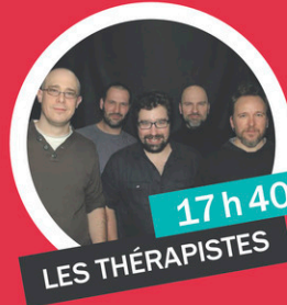
17h40 LES THÉRAPISTES