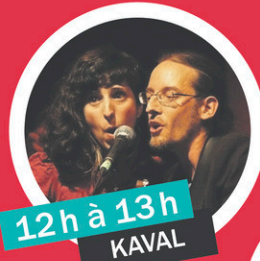
12h à 13h KAVAL