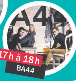
17h à 18h BA44