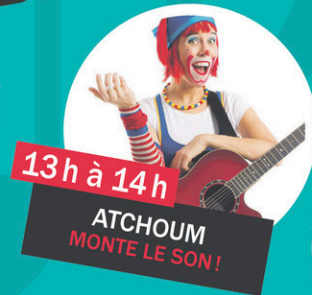
13h à 14h ATCHOUM MONTE LE SON!