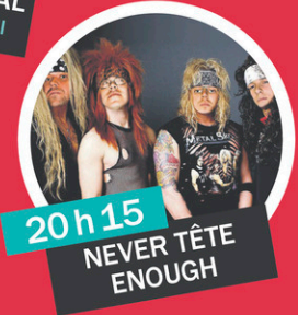
20h15 NEVER TÊTE ENOUGH