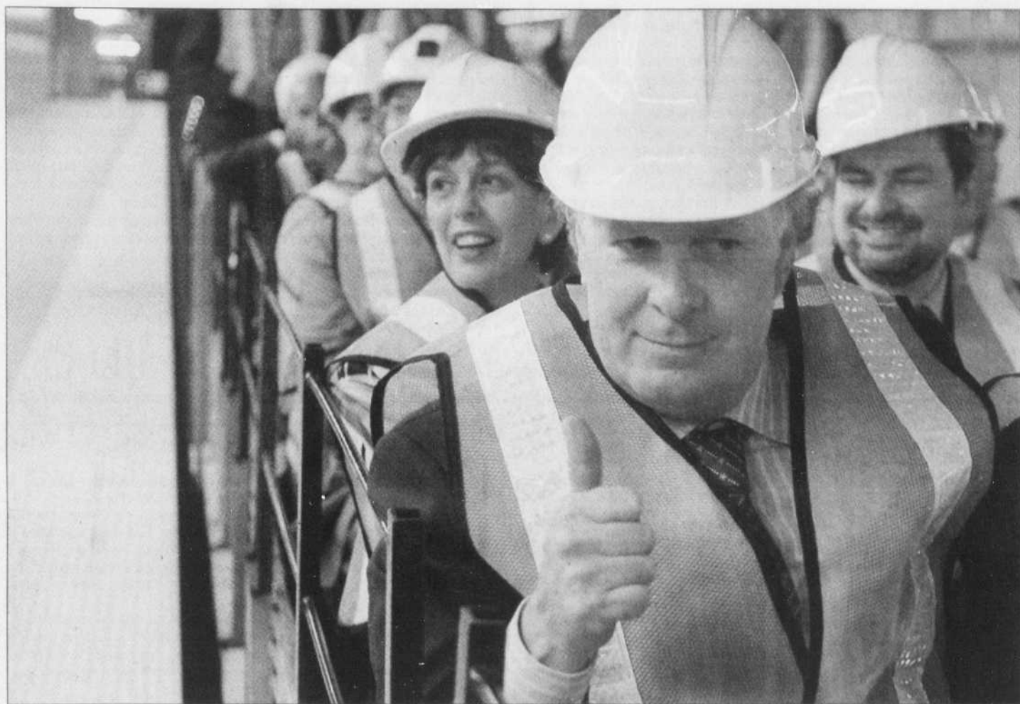
Jean Charest et plusieurs de ses ministres ont parcouru hier les nouvelles stations de métro présentement en construction à Laval.