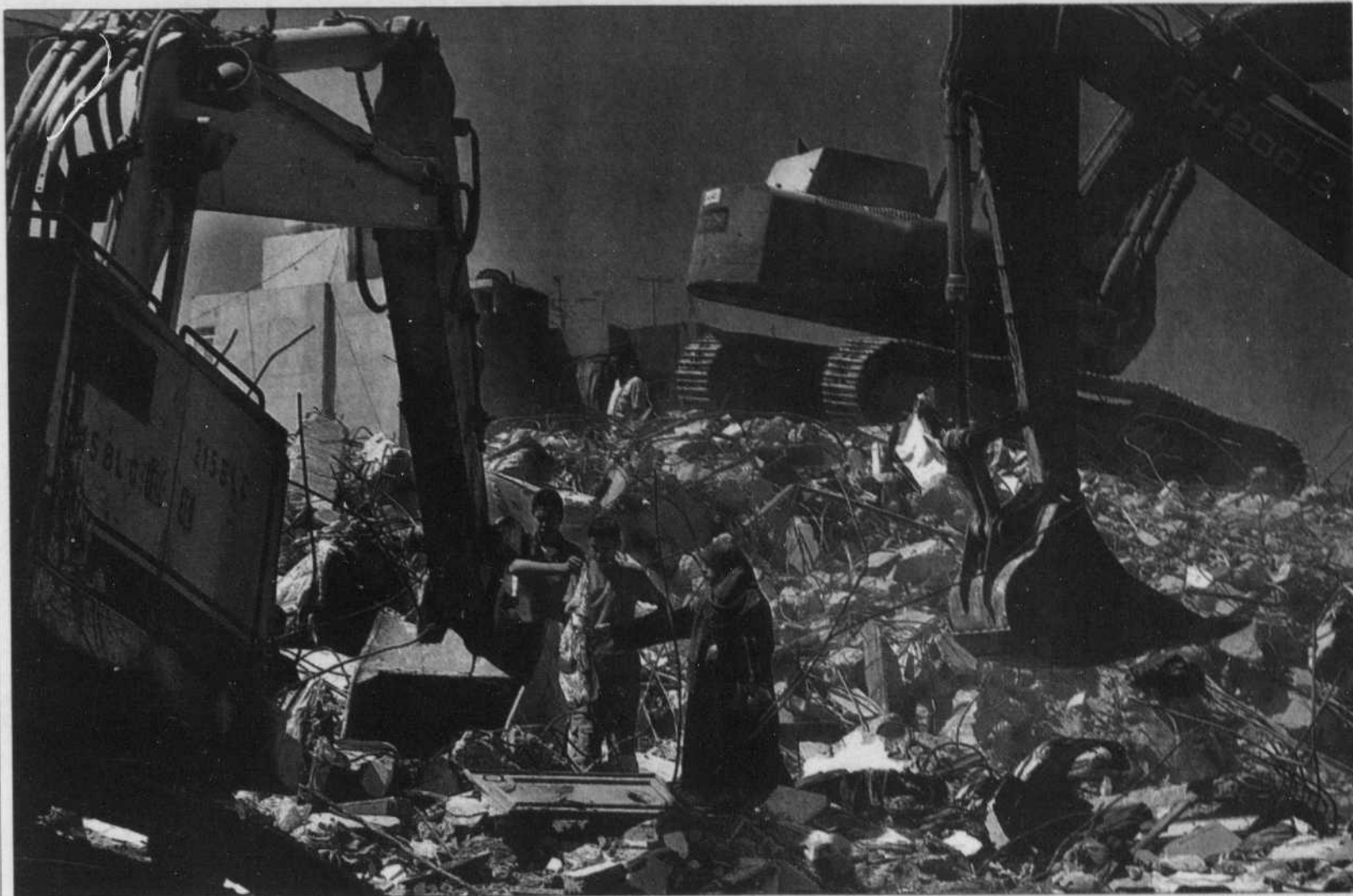
Il faudra des années pour reconstruire les routes, les ponts et les 15 000 maisons détruites au Liban par les bombes israéliennes.

Chose certaine, l'objectif annoncé officiellement par ses organisateurs d'enregistrer 500 millions de dollars a été largement dépassé. C'est la Suède qui a décidé de tenir cette première conférence de donateurs, et ce, dès la cessation des hostilités, le 14 août dernier, après 34 jours de combats, conjointement avec le Liban et l'ONU. Les responsables suédois et libanais ont d'ailleurs indiqué qu'une nouvelle réunion de pays donateurs, axée sur la reconstruction à long terme, devrait avoir lieu ultérieurement, sans donner de date ou de lieu.