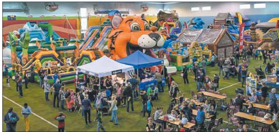
La sixième édition de l'aventure gonflable Leclerc Proludik a été encore une fois très populaire.

Les parents qui ont accompagné leurs enfants aux différentes activités ont profité de toute une expérience, notamment en bénéficiant d'un service de navettes grâce aux autobus Auger pour l'occasion. De plus, un stationnement gratuit était disponible. Un kiosque extérieur Tim Hortons était présent également pour offrir du café et des chocolats chauds gratuits pour les grands et les petits. Un vestiaire et un parc à bottes étaient également disponibles. Un centre bébé était à la disposition des parents pour leur permettre de prendre soin de leurs tout-petits que ce soit pour changer les couches, pour l'allaitement ou simplement pour la détente. ■