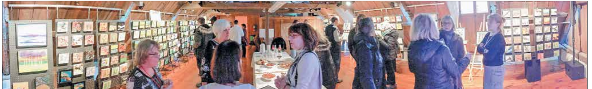
Chaque œuvre vendue a permis de remettre une partie du montant à la Société Saint-Vincent de Paul.