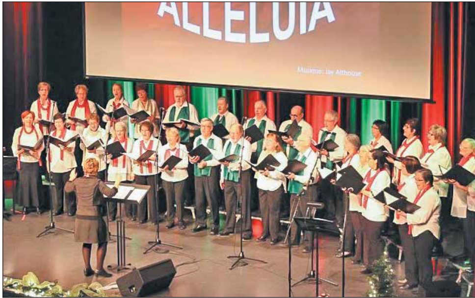
Le Groupe Chant Libre effectue au minimum deux représentations annuelles pour égayer le quotidien des personnes âgées en plus de permettre à d'autres de profiter de leur prestation.

Le Groupe Chant Libre a repris ses activités le 8 janvier dernier. Les répétitions se tiennent tous les lundis à compter de 19 h 15 à la bibliothèque Alain-Grandbois. Le prochain concert du groupe aura lieu le 5 mai prochain. Plus de détails sont disponibles par téléphone : 418 576-8368. ■