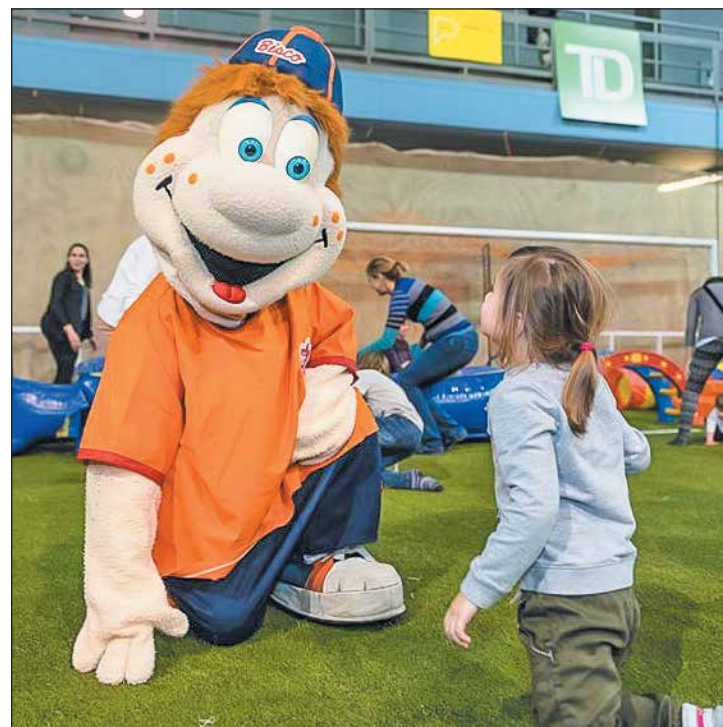
Plusieurs mascottes ont sillonné le sol du Stade Leclerc pour offrir toute une expérience positive aux jeunes.