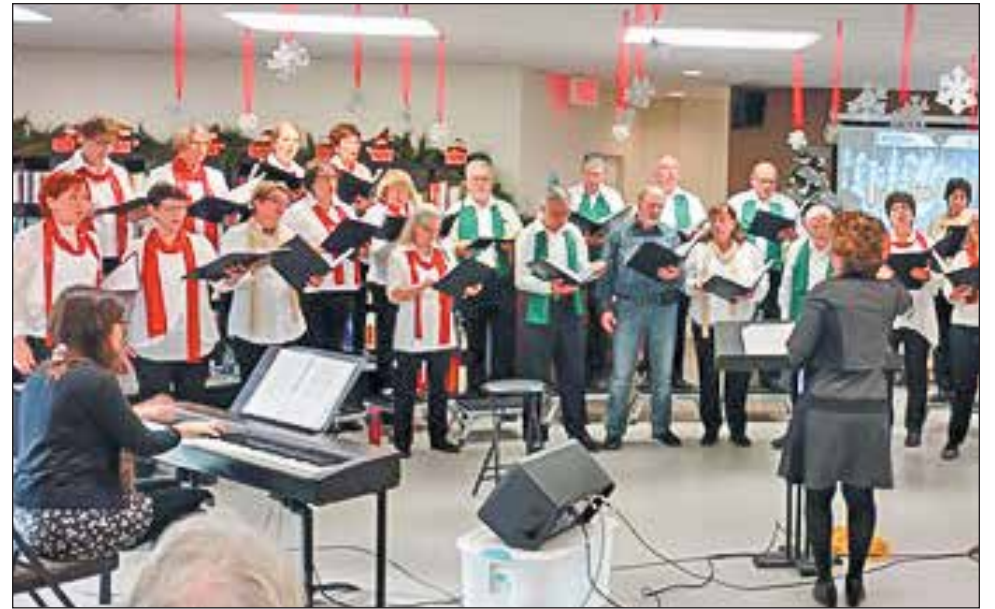
Les membres du Groupe Chant Libre lors de leur représentation à la résidence des Jardins du Haut Saint-Laurent.