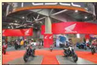
Le Salon de la Moto 2017

Les populaires Salons de la Moto de Québec et de Montréal, présentés par La Capitale Assurances Générales, seront de retour en février 2018 : du vendredi 2 au dimanche 4 février 2018 au Centre de foires de Québec et du vendredi 23 au dimanche 25 février 2018 au Palais des congrès de Montréal. Considérés comme l'ultime rassemblement des nouveaux modèles et gadgets de l'industrie, les Salons de la Moto de Québec et de Montréal seront encore cette année LE rendez-vous des amateurs de sports motorisés, car rien n'arrête la passion, pas même le froid! De nouvel adepte à pilote expert, tous pourront rêver à la saison 2018 et préparer leur prochaine aventure grâce aux différents experts sur place.