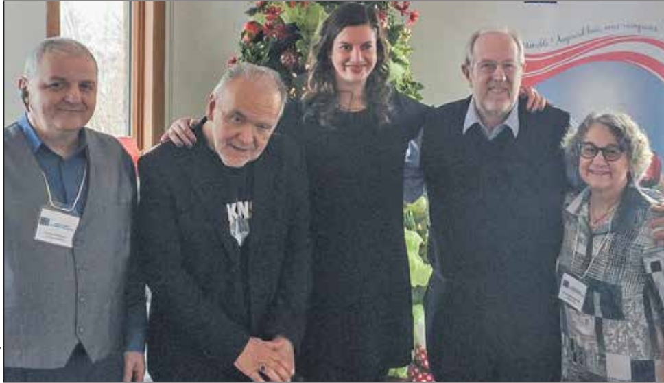
La députée de Louis-Hébert lors du dîner de Noël de Parkinson Région Québec Chaudière-Appalaches en décembre dernier.

De plus, l'élue a participé à la confection de paniers de Noël de l'organisme Présence Famille Saint-Augustin, et ce, avec la présence de plusieurs bénévoles qui ont à cœur d'aider leur prochain dans leurs actes. ■