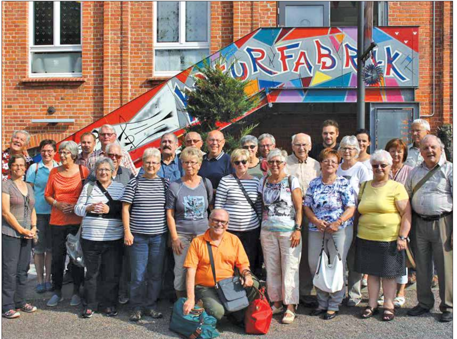
Plusieurs membres de l'Association de jumelage de Cap-Rouge - Saint-Augustin lors de l'un de leurs voyages.