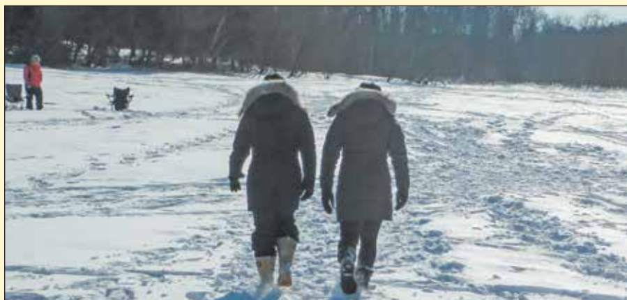
Le lac Saint-Augustin est fréquenté aussi bien pendant la période estivale qu'hivernale.

Surveillez donc l'annonce de ces conférences dans les journaux locaux, sur Internet www.lacsaintaugustin.com ou sur notre page Facebook/Lac St-Augustin. ■