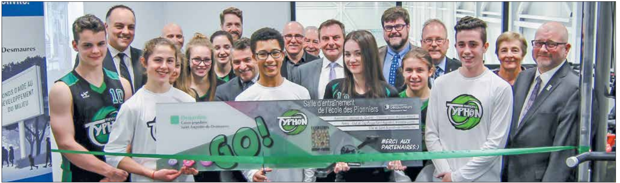
L'ensemble des partenaires accompagnés de certains élèves athlètes lors de l'inauguration officielle de la salle de conditionnement physique de l'école des Pionniers le 7 décembre dernier.

Complexe sportif multifonctionnel de Saint-Augustin-de-Desmaures