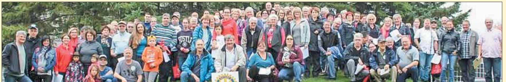
Grâce aux initiatives du Club Rotary de L'Ancienne-Lorette/Cap-Rouge/Saint-Augustin, plusieurs projets prennent vie comme la salle de conditionnement physique de l'école des Pionniers de Saint-Augustin-de-Desmaures.