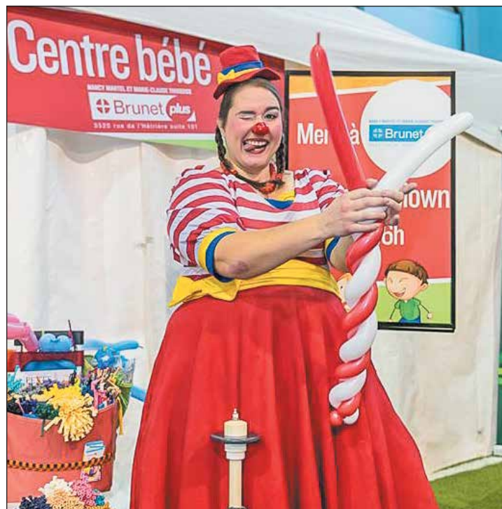
Les plus jeunes ont pu profiter de plusieurs animations lors des festivités au Stade Leclerc.