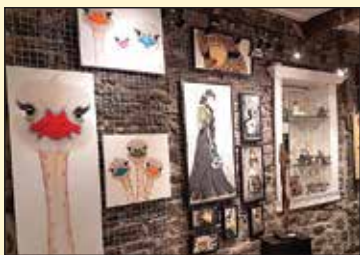
La Galerie ZEN du Quartier Petit Champlain