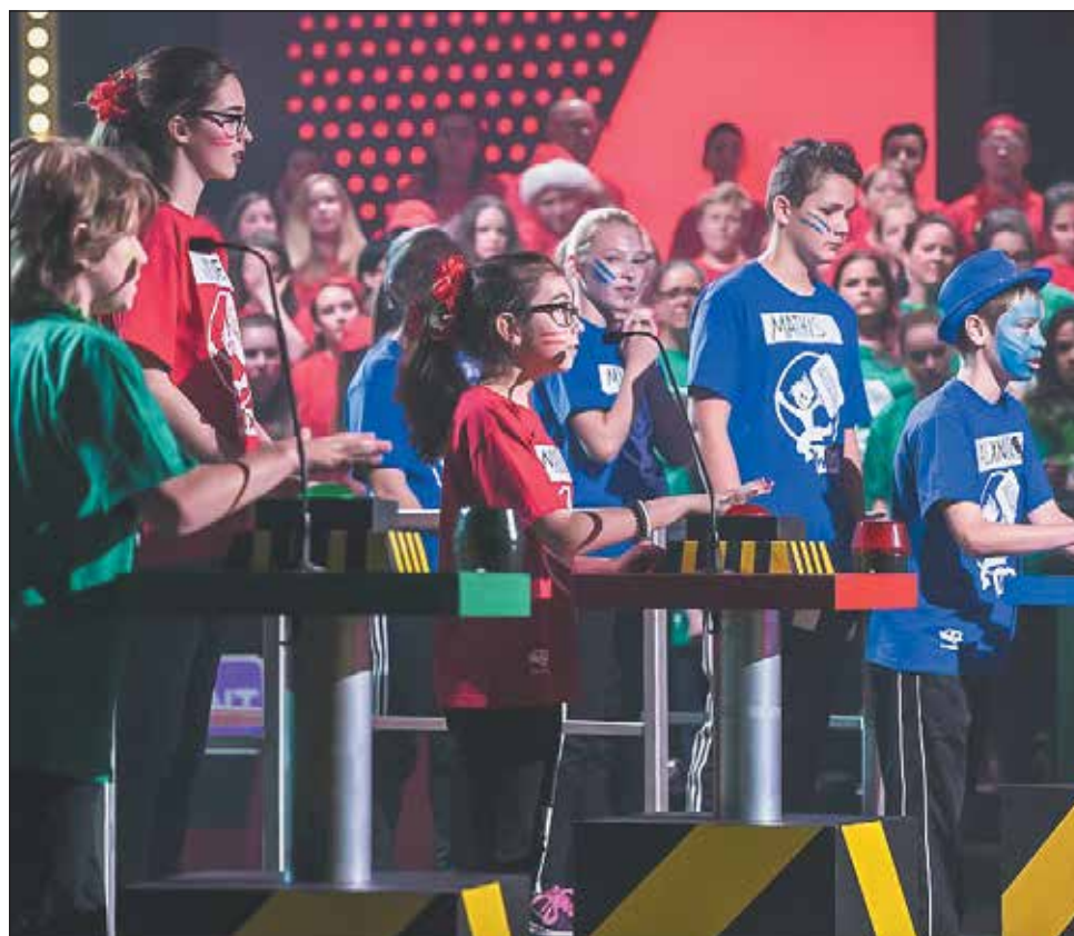
Au total, dix jeunes de l'école secondaire des Pionniers ont participé au dernier passager WIXX sur Télé-Québec.

Cette année, de belles nouveautés ont fait plus que jamais bouger les jeunes : échauffement WIXX, nouveau jeu sur mesure et la participation de Pascal Morissette aux trois finales de la saison étaient au rendez-vous. ■