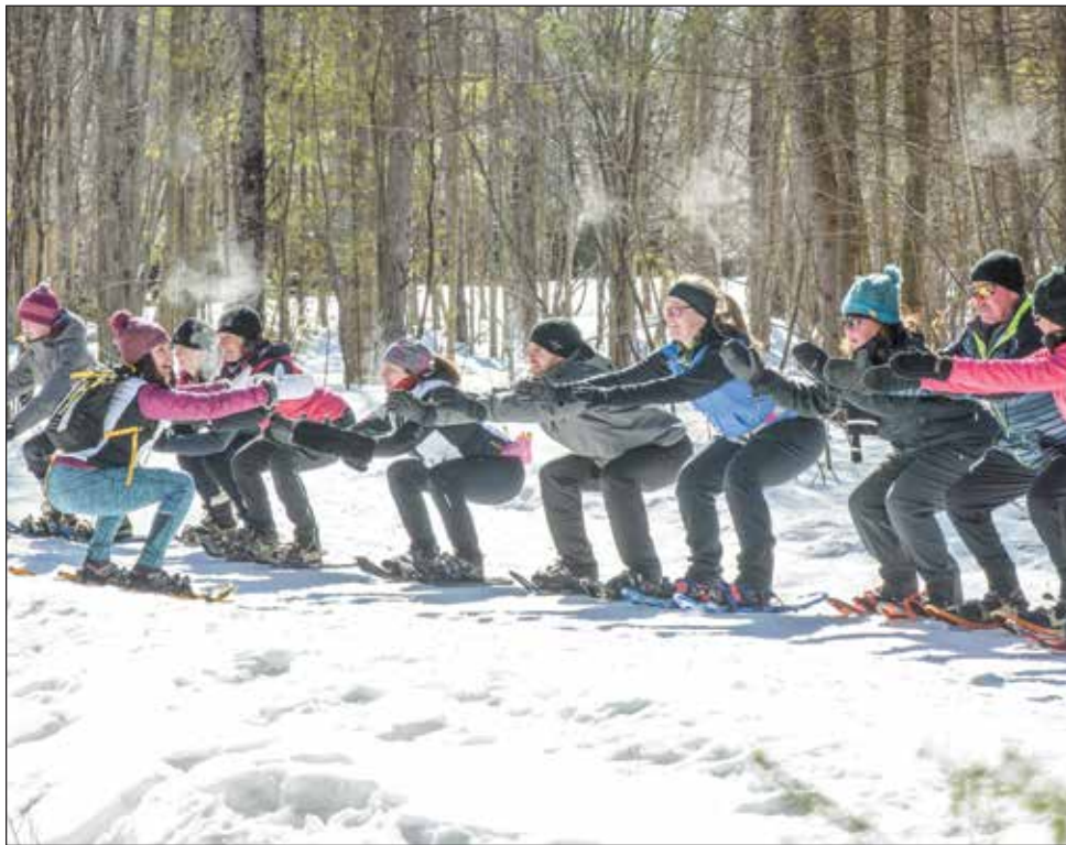
Le nouveau programme Cardio-Raquette offre tout un éventail de choix de parcs pour s'y entraîner.

Depuis maintenant 17 ans, Cardio Plein Air permet à des milliers de Québécoises et Québécois d'être bien et actifs. Pionnière à l'échelle nationale de l'entraînement en nature, l'entreprise propose une dizaine de programmes d'entraînement dans une centaine de parcs de la province. Elle regroupe 48 franchises et plus de 300 entraîneurs certifiés.