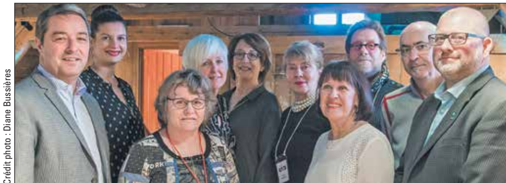
Plusieurs exposants en compagnie des différents représentants politiques lors du vernissage de l'exposition-bénéfice le 10 décembre dernier.