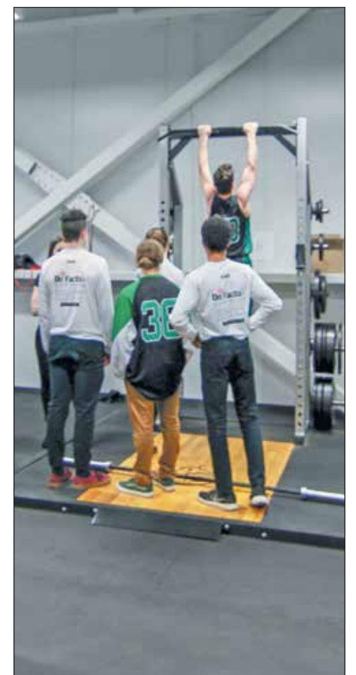
Les jeunes athlètes étaient en pleine action lors de l'inauguration officielle afin que les dignitaires présents prennent connaissance des différentes installations.