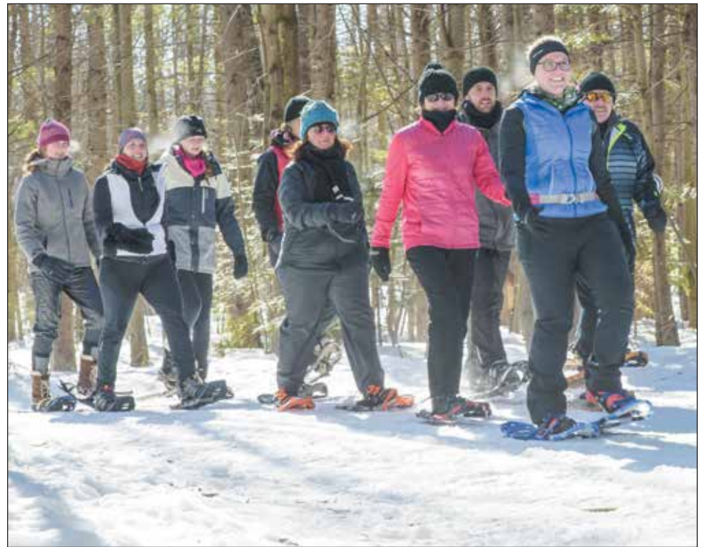
L'entraînement du Cardio-Raquette se veut être très actif et supervisé pour celles et ceux qui veulent y prendre part.