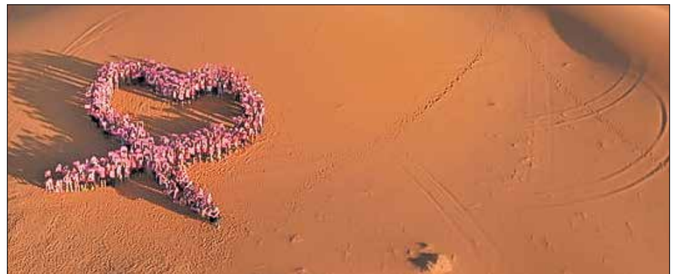
Lors des précédentes éditions, les participantes ont soutenu grandement la cause du cancer du sein.