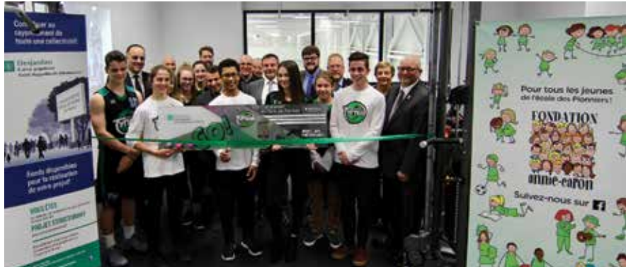
La coupure du ruban symbolique a été effectuée par les représentants des équipes sportives Typhon de l'école, en compagnie des nombreux partenaires.

Ce dernier a bénéficié de l'appui du programme de Fonds d'aide au développement du milieu de la Caisse. L'appel annuel de projets a lieu du 1 er avril au 31 mai.