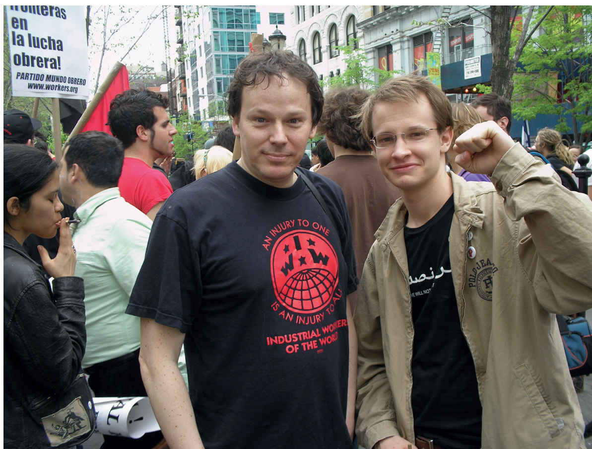
David Graeber (à gauche) lors d'un rassemblement pour les droits des immigrants à Union Square, New York, en mai 2007.

Au sujet de la démocratie, Graeber rappelle que celle-ci n'est pas nécessairement définie par le vote de la majorité. « C'est plutôt un processus de délibération collective basé sur le principe de la complète et égale participation », rappelle-t-il. Pour Graeber, la démocratie, c'est essentiellement un « procédé de résolution collective de problème ». Les êtres humains partagent un grand nombre de « problèmes communs » et, encore aujourd'hui, la plupart s'entendent pour dire que la délibération collective est une manière optimale d'en venir à des solutions. « On est 6 millions, faut s'parler », disait la pub. Pourquoi alors, demande Graeber, l'idée que nous tentions vraiment de mettre en œuvre un tel processus est-elle décriée comme une chimère ?