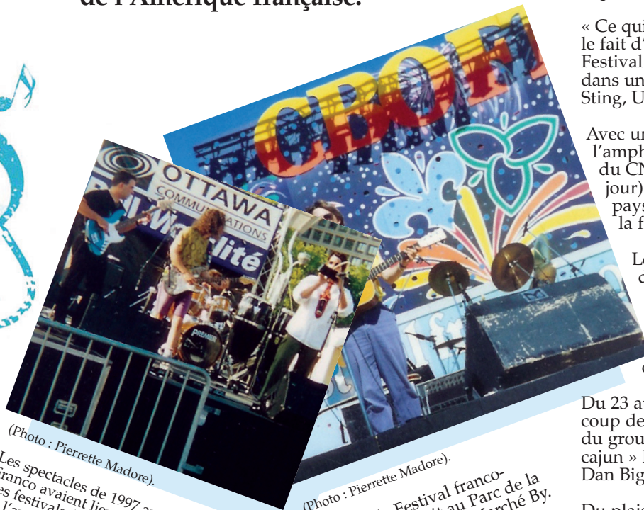
Les spectacles de 1997 au Franco avaient lieu à Place des festivals (hôtel de ville de l'ancienne municipalité régionale, maintenant d'Ottawa).