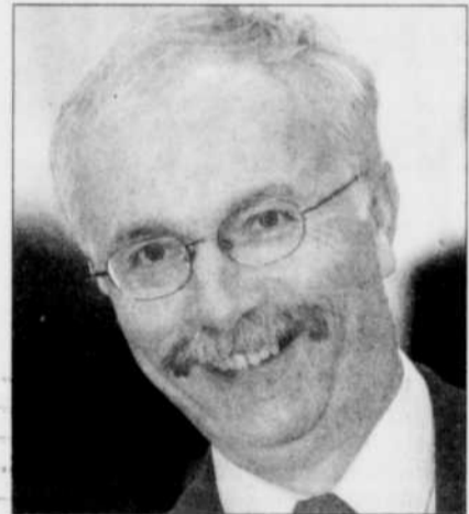
« À sa place, j'aurais eu l'impression d'avoir livré la marchandise », juge Marcel Corriveau.