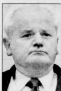
Slobodan Milosevic, hier

LA HAYE (AP et AFP) — Nouvel ajournement dans le procès Milosevic. Le Tribunal pénal international de La Haye a différé hier la présentation par l'ancien maître de Belgrade de sa défense devant le TPI en raison de son état de santé. Un avocat indépendant affirme même que l'ex-président yougoslave pourrait ne pas être en mesure de poursuivre son procès, entrepris il y a deux ans.