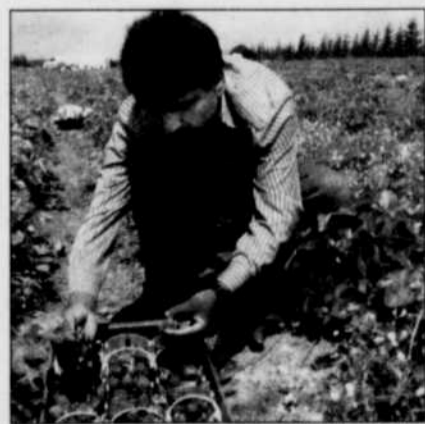
Les Mexicains qui travaillent dans nos champs de fraises sont victimes de l'ALENA, écrit un lecteur.

Il y a 25 ans, l'agriculture mexicaine appartenait à de petites communautés agricoles autosuffisantes. Avec l'accord de libre-échange, le gouvernement mexicain a dû réduire considérablement son aide gouvernementale. Selon une étude de l'ONU, le taux de pauvreté chez les fermiers mexicains atteindrait aujourd'hui les 75%. Ce même accord qui les a appauvris, l'ALENA, a fait passer le contrôle des terres aux mains de multinationales canadiennes et états-unienues, grâce aux sections sur les investissements transnationaux. Avec un bout de papier et quelques signatures, on a étouffé l'agriculture mexicaine, achetant ce qu'il en restait, et mis à la porte les gens qui y gagnaient leur vie.