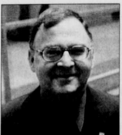
« Le quartier Saint-Roch, c'était une verrue en plein centre-ville qui a causé des problèmes à tous les autres maires », selon Yvan Lachance.