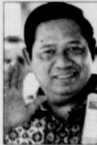
Susilo Bambang Yudhoyono

■ JAKARTA — Un général à la retraite, Susilo Bambang Yudhoyono (« SBY »), a remporté hier le premier tour des premières élections présidentielles au suffrage direct en Indonésie, selon des projections d'une organisation indépendante, six ans après la chute du dictateur Suharto. Ex-ministre de la Sécurité, Susilo Bambang Yud-