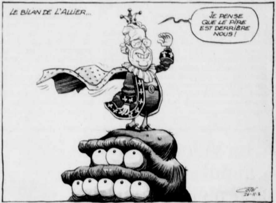
PUBLIÉE LE 26 NOVEMBRE 2002