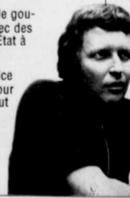
Jean-Paul L'Allier en 1971

□ Défait comme député dans Deux-Montagnes en 1976.