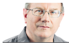
ANDRÉ DUCHESNE TEXTES ET PHOTOS NORMANDIE

Elle est tellement visible qu'elle a servi de point de repère pour les péniches chargées de soldats canadiens à l'assaut des plages de Bernières-sur-Mer, le matin du débarquement. Et pourtant, elle demeure aujourd'hui l'un des secrets (touristiques) les mieux gardés de la Normandie.