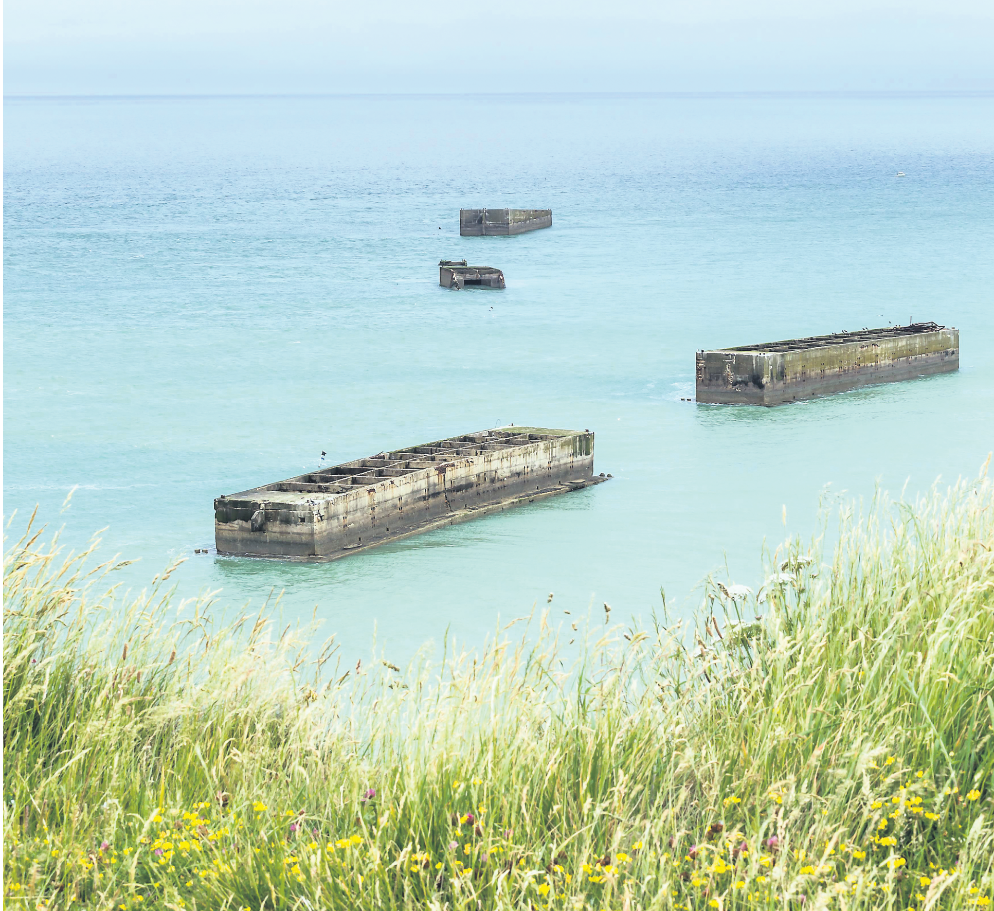
Des plages normandes, on aperçoit les restes des caissons utilisés par les Alliés, après le Débarquement de 1944.

UN DOSSIER D'ANDRÉ DUCHESNE À LIRE EN PAGES 4 ET 5