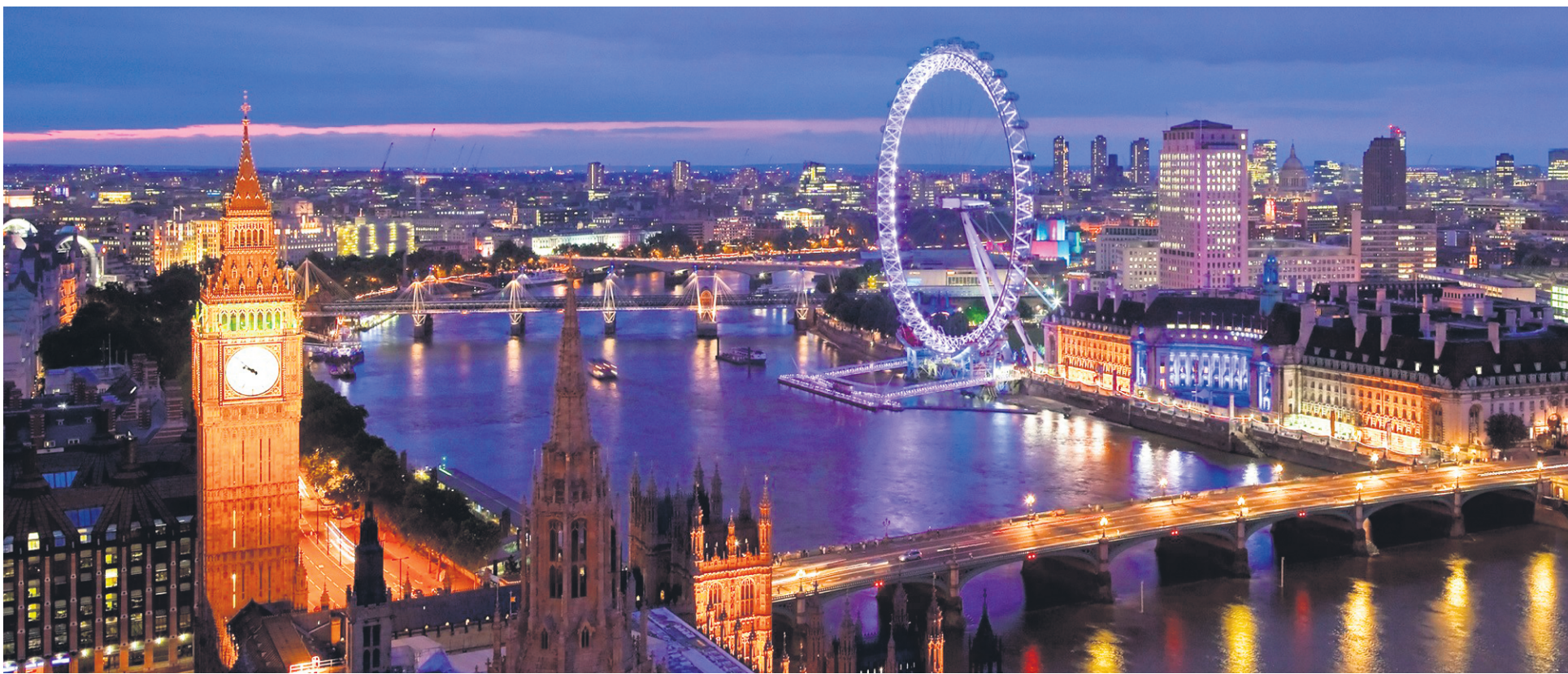
Un panorama typique de Londres, à la tombée de la nuit