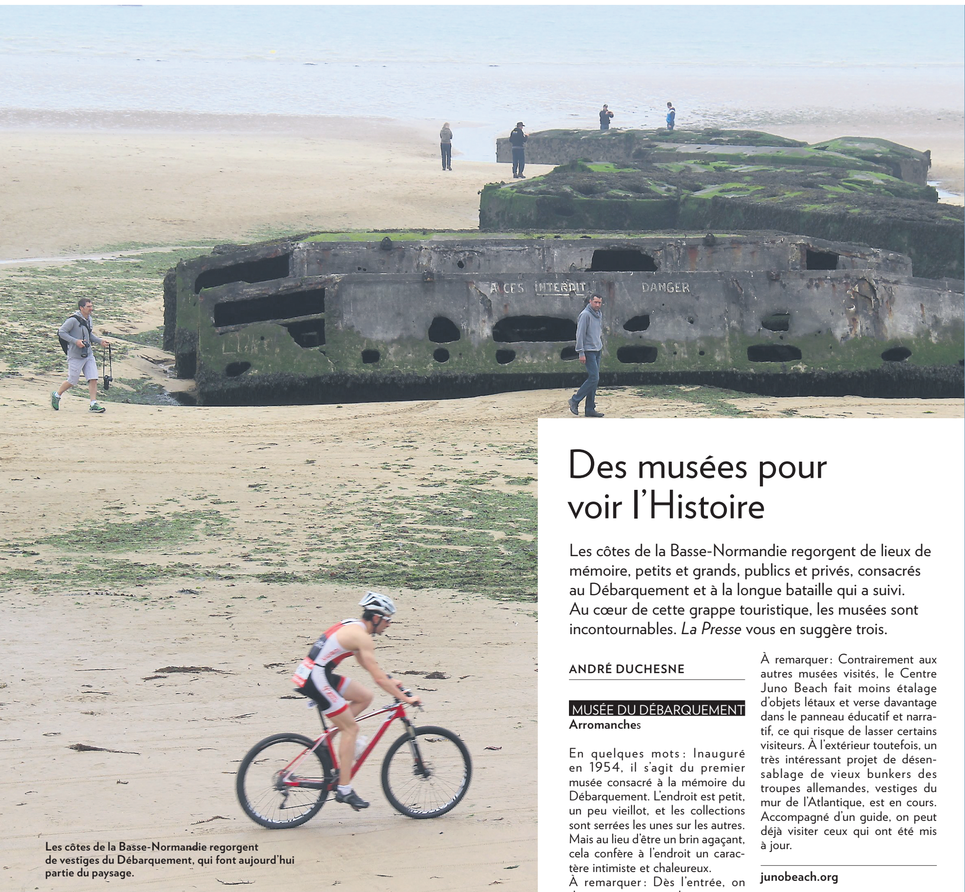
Les côtes de la Basse-Normandie regorgent de vestiges du Débarquement, qui font aujourd'hui partie du paysage.