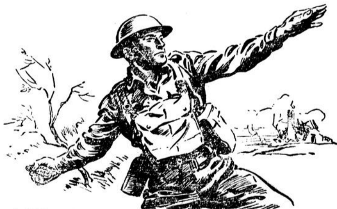
AUJOURD'HUI: Le capitaine Benoit s'illustre sur les champs de bataille d'Europe... il se bat contre les Nazis et leur "passe" des grenades plus souvent qu'à leur tour!

Faisons notre part sans hésiter et la victoire sera assurée