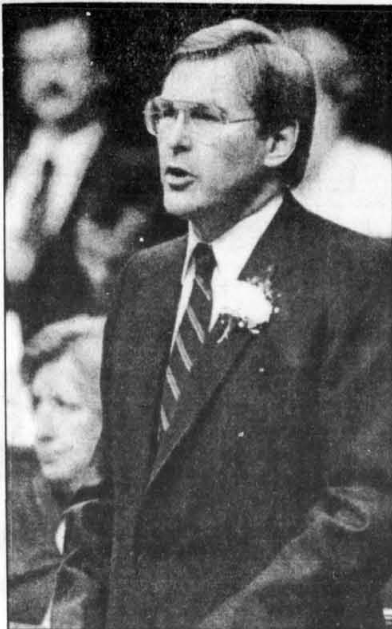
Le ministre des Finances, Michael Wilson, a présenté hier son second budget.

L'attaque au déficit était généralement qualifiée hier de «timide» par les observateurs, en particulier les milieux d'affaires qui s'attendaient à quelque chose de plus spectaculaire. Les hauts fonctionnaires des Finances s'estimaient malgré tout satisfaits, soulignant que leur patron, Michael Wilson, a rempli