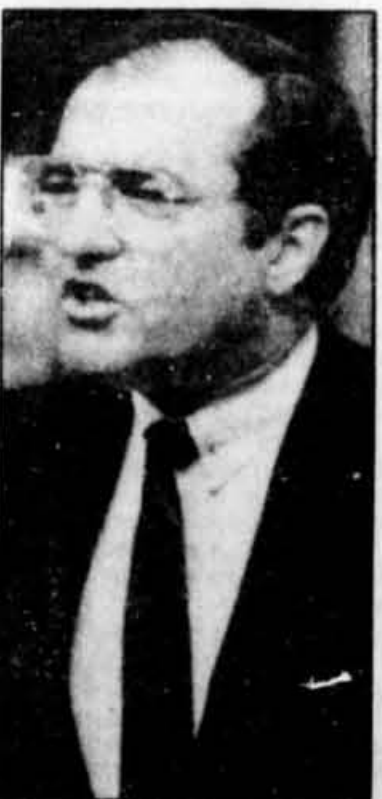
Le ministre Harvie Andre