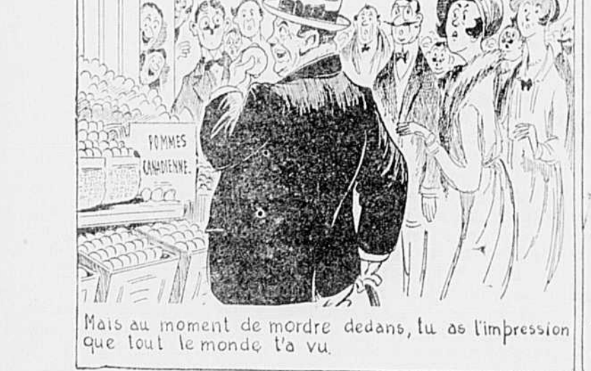
Mais au moment de mordre dedans, tu as l'impression que tout le monde t'a vu.