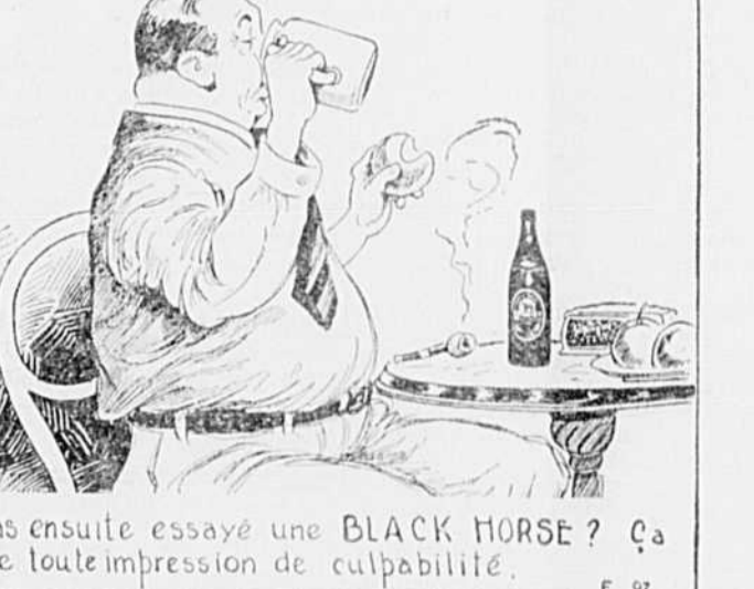
Tas pas ensuite essayé une BLACK HORSE? Ça efface toute impression de culpabilité.