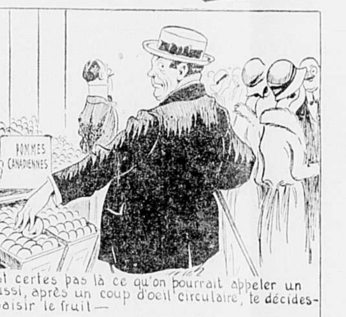
Ce n'est certes pas là ce qu'on pourrait appeler un vol—aussi, après un coup d'oeil circulaire, le décides-tu à saisir le fruit—